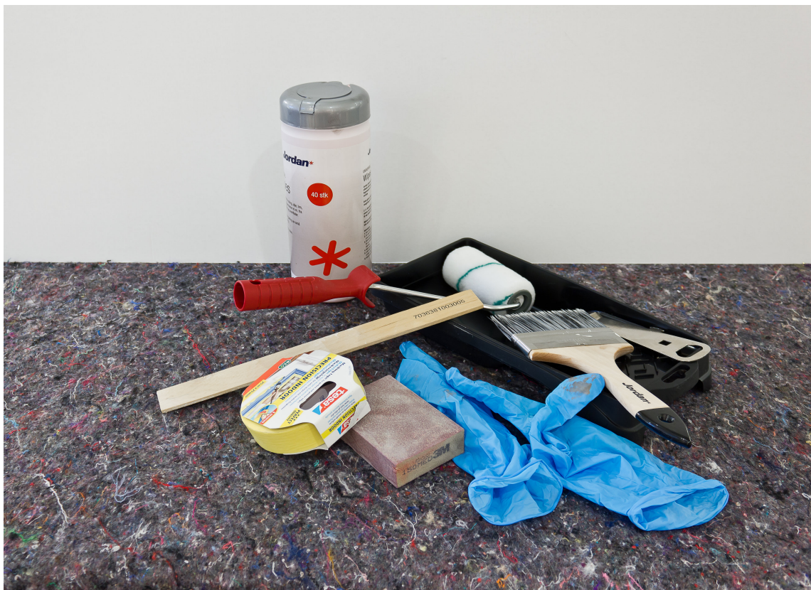
VERKTØY: Pensler og ruller av god kvalitet gjør jobben raskere og med bedre resultat.

Pensler som mister busten i den nymalte flaten og ruller som spruter maling og lager grovt mønster ødelegger sluttresultatet. Velgverktøy av god kvalitet. Det gjør jobben både raskere og enklere. En god pensel tar opp mye maling og gir den fra seg i et passe tempo. Det gjør at du kan male lenger på hvert dypp og med minst mulig søl. Husk at du kan trenge flere pensler og ruller dersom du skal male med flere farger og på ulike flater. Velg størrelse på verktøyet etter det du skal male.