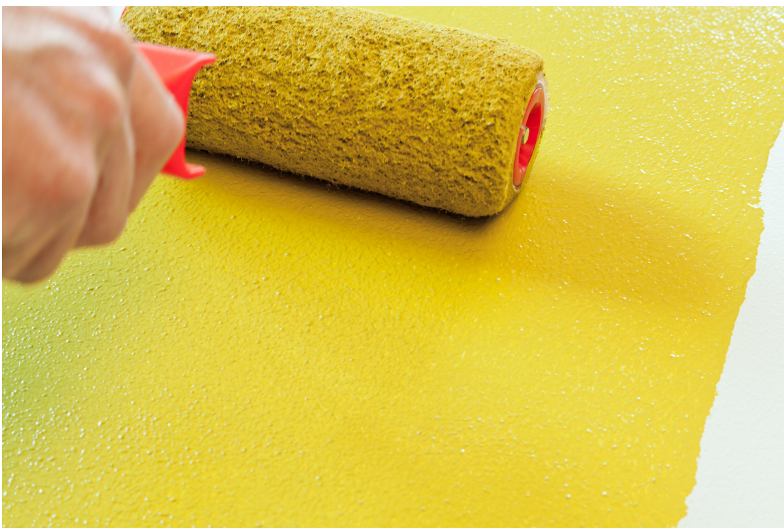
VÅTT-I-VÅTT: Arbeid effektivt og raskt, slik at du maler deg inn i våt maling hele veien.