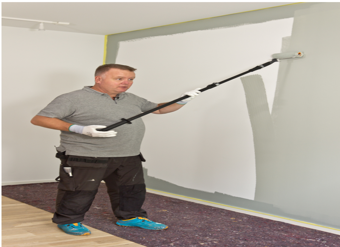
SYSTEMATISK:Arbeid systematisk over flaten. Begynn i ene siden og jobb deg systematisk videre.