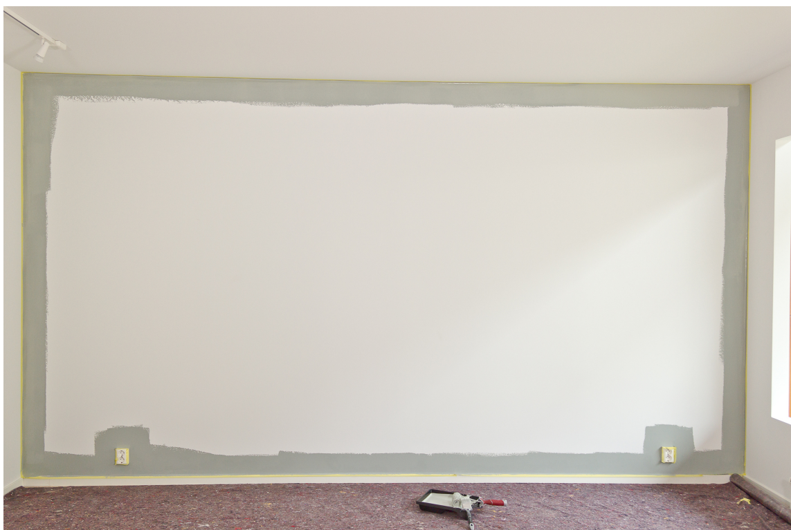
RAMME INN ROMMET: Med en skrå pensel maler du tett inntil tapen. For å ikke komme bort i flater som ikke skal males rammer du inn veggene med en midrull før du setter i gang med den store flaten og en større malerull.