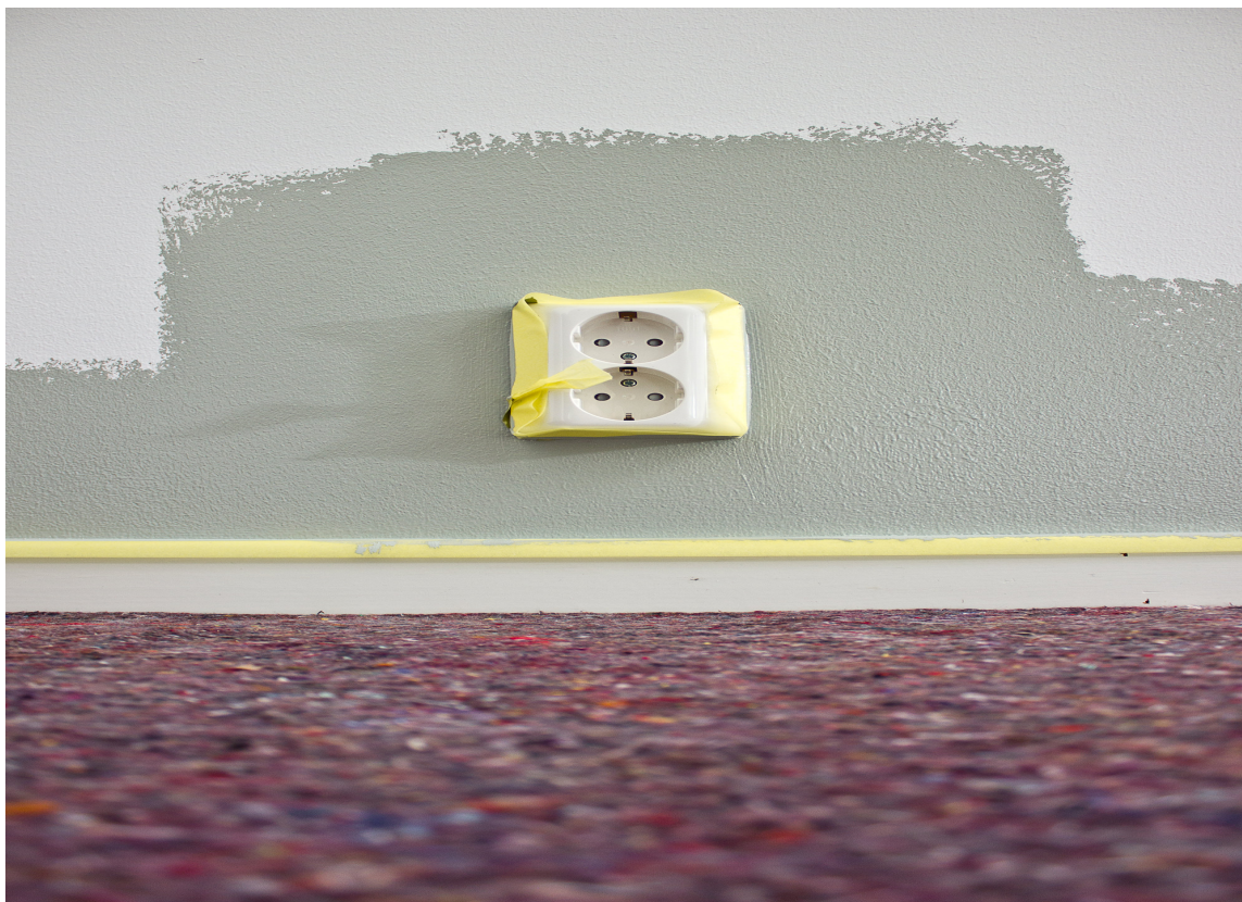
SETT AV: Mal først med pensel så med midrull rundt lister, kontakter og brytere.