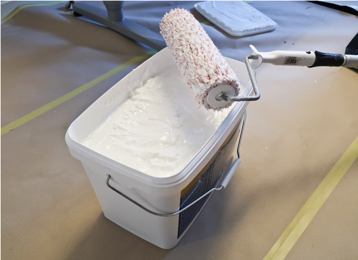
NOK LIM: Normalt forbruk av tapetlim er 1 liter til ca. 3-5 kvadratmeter. – Bruk rulle og legg et jevnt lag med lim, sier Tom Rune Bergestuen hos Borge.