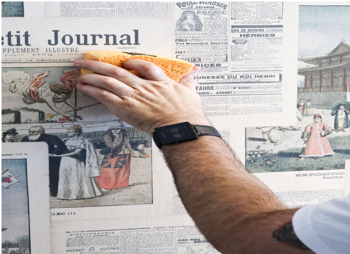
LIMVASK: Når du limer kan det fort bli søl. Lim i skjøter kan enkelt vaskes bort med en fuktig svamp.