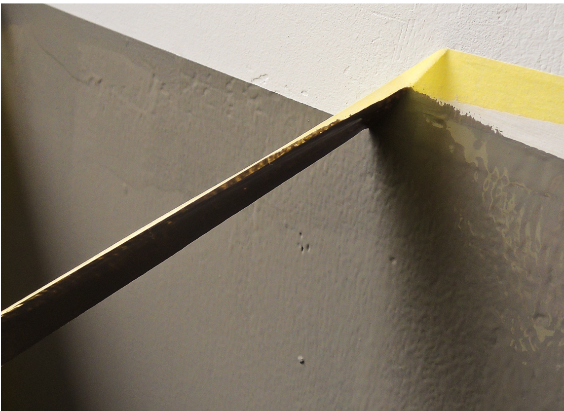
IKKE VENT PÅ TØRK: Riv vekk tapen mens malingen fortsatt er fuktig etter påføring av andre strøk med dekorfargen.