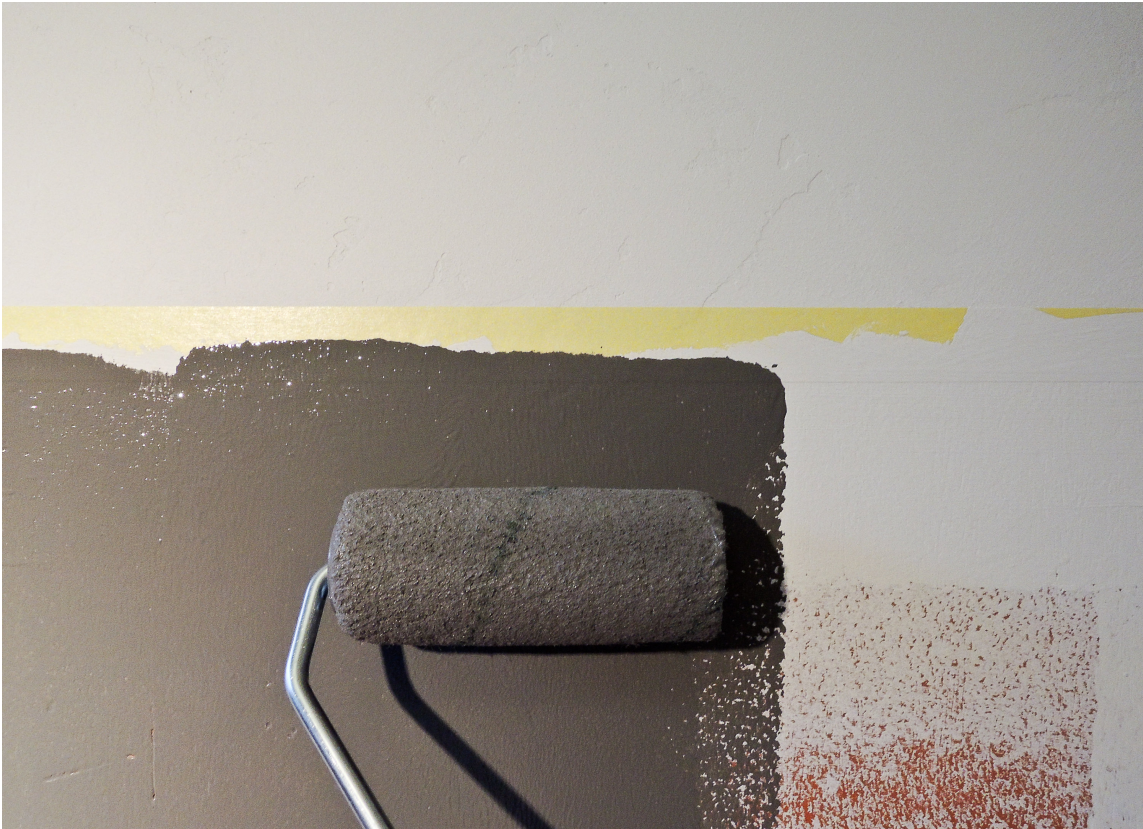
DEKORFARGE: Den mørkere dekorfargen skal være nederst på veggen og påføres i to strøk opp til, og litt ut på tapen.