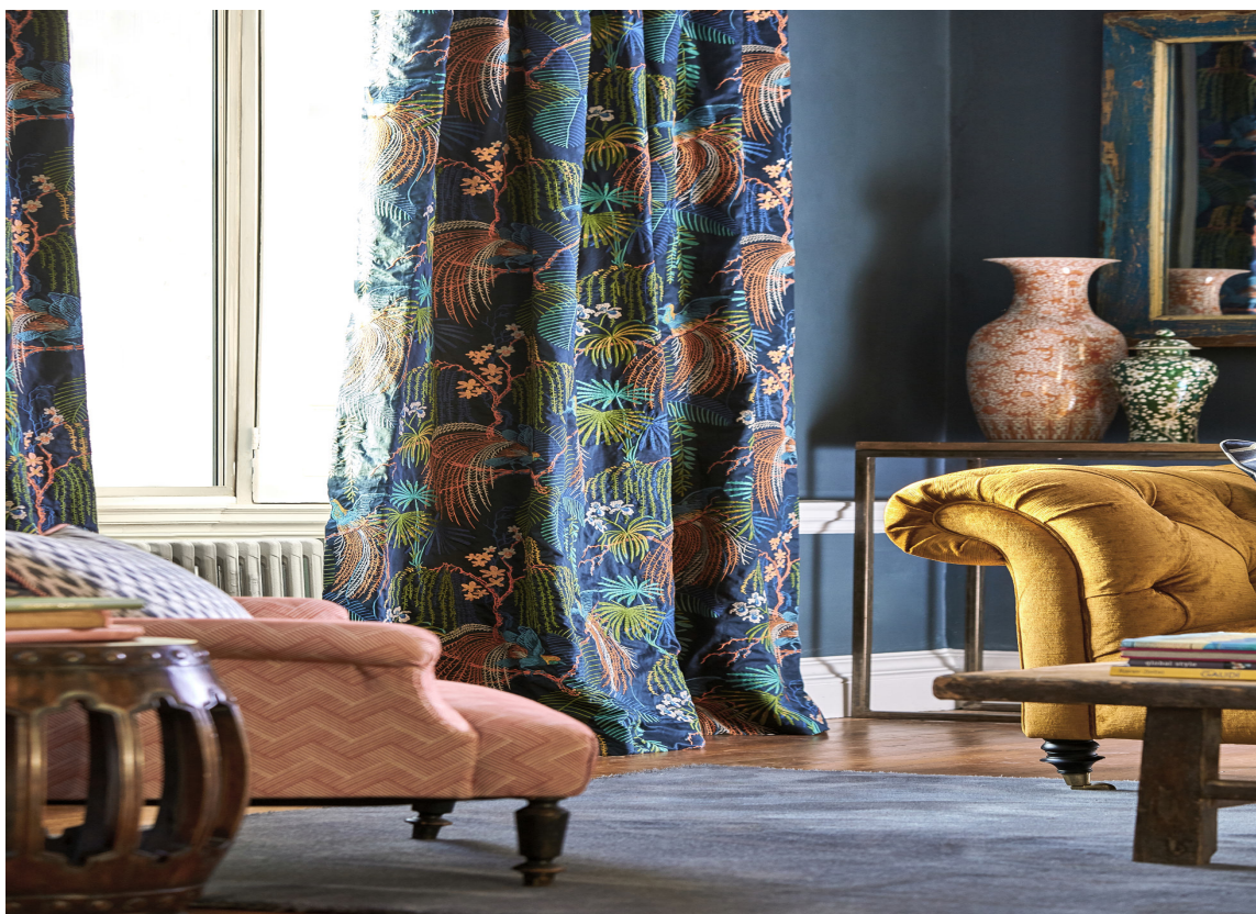
GARDINER LUNER: Lange, fôrede gardiner stenger kulden ute om høsten og vinteren, og luner også estetisk. Gardiner fra Sanderson/Intag.