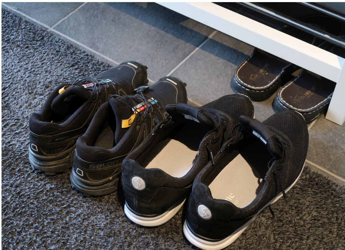
FUKTSLUKER: Matter som suger opp fukten er viktig for å ta vare på gulvet i gange.