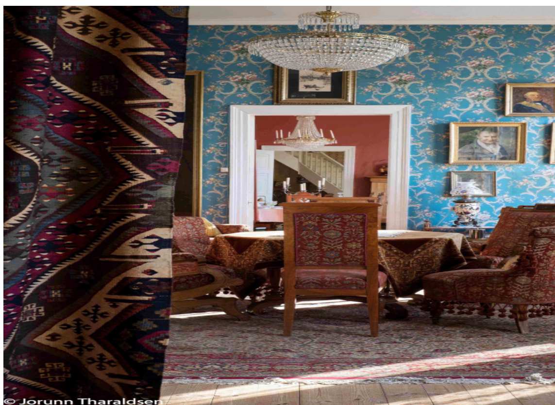
GIMLE: På den gamle herregården Gimle på Sørlandet er interiørene bevart slik de sto på slutten av 1800-tallet. Her er det stue på stue med inspirasjon.

– Atmosfære og stemning handler om å skape samspill mellom farger og materialer, kommenterer de.