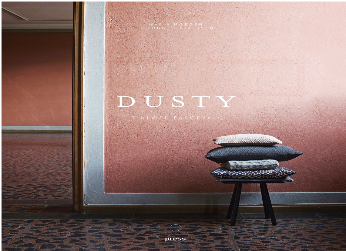
BOKEN: «DUSTY – tidløse fargevalg» er utgitt på Forlaget Press 2018. I tillegg til inspirerende fortellinger og bilder, er det definert fargepaletter for hvert kapittel beskrevet med NCS-koder.