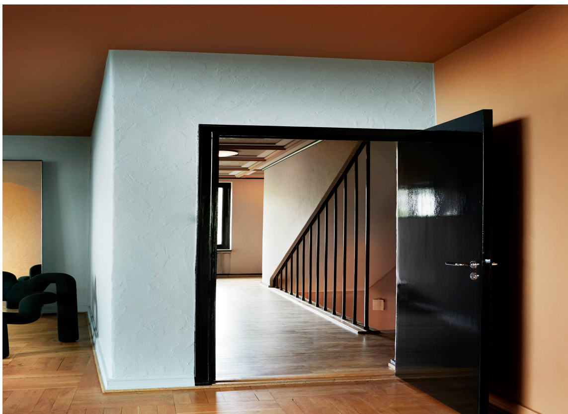
MØTE: Varme farger møter kjøligere toner, og fargene kompletterer hverandre. Veggene er i fargen "Polar Blue", høyre vegg i "Kenyan Copper" og veggene i gangen i "Skin Powder". Alt Classico. Dør/vinduer malt med Traditional Paint i fargen "Black".