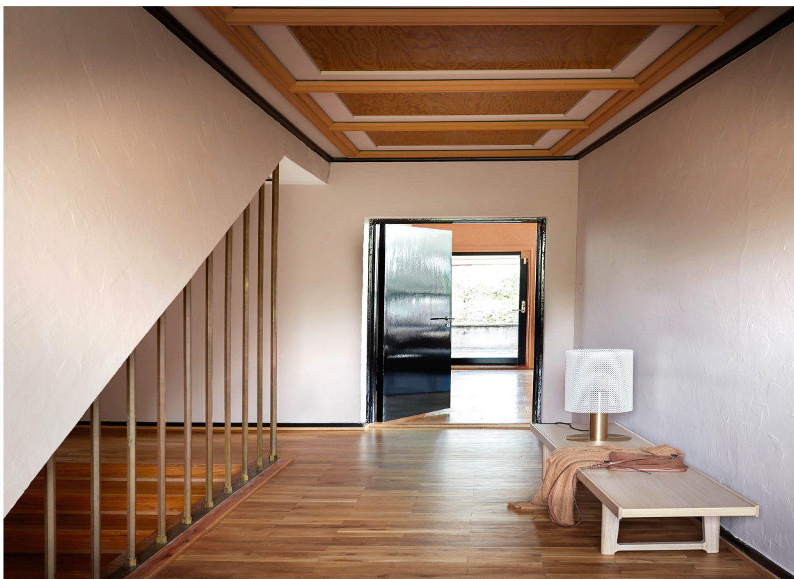
BASIS: Fargen "Skin Powder", en dempet og sofistikert farge, som her er brukt på veggene, er den perfekte nye basisfargen. Dør- og døromramminger er malt med Traditional Paint i fargen "Black".