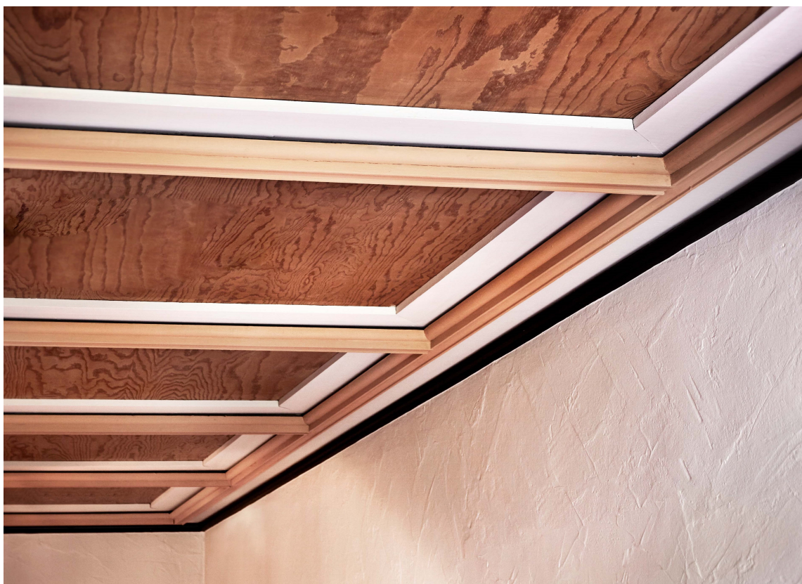
ARKITEKTUR: Fargene brukes her for å fremheve arkitektoniske detaljer, som i taket i gangen, der fargene "Kenyan Copper" og "Skin Powder" markerer detaljene i taket. Veggene er malt i fargen "Skin Powder". Alt malt med Classico.