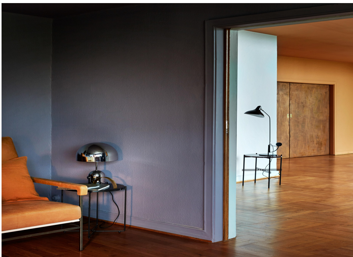
SAMSPILL: Spennende fargekombinasjoner preger villaen. Vegger og tak i fremste rom er malt i fargen "Bohemian", den blå veggen i neste rom i fargen "Polar Blue", mens oransje vegg og tak innerst er malt i "Kenyan Copper". Alt malt med Classico.