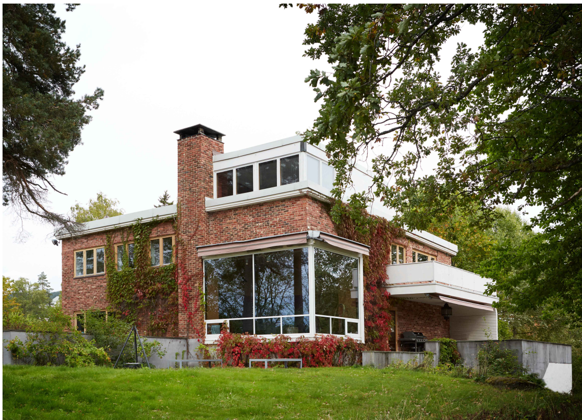
VILLA: Den vakre villaen som er fargesatt er tegnet av Ole Øvergaard.