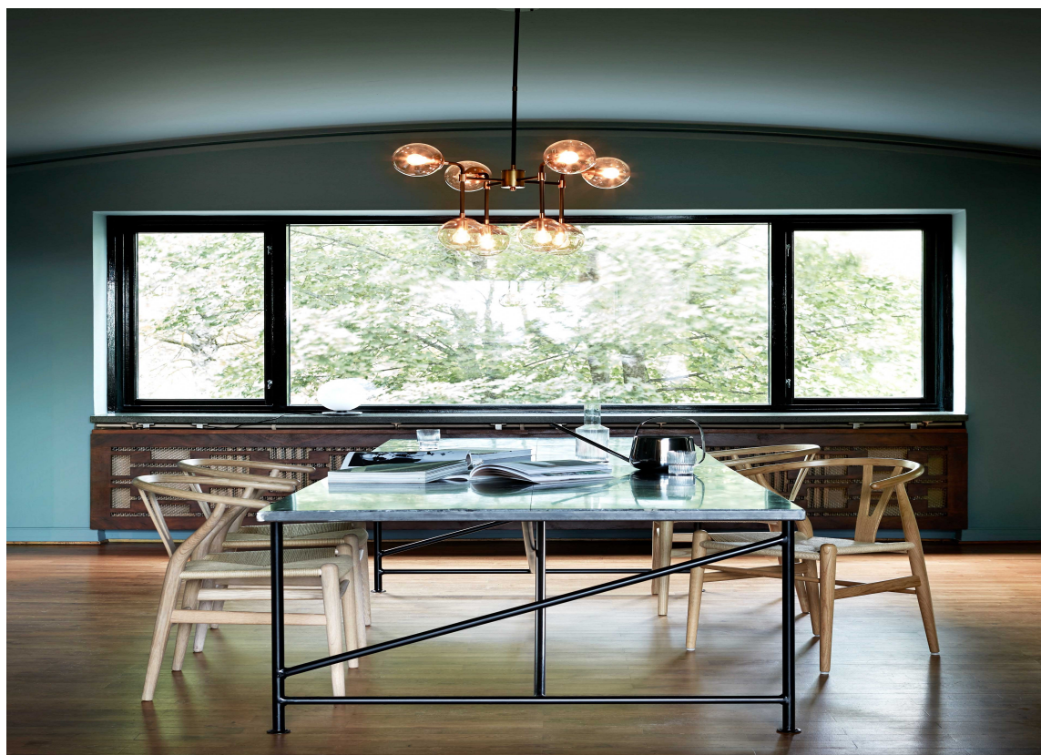
LEK: Kompleks fargebruk og lek med lys, farger, vinkler, materialer og skygger preget modernismen. I spisestuen er veggene og taket malt med Classico i fargen "Blue Reef" og vidusomramminger malt med Traditional Paint i fargen "Black".