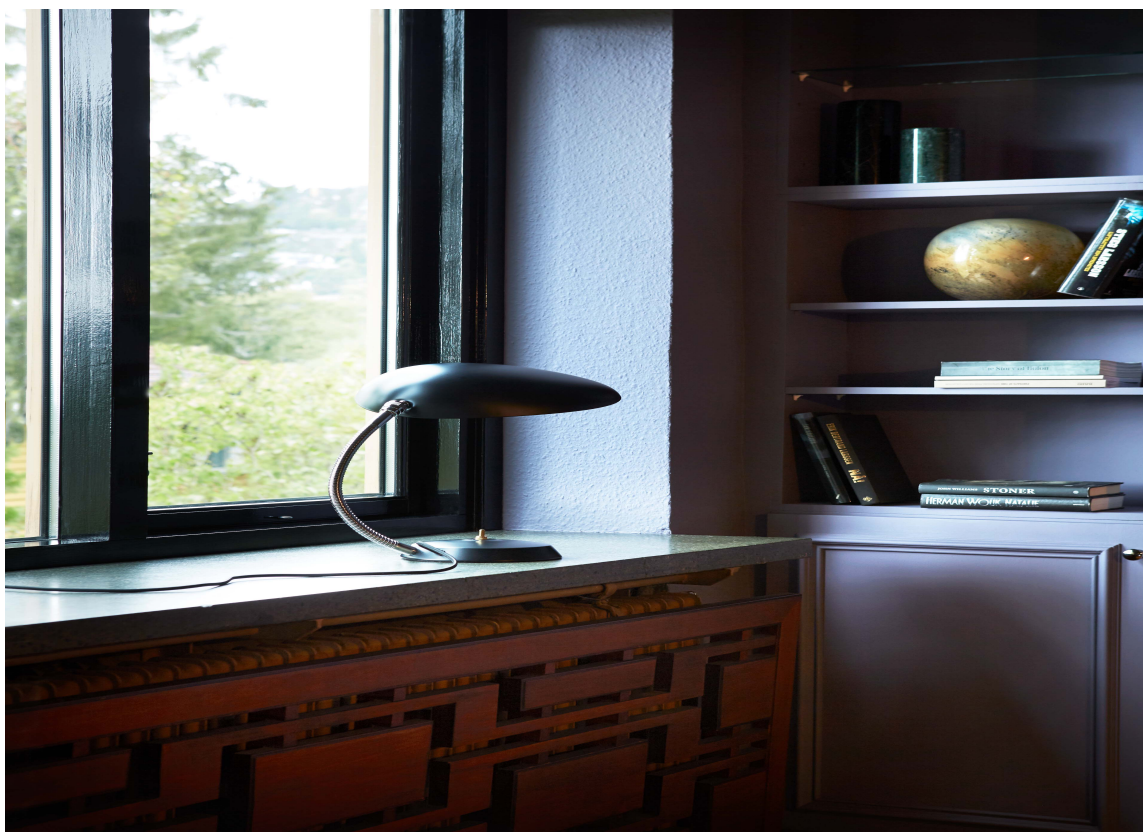
GLANS: Dempete nyanser i matt finish møter høyglanset sorte vindusomramminger for en spennende effekt. Vegger og skap er malt med Classico i fargen "Bohemian", mens vindusomrammingen er malt med Traditional Paint i "Black".