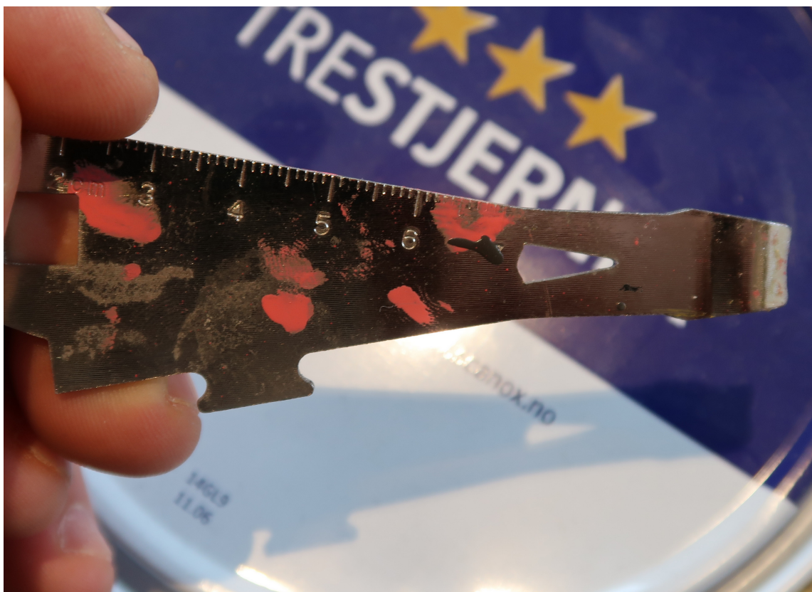
ALT I ETT: Dette lille verktøyet kan gjøre mange tidsbesparende oppgaver. Som å være boksåpner, linjal eller skrujern.