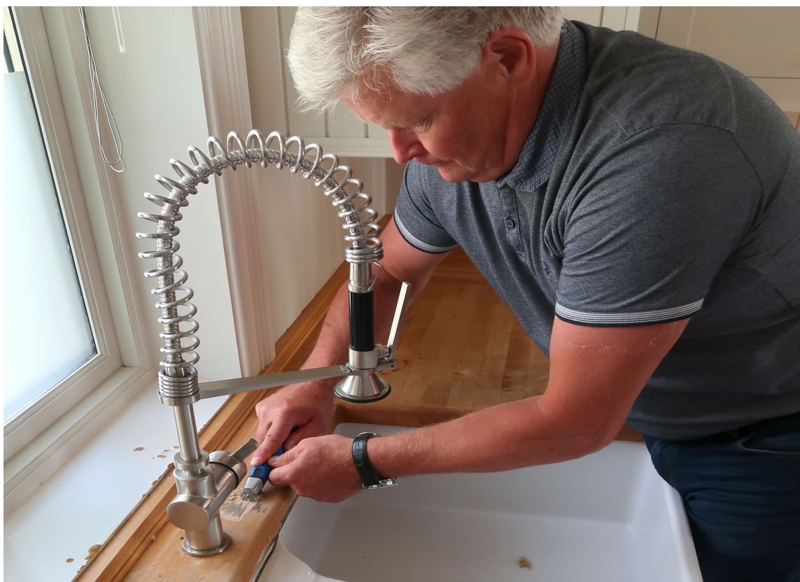
SMART SKRAPE: Skal du skrape detaljer på dører eller vinduer trenger du en universalskrape.