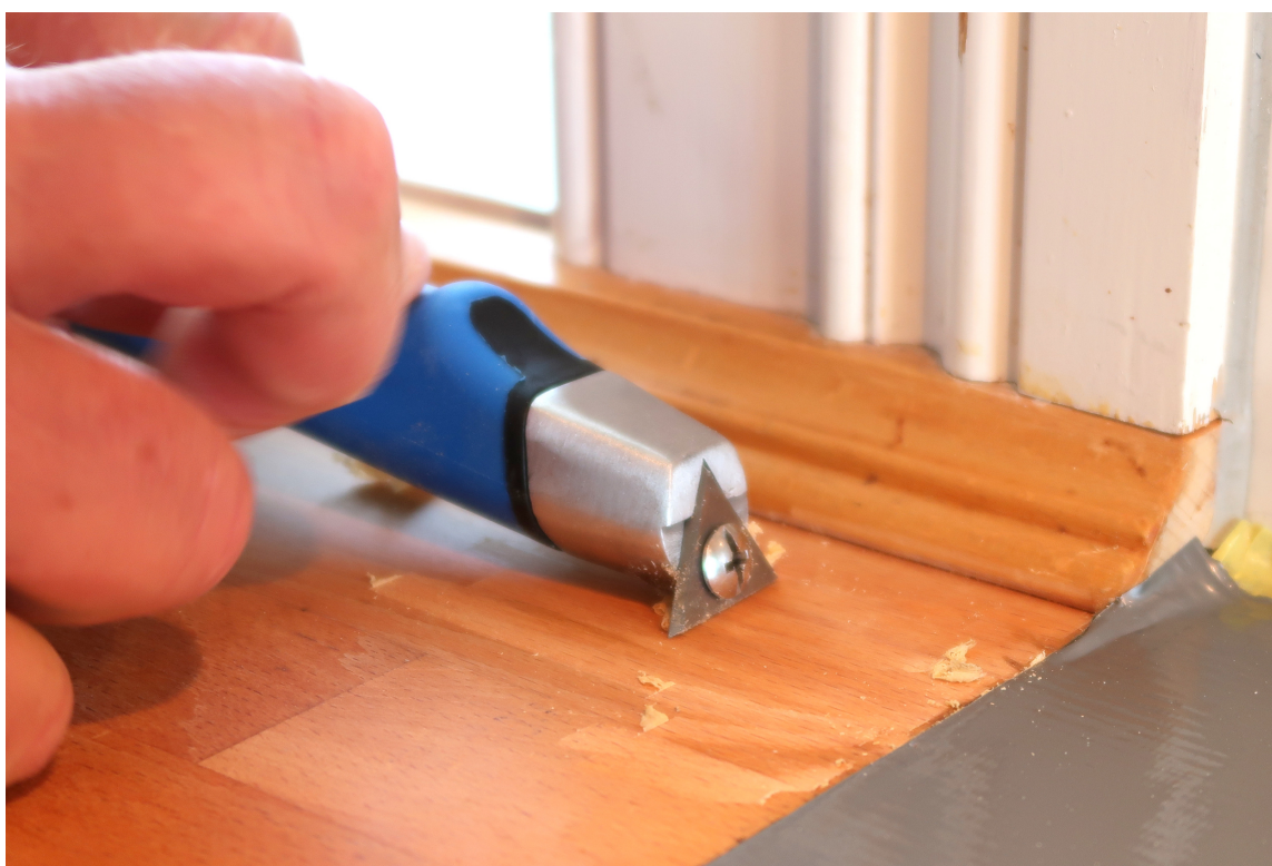
SMART SKRAPE: Skal du skrape detaljer på dører eller vinduer trenger du en universalskrape.