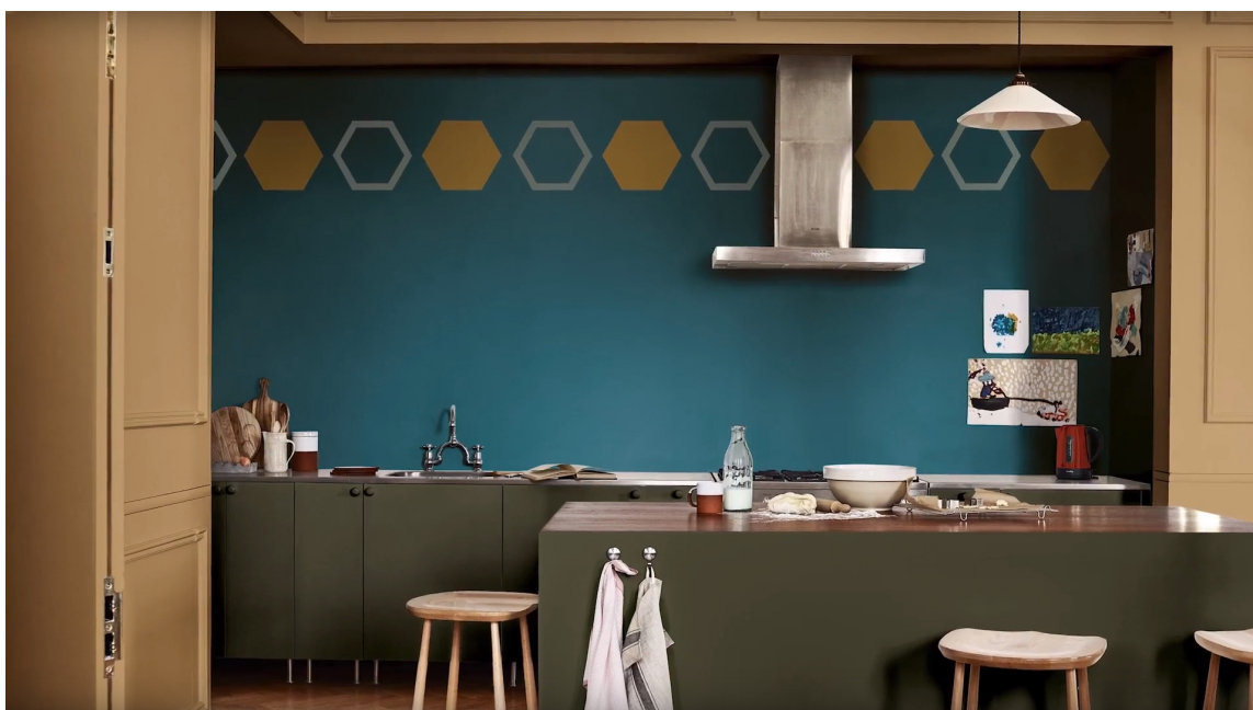
TØFT: Med litt arbeidsinnsats kan du få et unikt og tøft interiør.