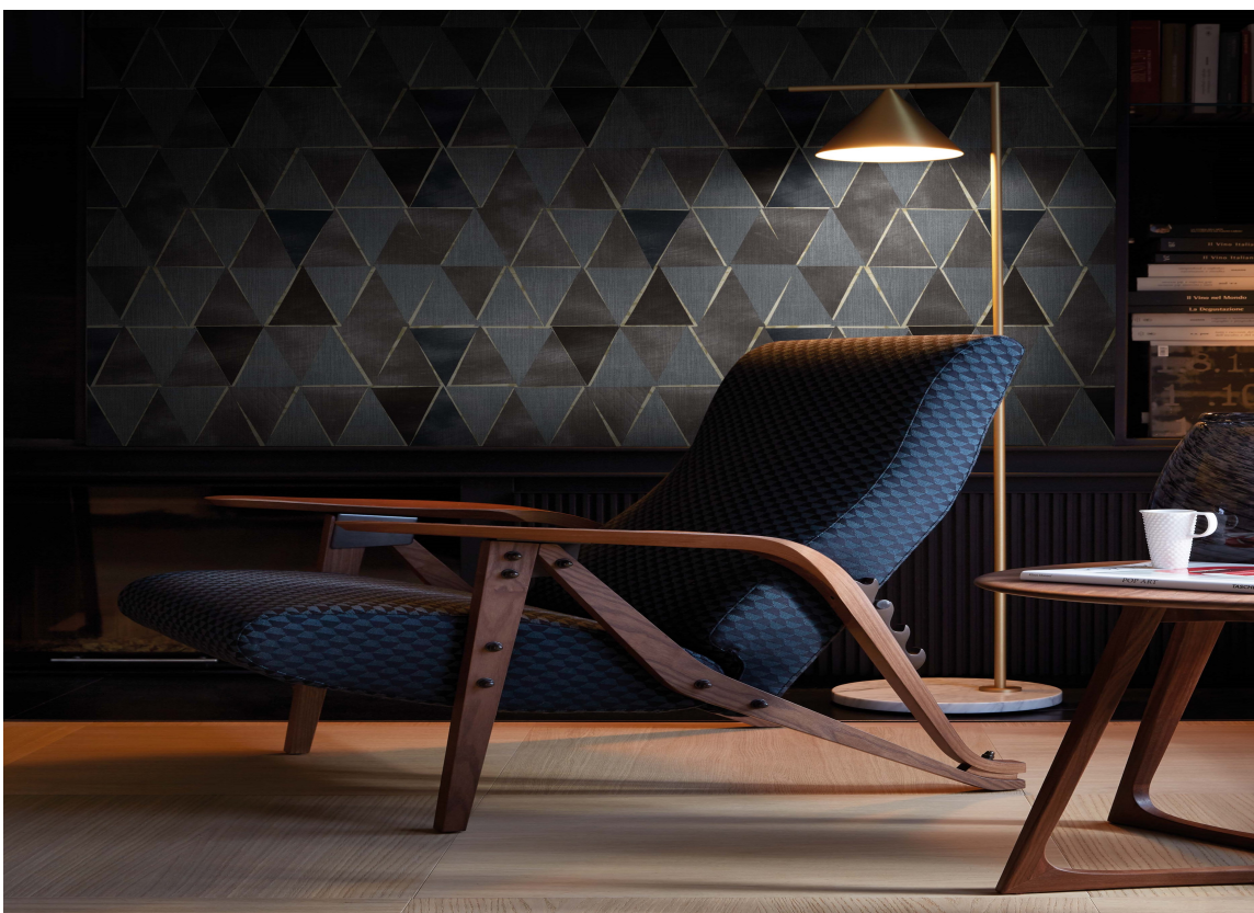
LYS: Godt med leselys er viktig både for å se hva du leser og for å sette stemningen. Her kommer tapetet fra kolleksjonen Solid fra Fantasi Interiør fram i lysglimet.