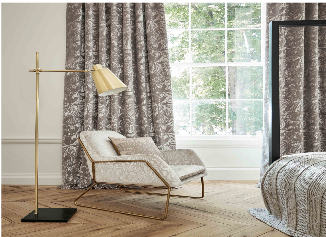
LESEDRØM: Stol trukket i et elegant, deilig tekstil og lange, fôrede gardiner som demper for støyen og mykner opp interiøret – hva mer kan man ønske for en god lesestol? Tekstiler fra Harlequin/Tapethuset.