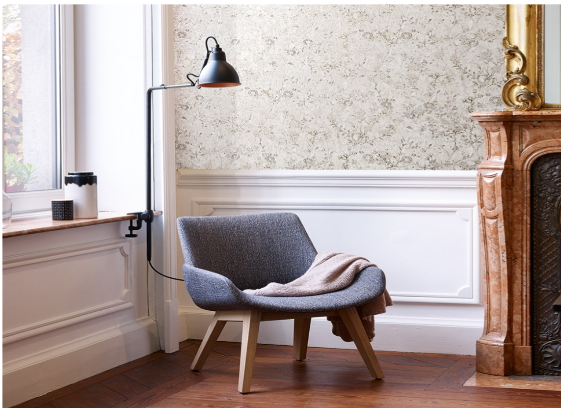
ELEGANT: Et elegant og litt herskkelig interiør kan dempes og gjøres litt mer avslappet med mer moderne, enklere møbler. Tapetet her er fra kolleksjonen Glasshouse fra Borge.