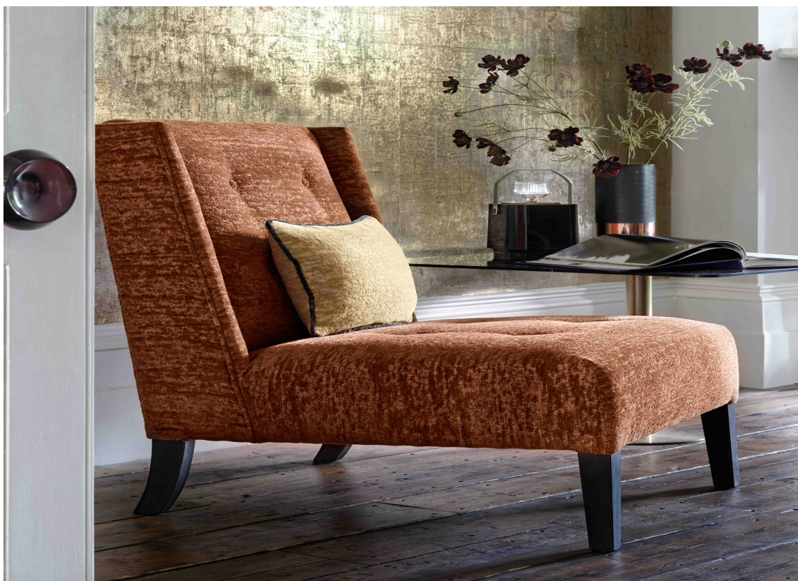
STOLTREKK: Stolen og puten er trukket i chenillestoff fra kolleksjonen Castilla fra Clarke & Clarke/Borge. Mykt og slitesterkt – her kan du sitte mange kvelder på rad.