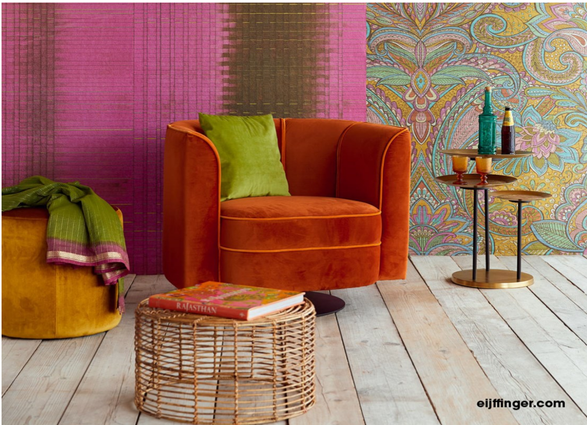
GLADKROK: Spennende fargekombinasjoner preger denne sjarmerende lesestolen. Og den velurklede godstolen inviterer jo til litt kveldskos! Tapeter fra Eijffinger/Storeys.