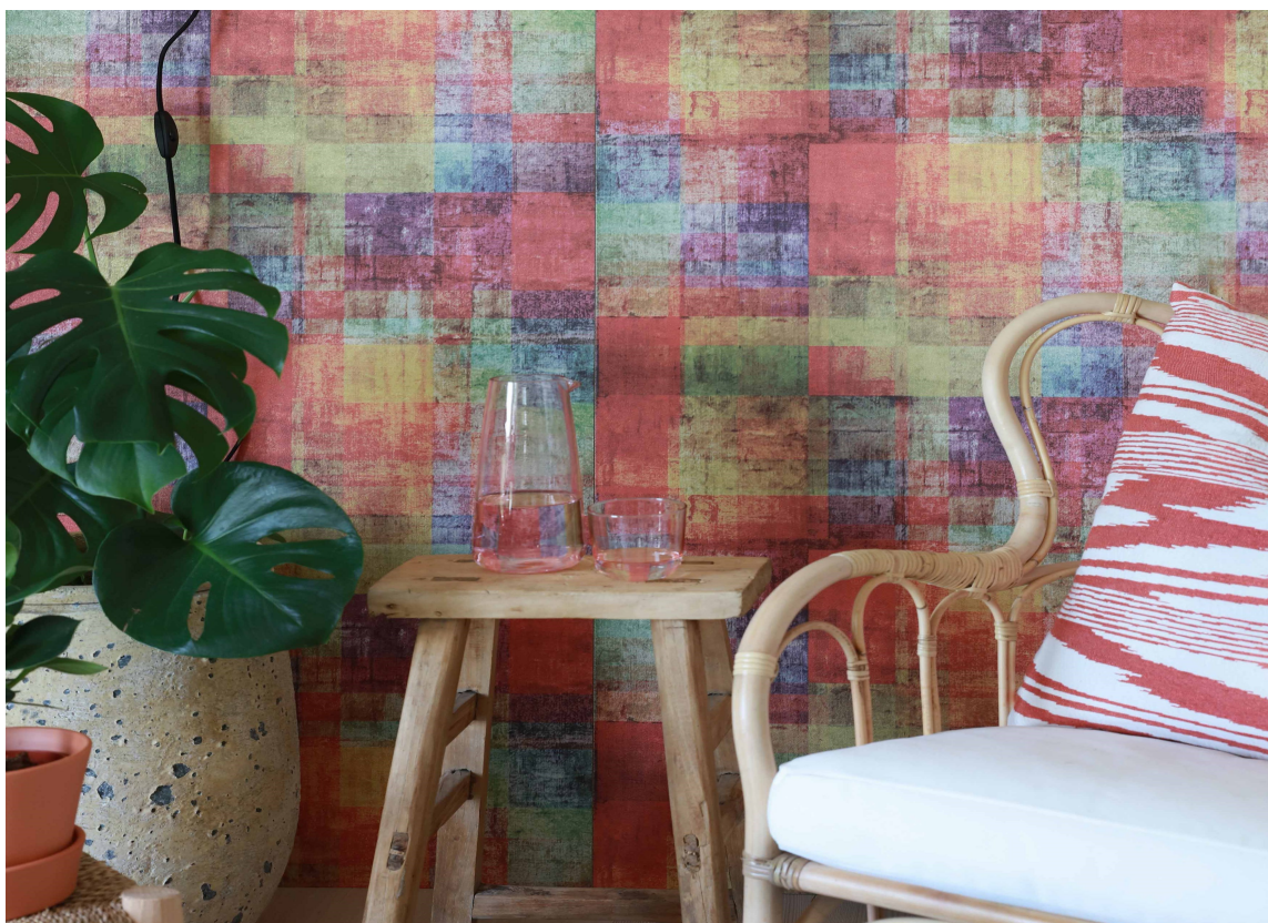
FARGERIKT: Et lekent interiør dempes av lyst tre og grønne planter. Her er det satt opp ferdigtapetserte veggplater, Walls4You fra Forestia, som er en enkel vei til slett, tapetsert vegg.