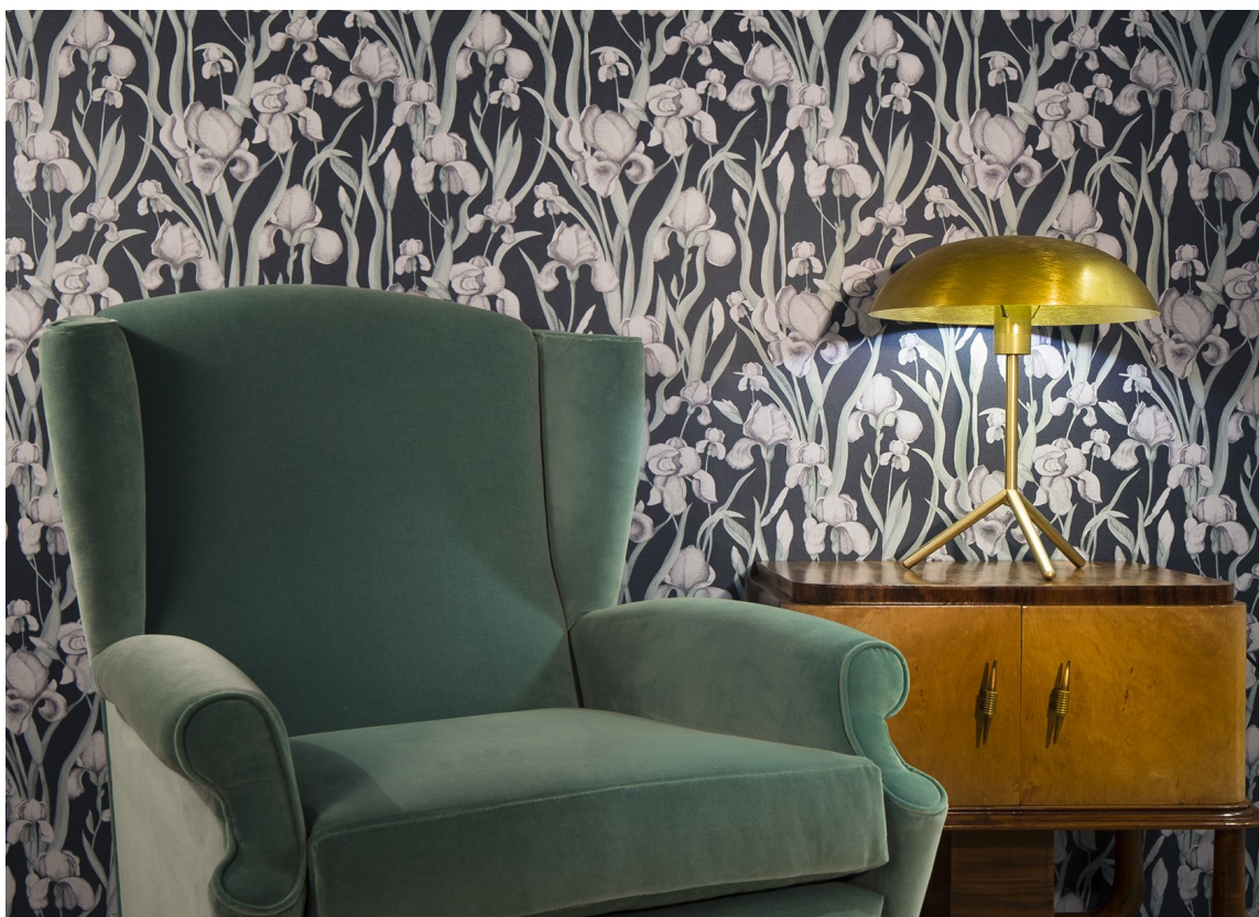
RETRO: Med ørelappstol, en gammel skjenk og et mørkt blomstertapet gir denne kroken oss litt retrovibber. Fibertapet fra kolleksjonen Elisir fra Fantasi Interiør.