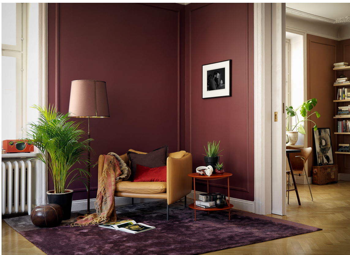
LUNT: Med mørke, matte farger, deilig teppe på gulvet, puter og pledd i stolen og en bok foran deg, er alt lagt til rette for en perfekte kveld. Veggfarge fra Beckers.