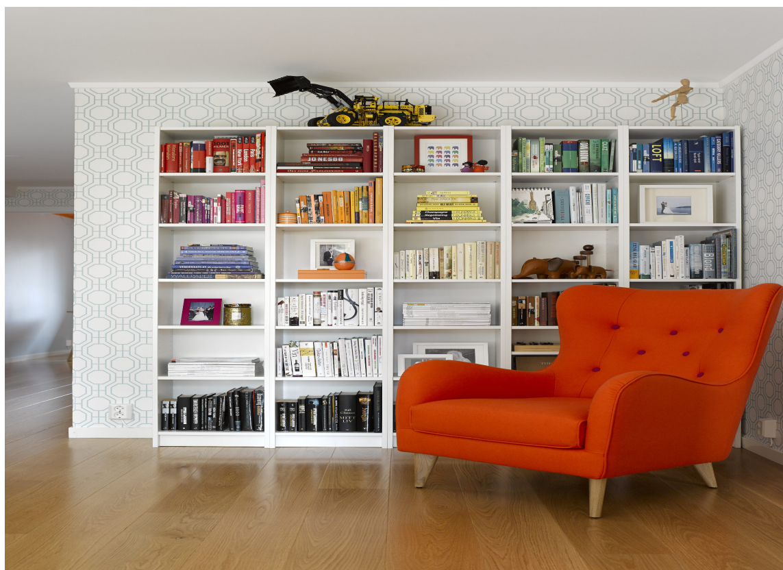
BOKHYLLE: Hva er vel en lesestol uten bokhylle? I dag viser bokhyllene hvem vi er. Tapet fra Storeys.