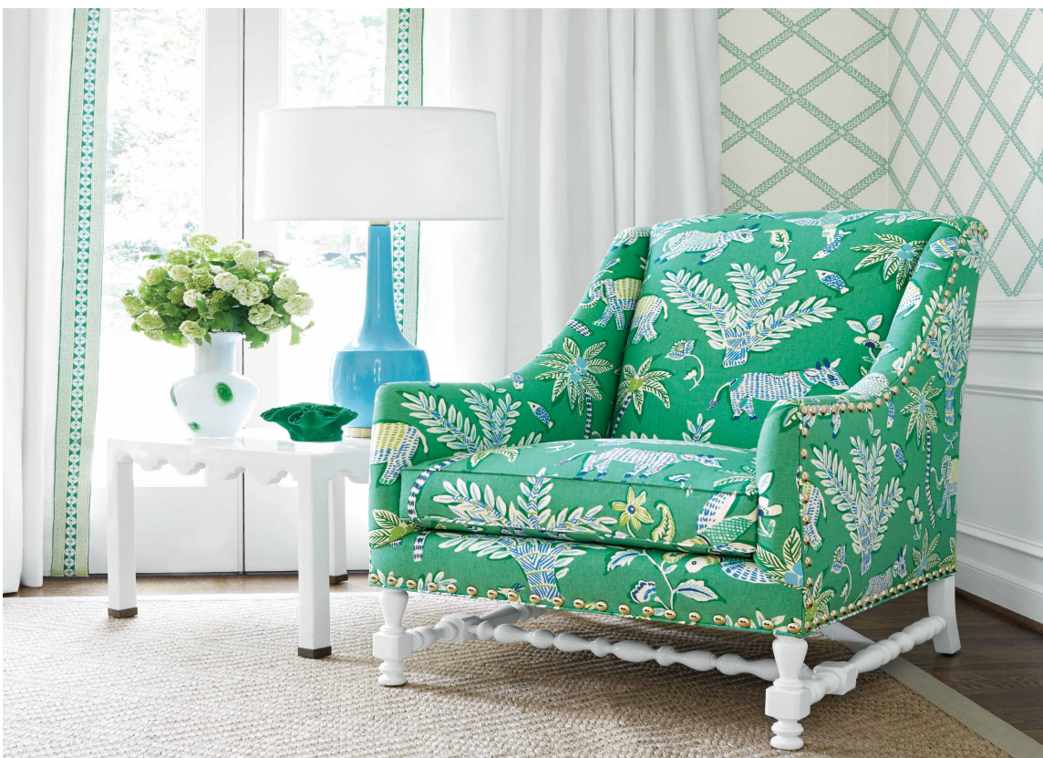
GRØNT: Sommerlig og lett – og en deilig, innbydende stol trukket i et lekkert, mønstret tekstil fra Thibaut/Green Apple. Tapetet er fra samme kolleksjon.