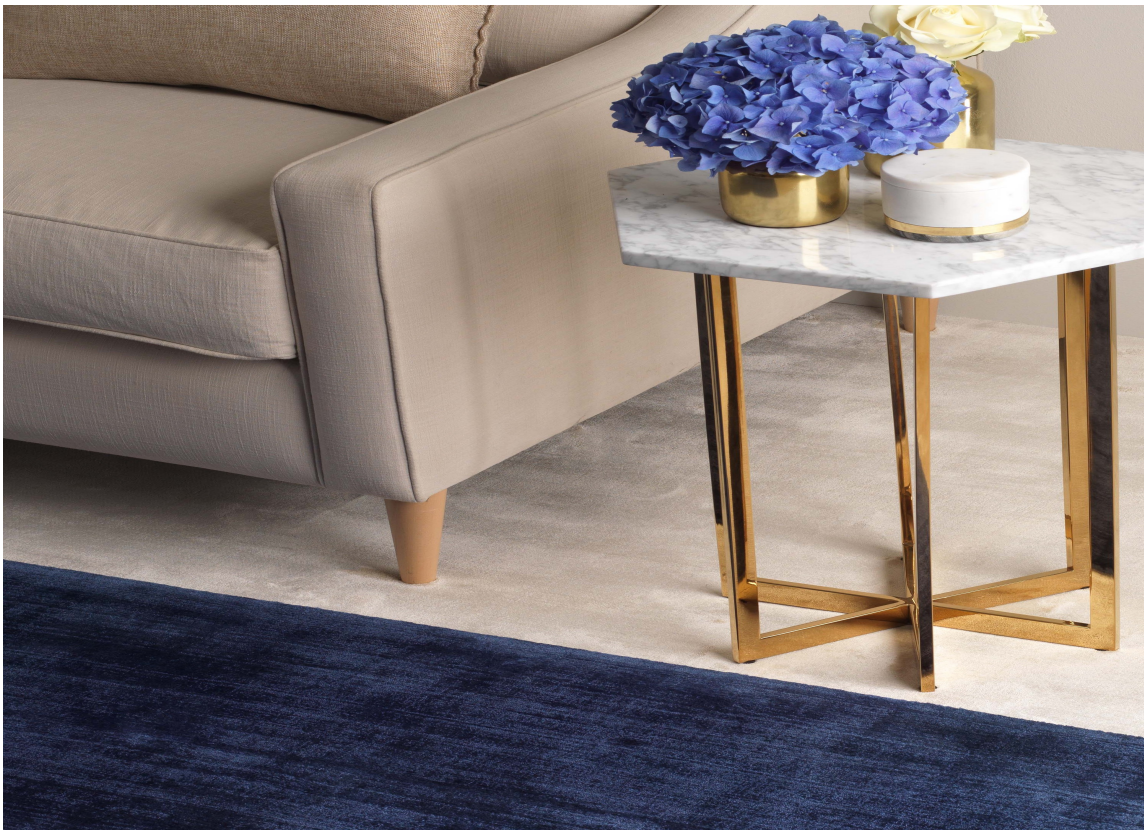
TEPPE PÅ TEPPE: Med tepper i flere lag blir det en drøm å sette føttene ned på gulvet. Tepper fra Jacaranda/Intag.