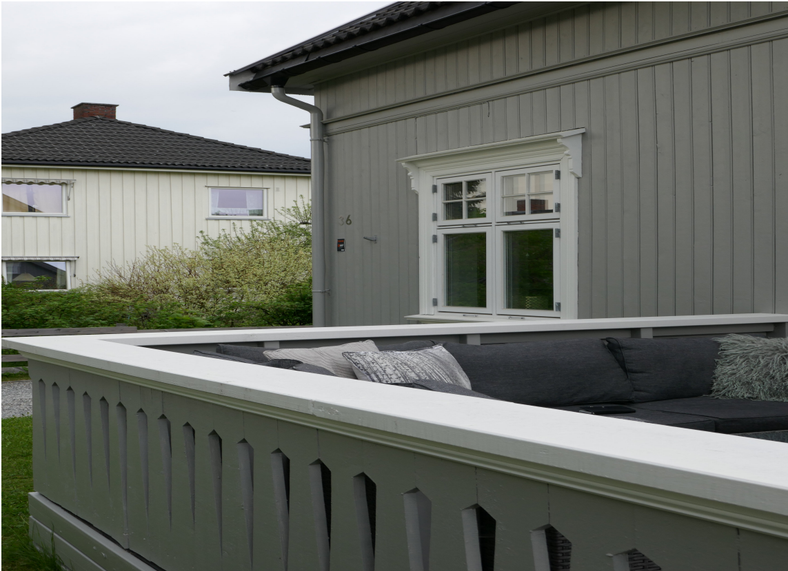
TOPPEN: Overliggeren på rekkverk er spesielt utsatt for vær og vind. Ved å impregneres med Owatrol før du maler, forhindres flassing grunnet fukt.