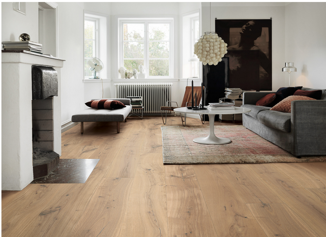
PLANK: Lang og bred plank i eik er blant folkets favoritter på gulvet.