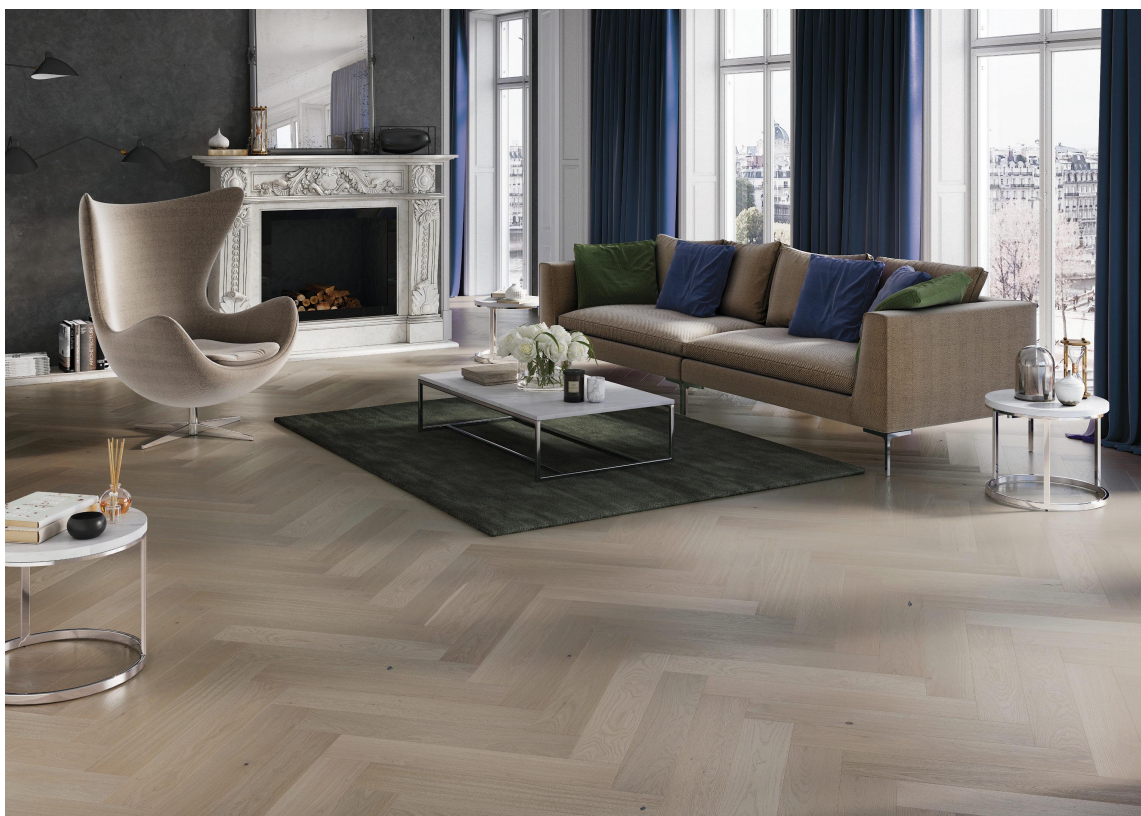
FISKEBEN: Det siste i gulvdesign er at fiskebensmønstrene er tilbake, her på et parkettgulv.