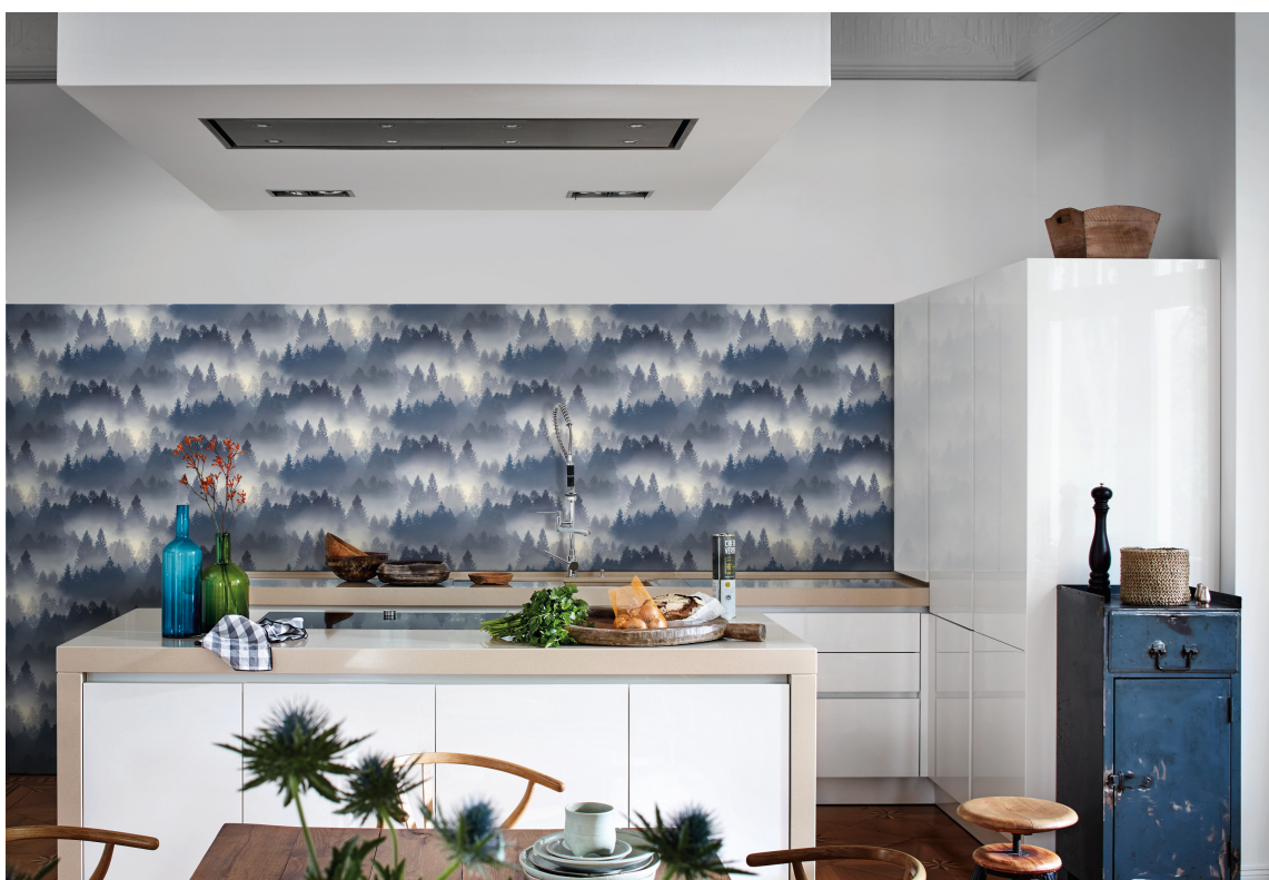
ÅPENT FOR FORANDRING: Tapet gir både farge og karakter til rommet. Går du lei, er det enkelt å tapetsere på ny eller male om.