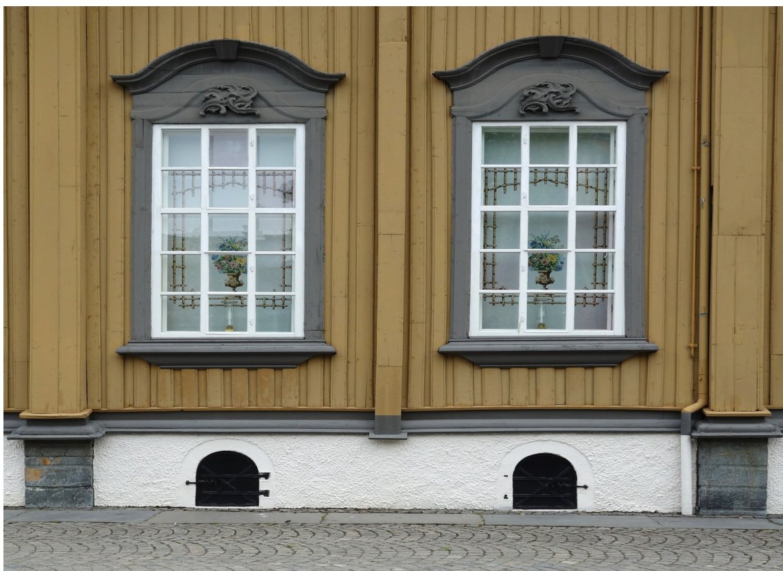
KONGELIG: Stiftsgården er kongens residens i Trondheim, et staselig trehus inspirert av europeiske slott og herregårder fra 1700-tallet.