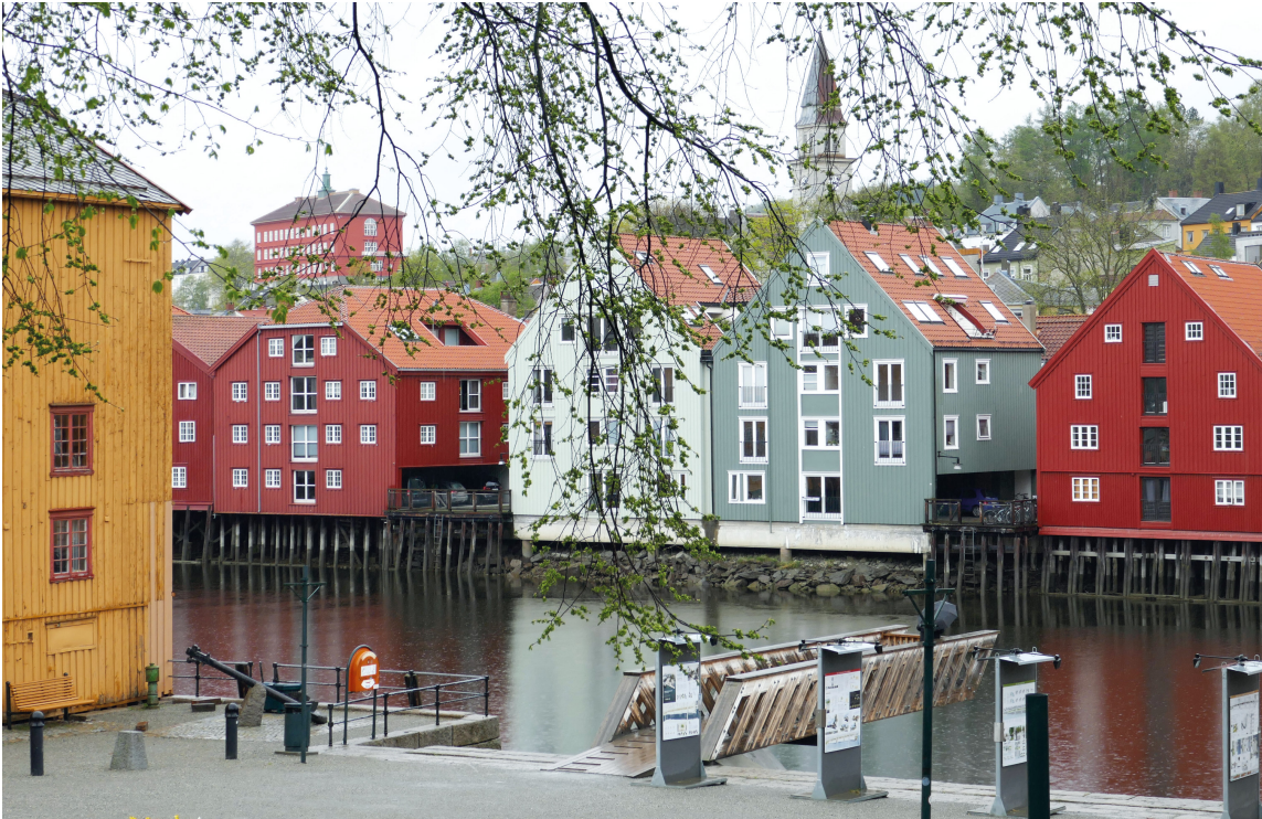
KONGENS ALLMENNING i Kjøpmannsgata og Nidelva. I bakgrunnen av bryggene skimtes Bispehaugen skole.