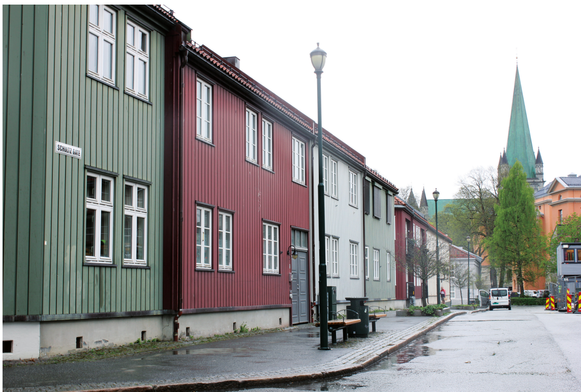
HARMONI: Variasjon mellom røde, grønne, hvite og okergule farger i St. Jørgensveita. I bakgrunnen troner Nidarosdomen.