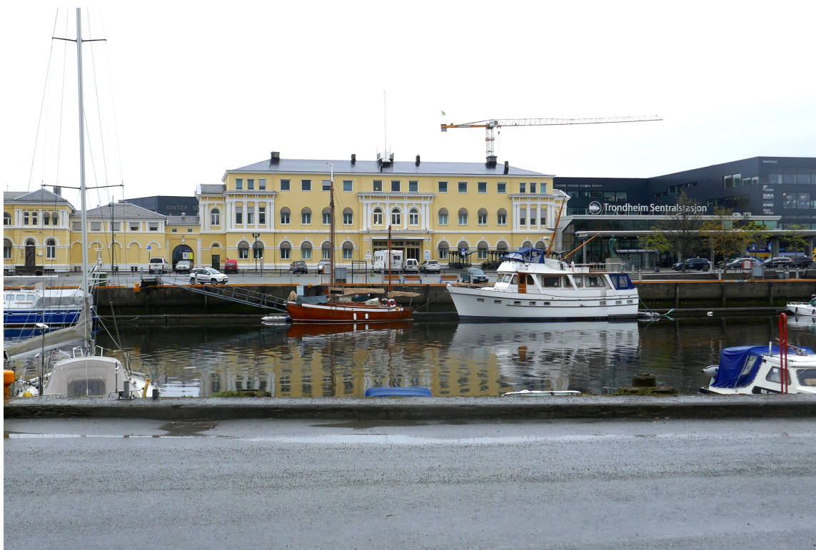
TRONDHEIM SENTRALSTASJON sett fra bysiden. Den eldste delen fra 1883 ble tegnet av Balthazar Lange, og er i dag omkranset av sorte bygninger.