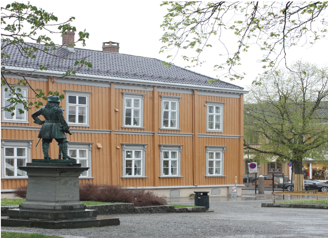
SPESIELT: De store trepaleene, som Hornemansgården, er typiske for den trønderske trearkitekturen.