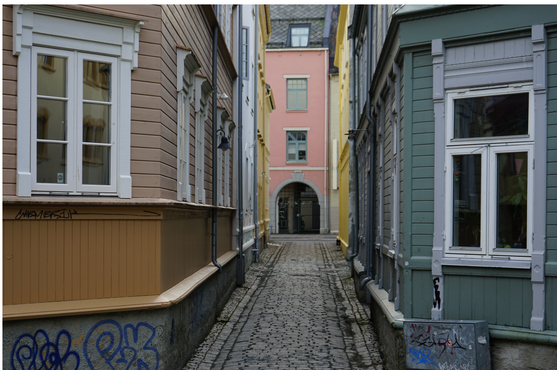
BRATTØRVEITA: Fargenes variasjon hjelper på orienteringen og opplevd romlighet i de trange veitene i Nerbyen, og gir en særegen atmosfære typisk for gamle Trondheim.

– Vi må bare pøse på med opplysning. Etter hvert vil folk lære seg å kokkelerer godt med omgivelsene. De vil se hva slags krydder som mangler og alle finne sin egen smak, sier hun.