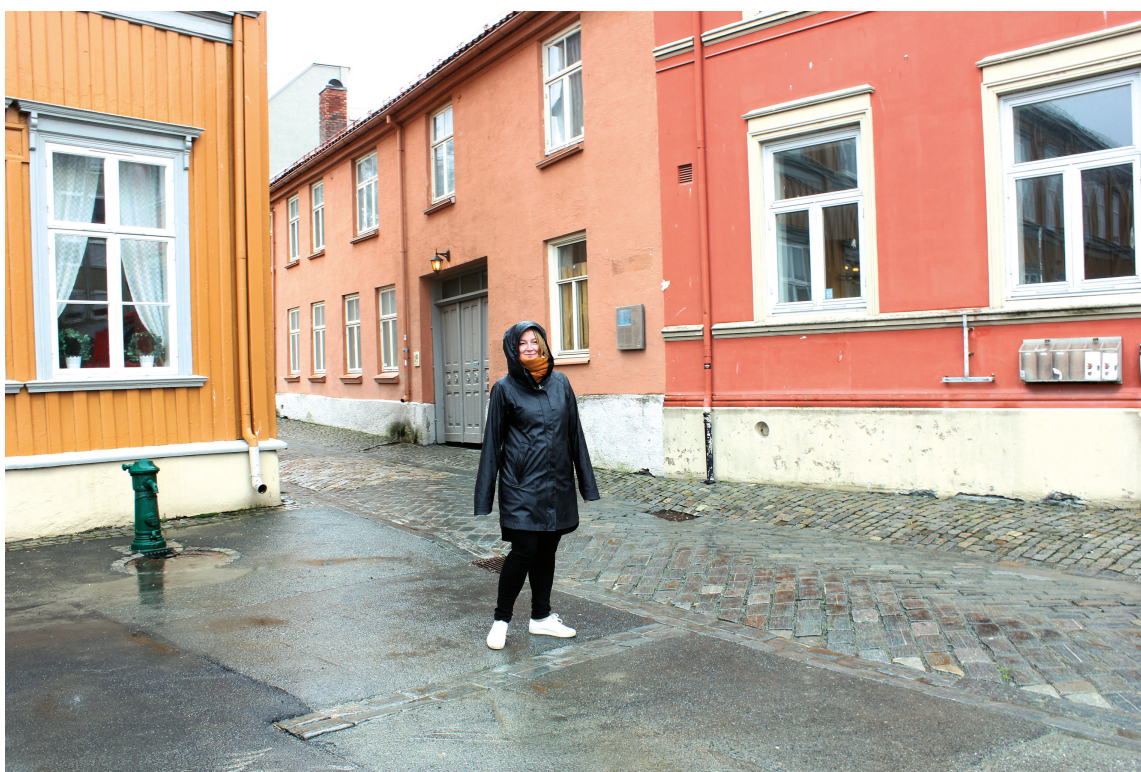
TYPISKE FARGER: Kine ved hjørnet Hornemansgården og Presidentveita med stedstypiske nyanser av fargene mellom Y30R og Y80R, som er mest representert i bybildet.