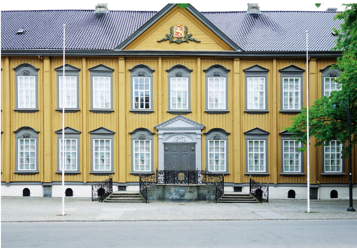
STIFTSGÅRDEN: Fargene på de store trehusene er relativt fargersterke og mørke.