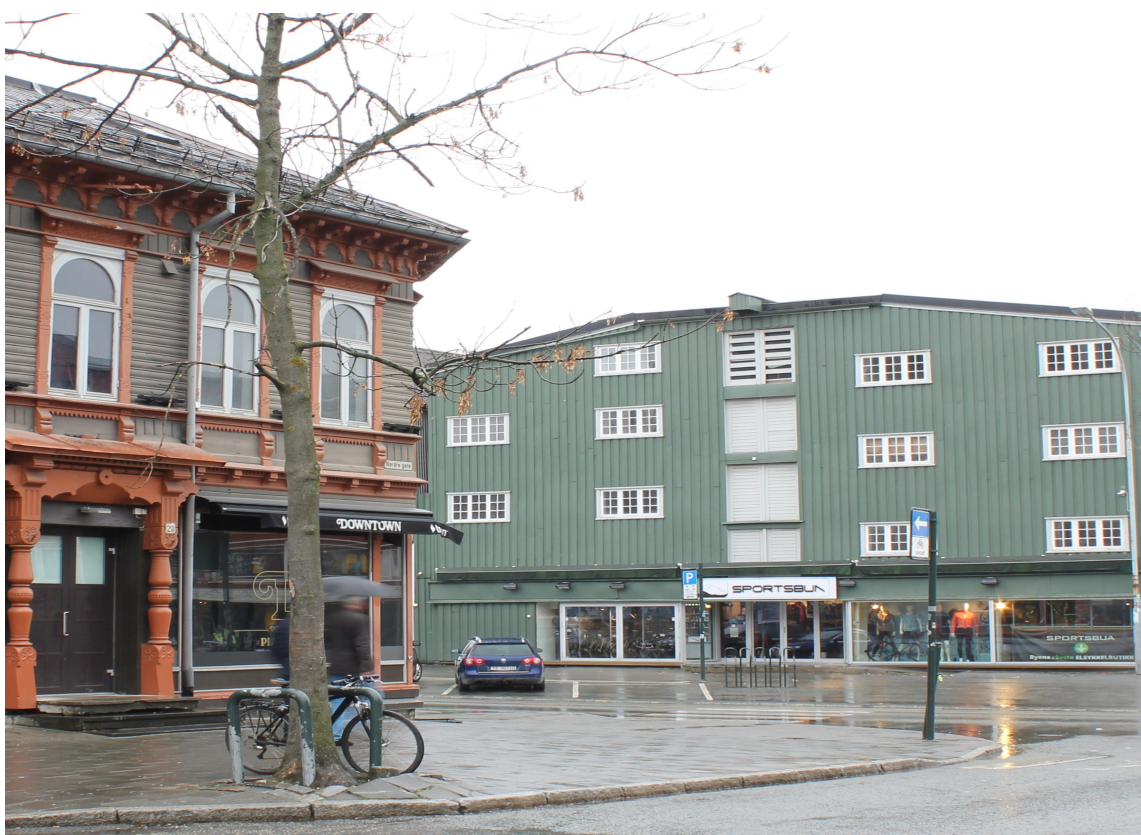
BRYGGE I FJORDGATA: Grønn kledning og hvite vinduer og porter avviker fra regelen om at store bygningsvolum bør være noe lysere og ha lavere kulørthet.

– Dette er en del av vårt naturlandskap. Folk kommer til Trondheim og opplever bryggene, formene, fargene og materialene. Og det er ikke bare en gate, eller en gammel bydel som skal være Trondheim. Det ville blitt for sårbart. Det er nok også grunnen til at kommunen støtter arbeidet med fargeveilederen.