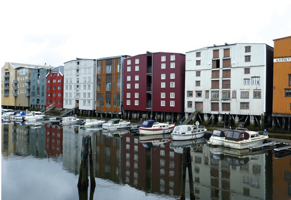
BLANDET: Nye og gamle brygger ved kanalen mellom Midtbyen og Brattøra.