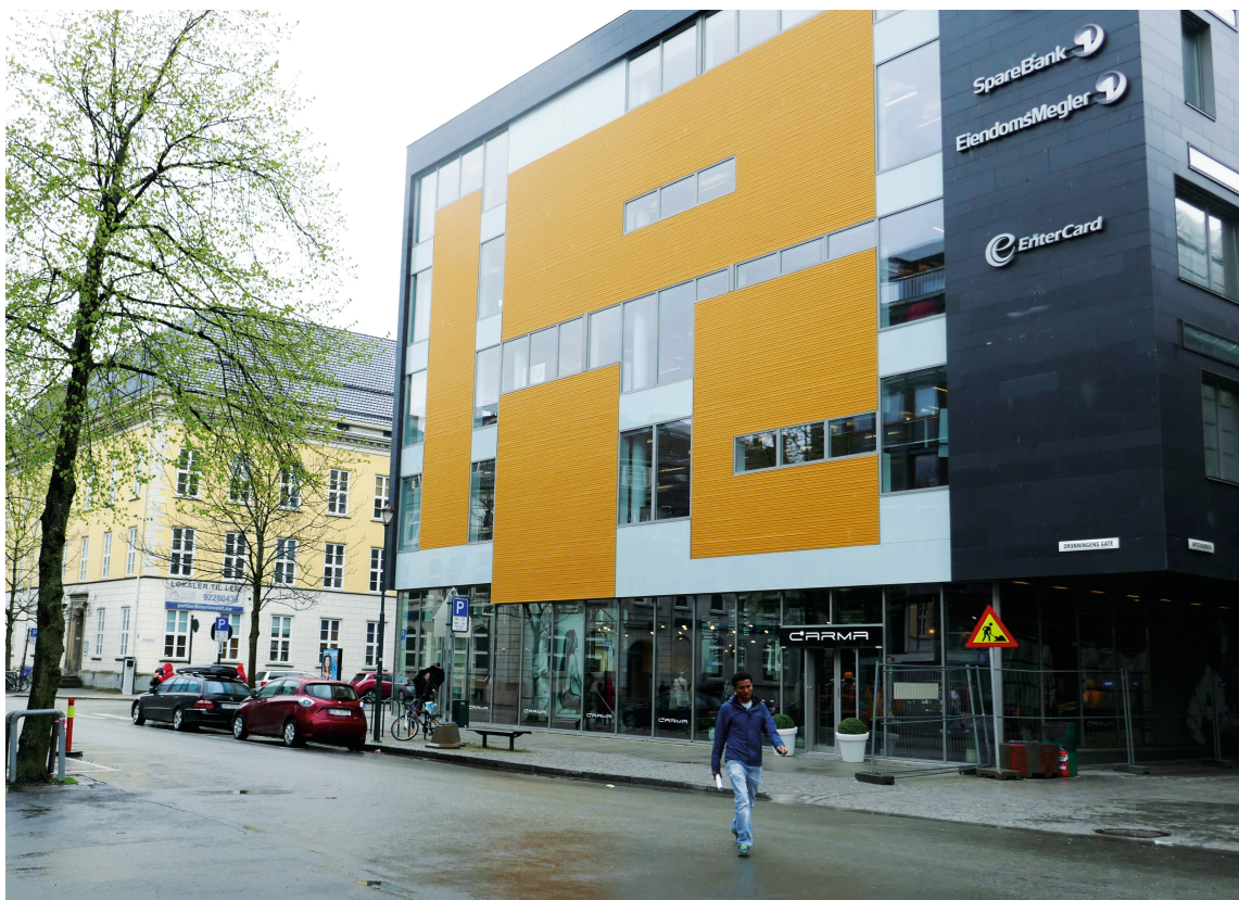
TRONDHEIMSPALETTEN: Kan gi arkitekter og byutviklere hjelp til å unngå farger som avviker fra det stedstypiske.