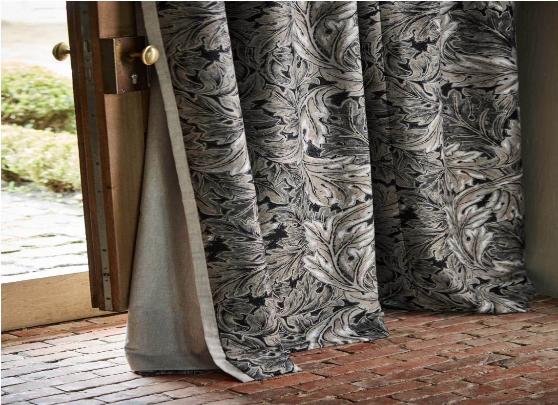
GARDINER: Lange, myke gardiner er et «must» i et lunt interiør. Her er gardiner fra Morris/Intag.