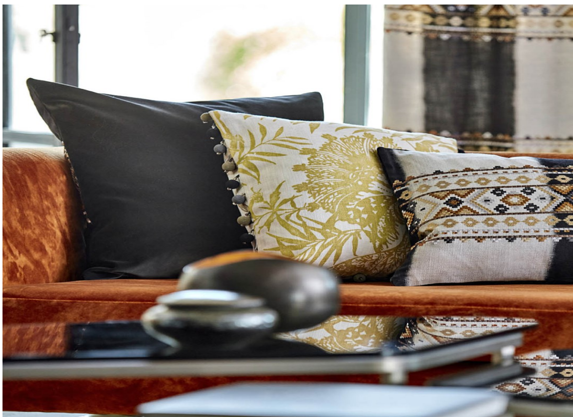
PUTER: Myke puter er både deilig og fint å se på. Disse tekstilene er fra Harlequin/Tapethuset.