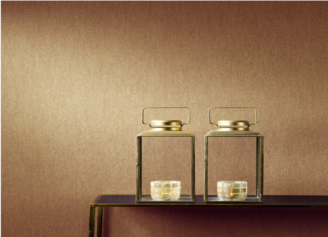
TAPET: Du kommer langt med tapet med tekstur på veggene. Her fra Green Apple.