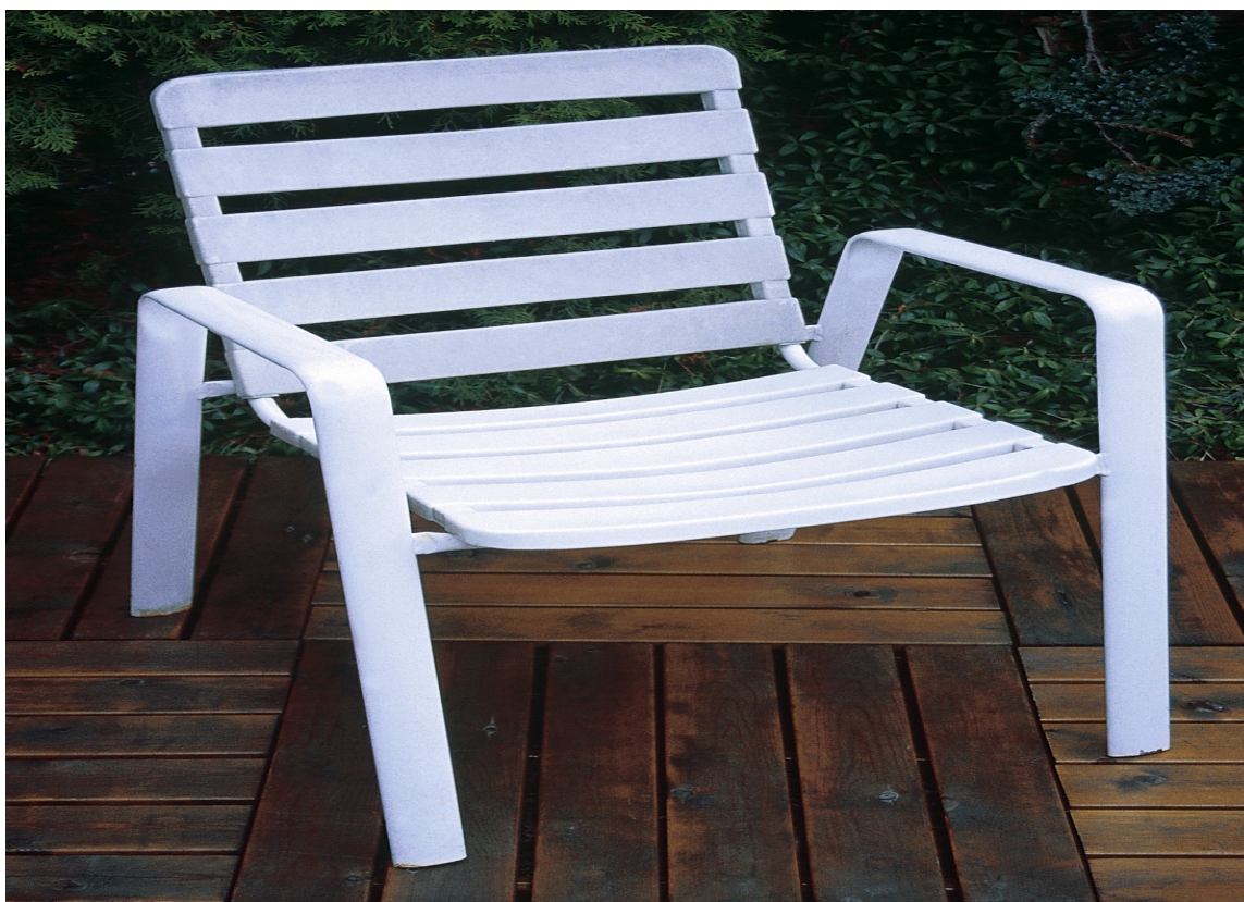
GOD SOM NY: En gammel og skitten plaststol kan få nytt liv etter en runde med «Plastforny»-setter fra Alanor.