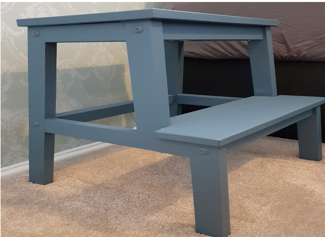
FIKS-FERDIG: Den trehvite krakken har fått nye farge og er klar for å «jobbe» som nattbord, stige og stol på soverommet.