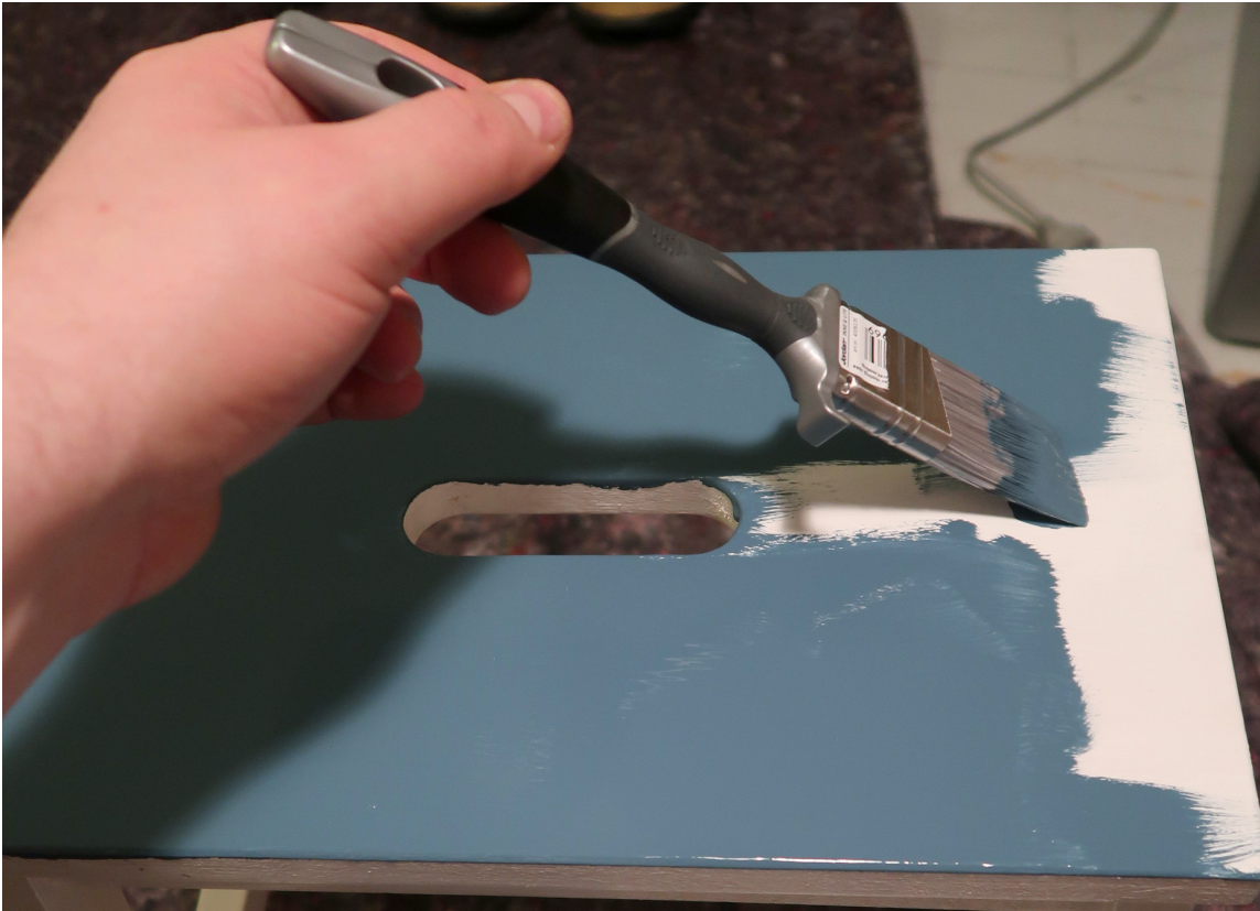
ROBUST OVERFLATE: Krakken skal brukes mye. Derfor har vi valgt å male med gulvmaling. To strøk med farge holder.