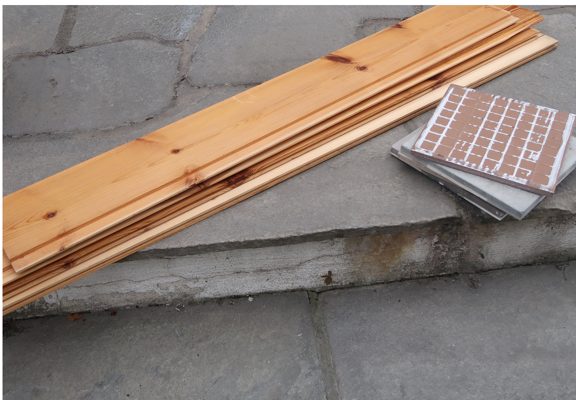
GJENBRUK: Planker og fliser skal ikke i pose, men leveres for seg. Eller brukes... lage en hylle kanskje?