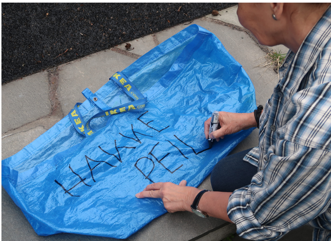
USIKKER: Lag en bag for ulike typer avfall, og en egen for det du er usikker på.