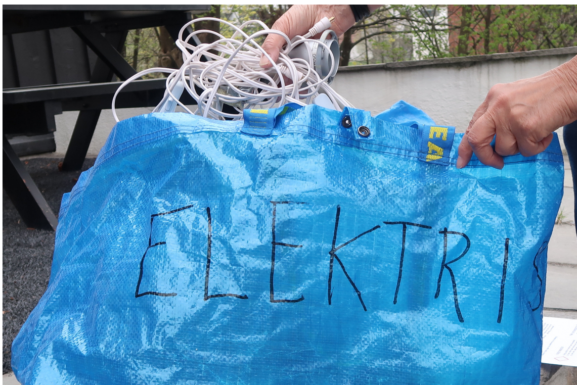
UNDERVEIS: Smart å sortere underveis.