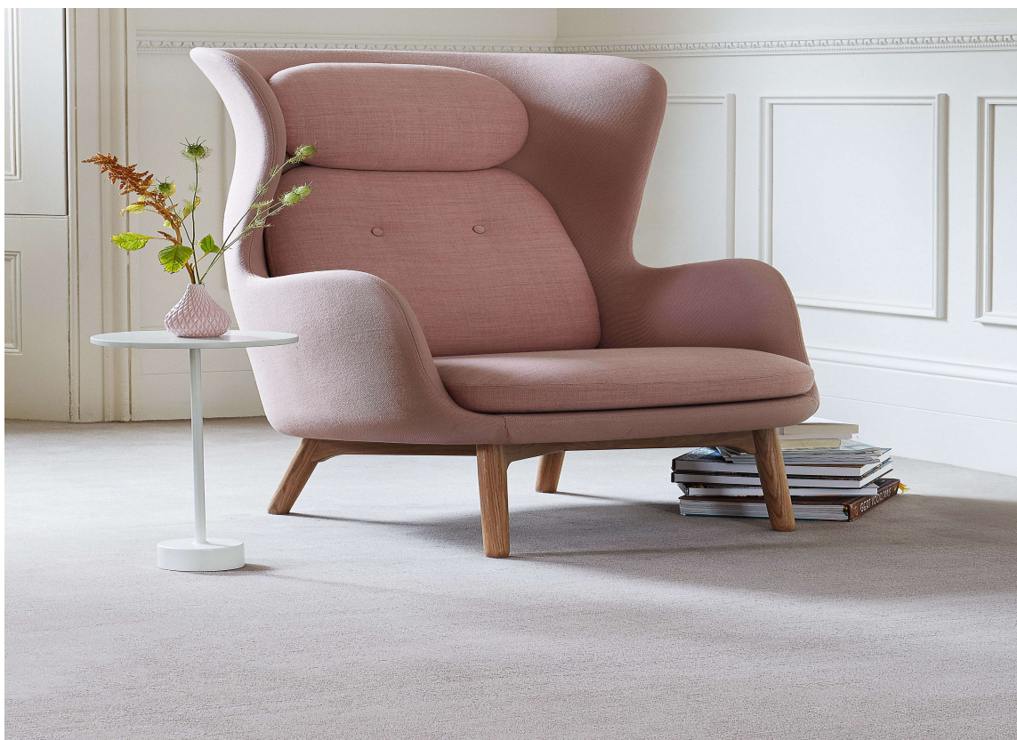
FERDIG: Når teppet er lagt, kan godstolen settes på plass igjen.