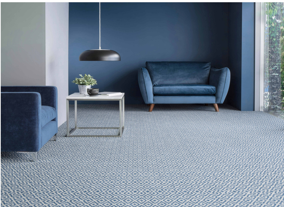
MØNSTER: Jobb med alle materialene samtidig for å få fin helhet.