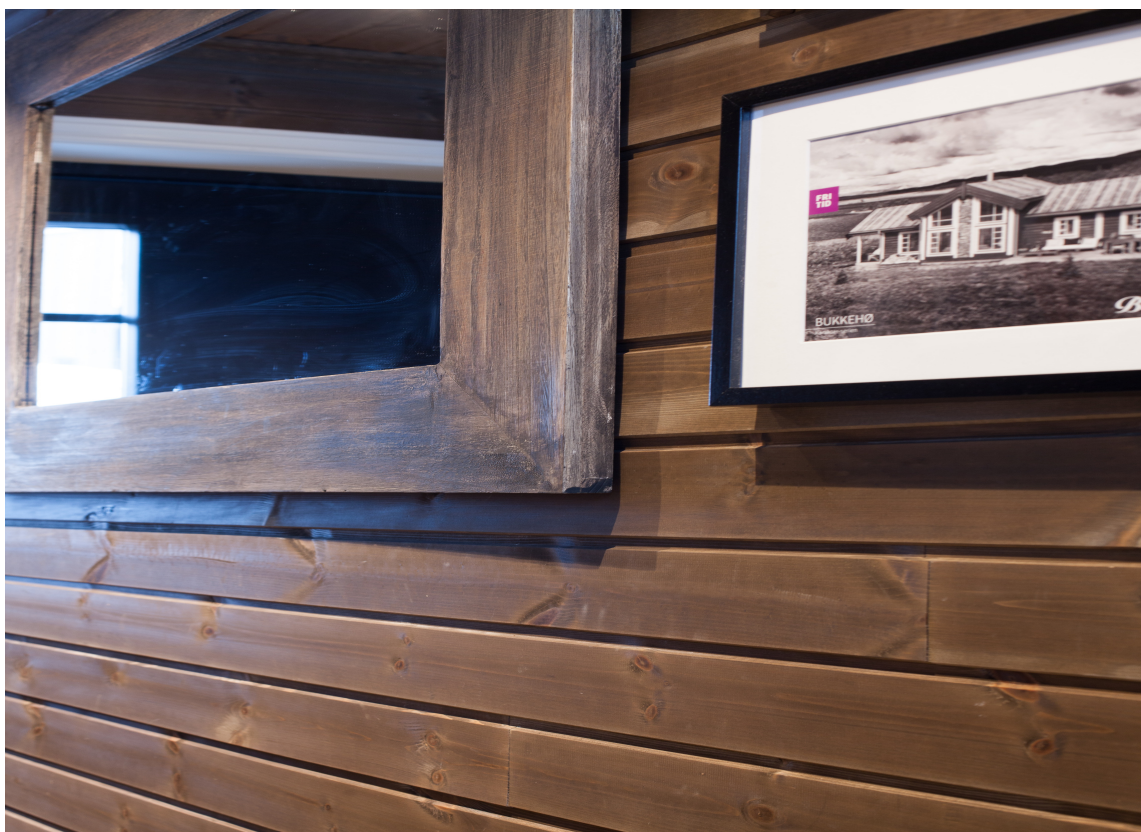
TREDRØM: Brunbeiset trepanel gir en lun atmosfære, som vi nordmenn er særlig svake for.