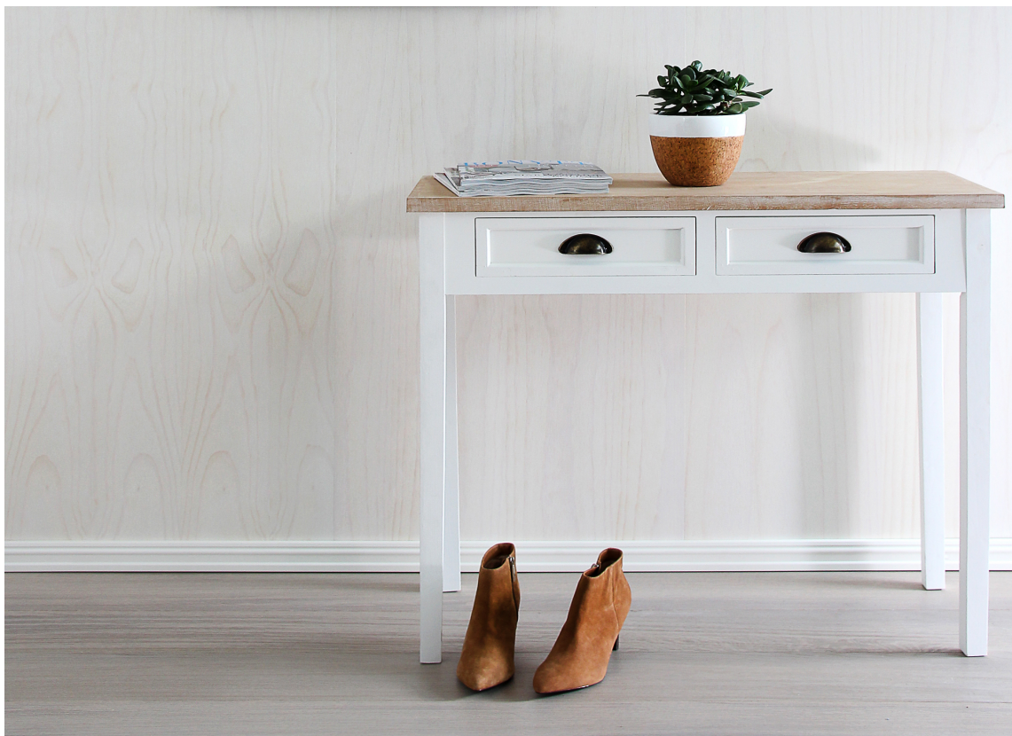
MODERNE: Veggplater i MDF med furufinér i toppsjiktet gir et moderne preg og viser treets naturlige struktur.