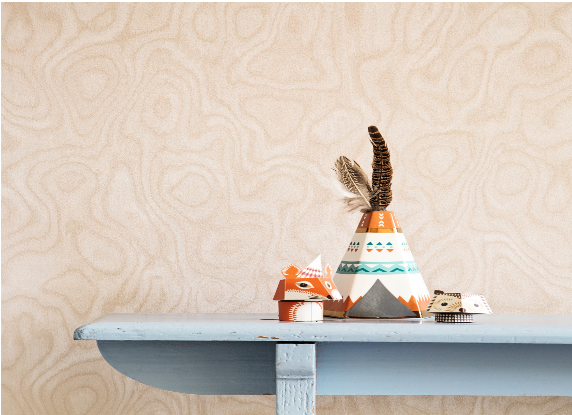
TAPET: Det finnes mange tapeter som kan imitere treverk, enten du ønsker plank, panel eller årringer på veggen. Denne er fra kolleksjonen Essential Elements fra Borge.