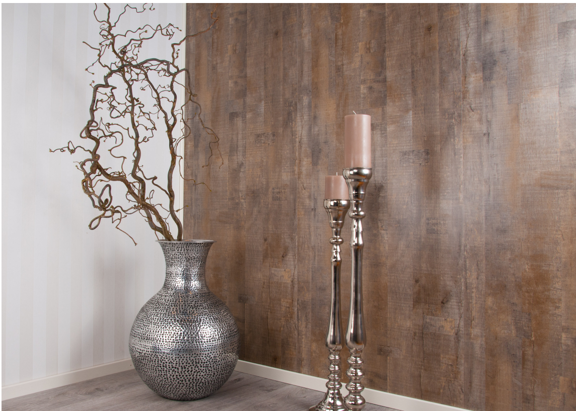
KOPI: Ferdigtapetserte veggplater med tapet som imiterer eikestrukturen gir raskt og enkelt en helt ny «look» i gangen.