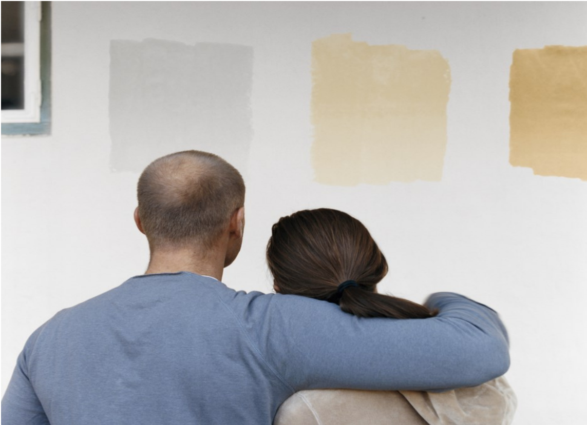
OPPSTRØKSPRØVER: Test alltid fargen på veggen før du kjøper inn litervis med maling.