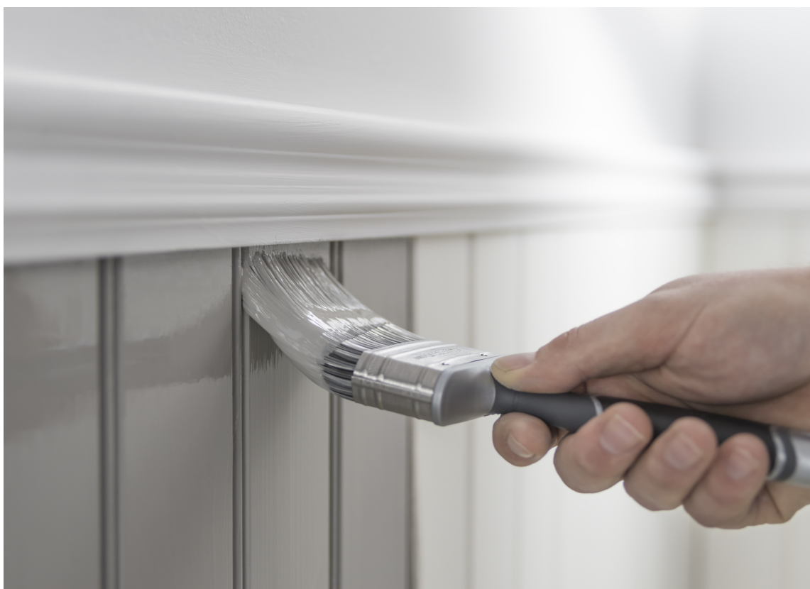
VERKTØY: En pensel er ikke en pensel. Kvalitetsverktøy hjelper deg godt på vei til et pent og holdbart resultat.