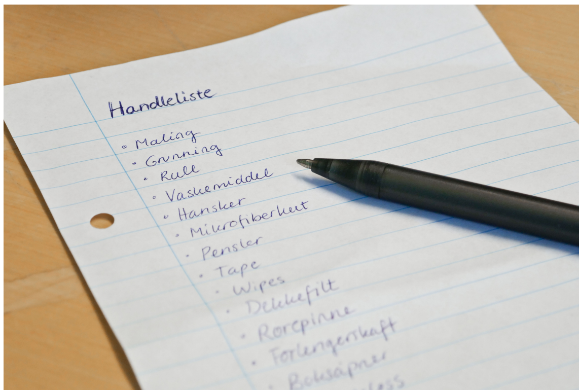
HANDLELISTE: Skal du starte på ditt første oppussingsprosjekt, er det en del grunnleggende utstyr du trenger til malejobben.