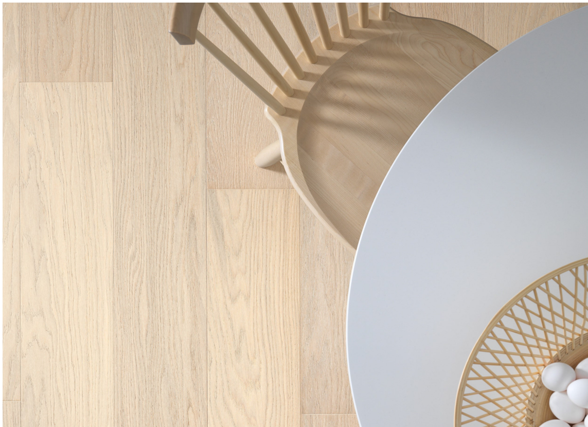
OFF-WHITE: En nyhet i vår er Viva 1-stavsplank fra Tarkett, som er farget off-white.

Det lyse, trehvite gulvet er selve varemerket på den lyse, nordiske stilen. Når innredningen for øvrig er hvit med mye glatte og blanke flater, er et lyst tregulv som et stort møbel som fører liv og variasjon inn i interiøret.