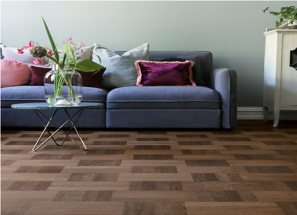
RUTER: Parkett i rutemønster er en gammel klassiker, og noe av det siste i gulvmote. Dette gulvet er fra Tarkett.

LES OGSÅ: Gammel tradisjon trendy på gulvet