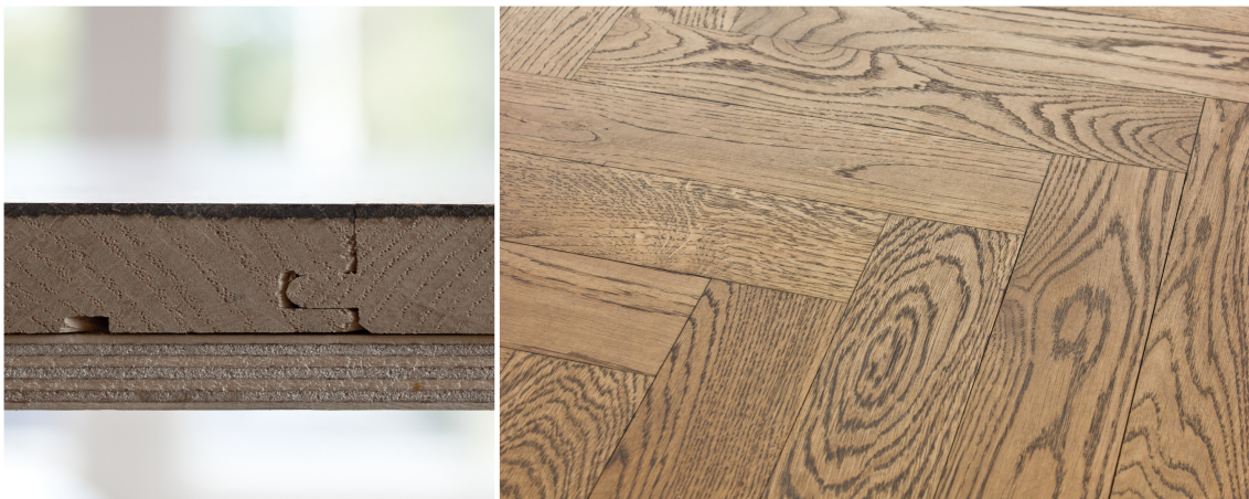
MASSIVT: Dette er hel ved, det varer i generasjoner, kan slipes og farges på nytt og på nytt. Eik lagt i fiskebein fra Element Studio.