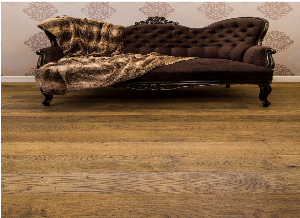
EIK CHATEAU: Gulv med patina skaper en helt spesiell stil og atmosfære. Dette eikegulvet er fra Element Studio.

Noe du også må ta stilling til i jakten på gulver ditt er hvor fin eller rustikk overflaten skal være. Her er det store variasjoner fra de helt silkemyke og fine flatene, til grove og rustikke gulv med riper og hakk, eller med en flott patina der det ser ut som de kommer rett fra et gammelt hus.