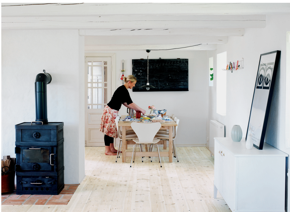
HARDVOKS: Med hardvoksolje får du en noe mer robust overflate enn olje. Her hvitvokset furuparkett fra Arena/Alfort.