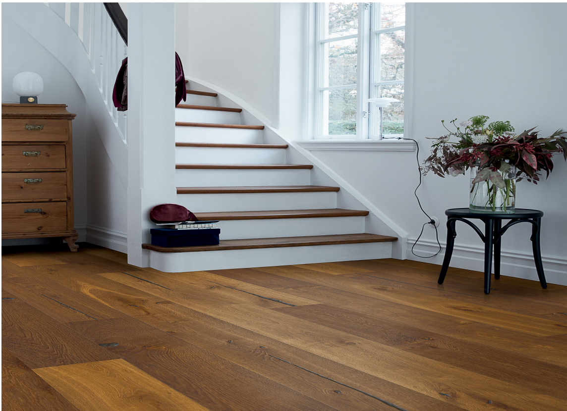
TREND: Interessen for mørkere gulv er økende, og med det tilbudet. Dette varmbrune eikegulvet er fra Pergo.