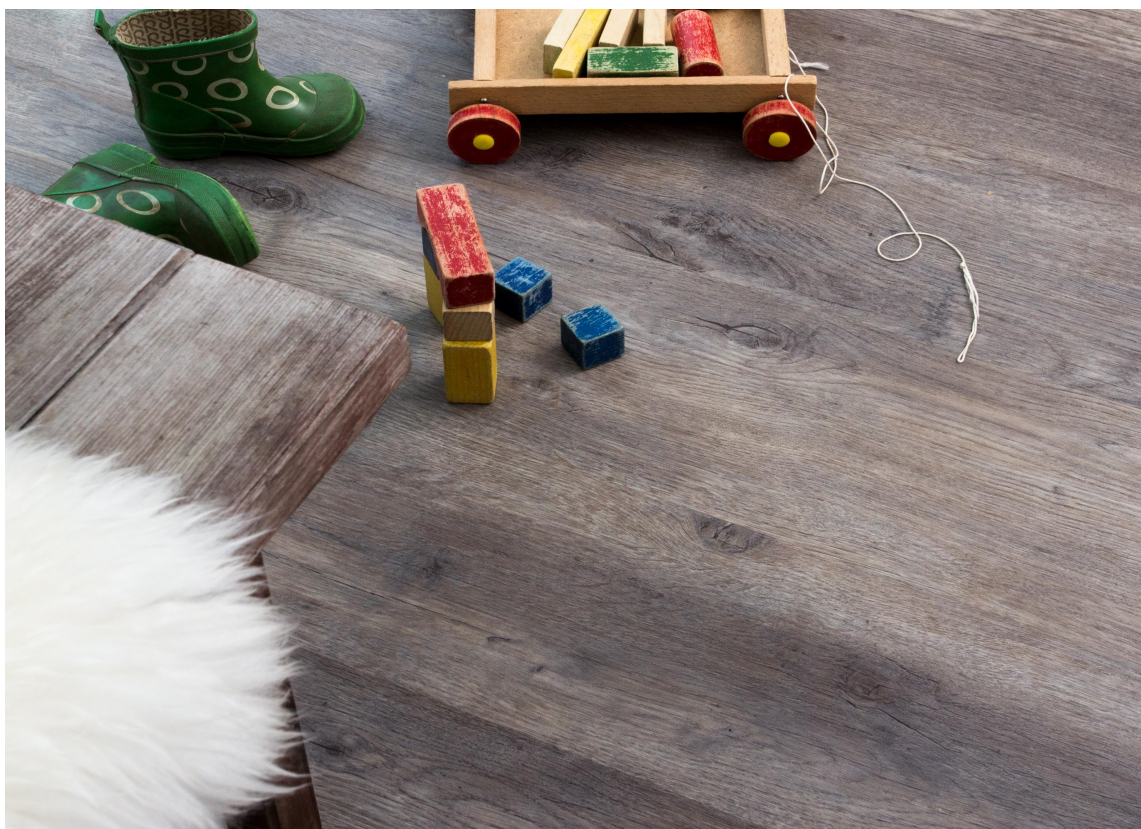
LAKKERT: Parkett med lakkert overflate er enkel å holde ren og trenger lite vedlikehold. Maxwear fra Golvabia.