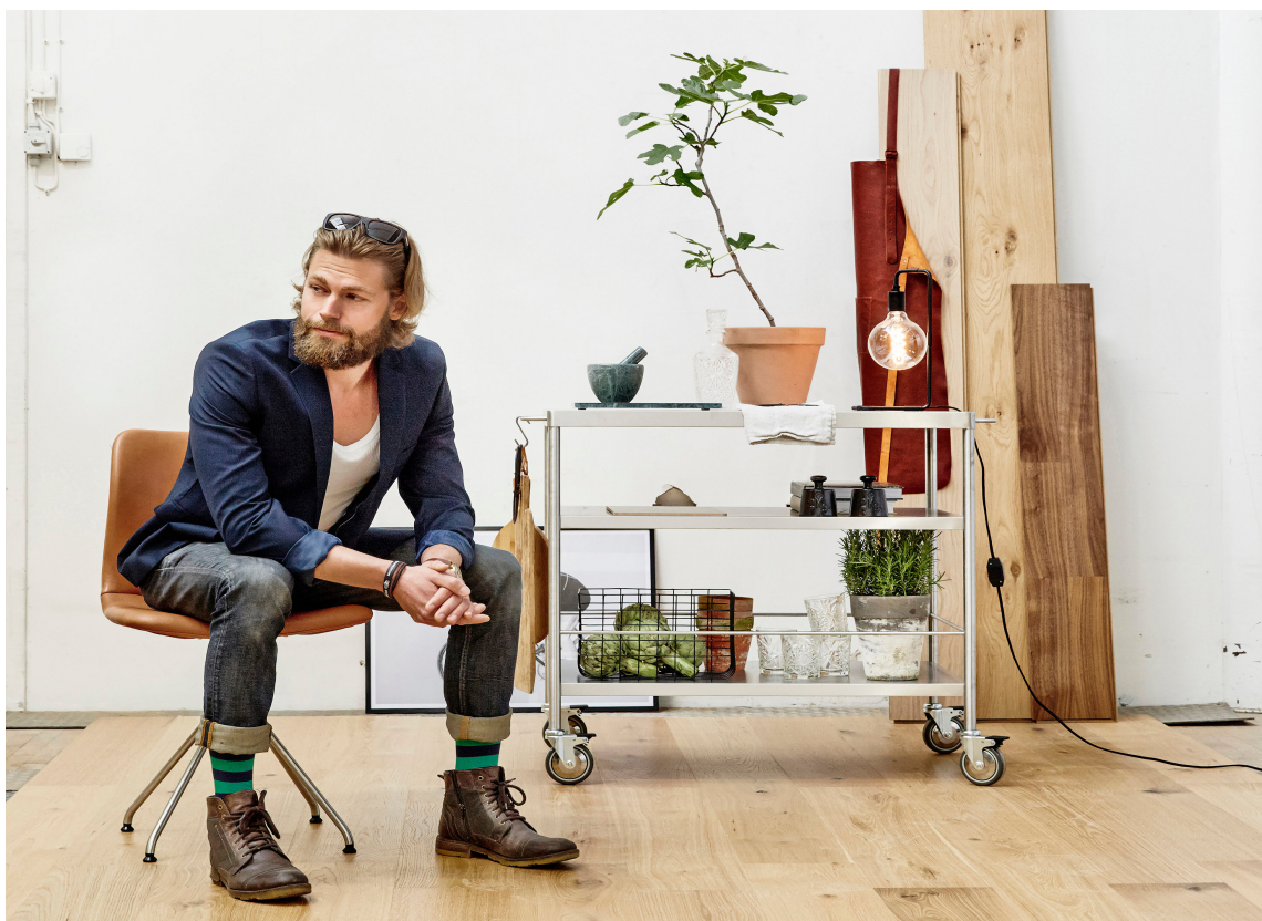
LYST: Hvor lyst vil du ha det? Det er mange nyanser som må vurderes. Dette er fra Golvabia.