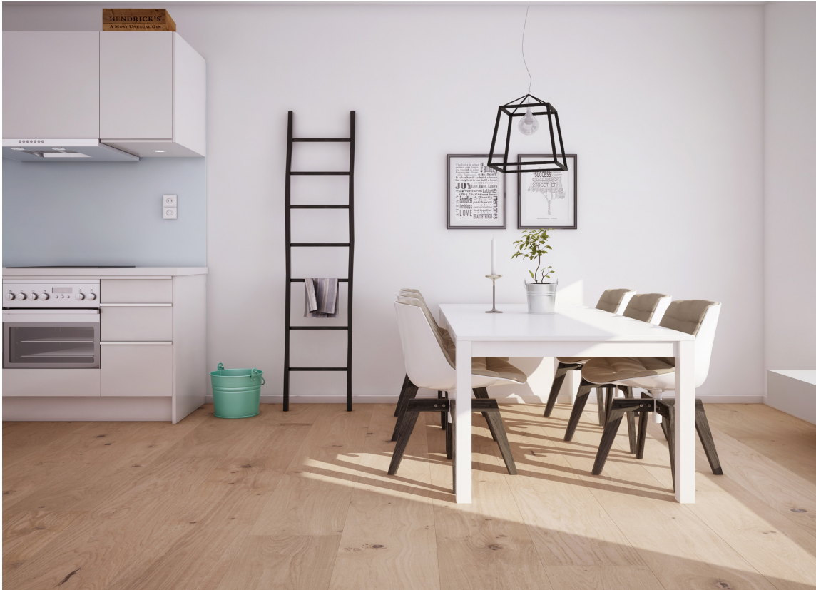
HVIT EIK: Parkett i eik finnes i stort utvalg. Arena XL lamellplank fra Alfort fås med flere typer overflatebehandling og farger.