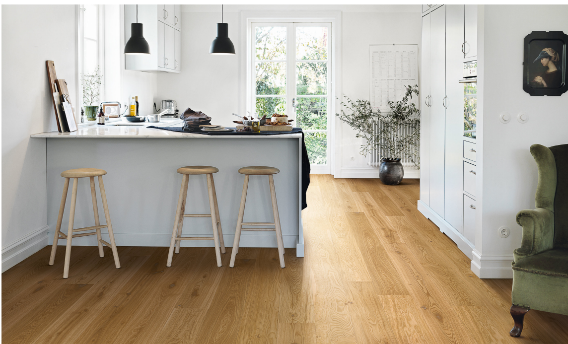
STYRKE: Parkett på kjøkkenet går fint, bare pass på at du velger en kvalitet som tåler litt ekstra, som her med Lofoten fra Pergo.