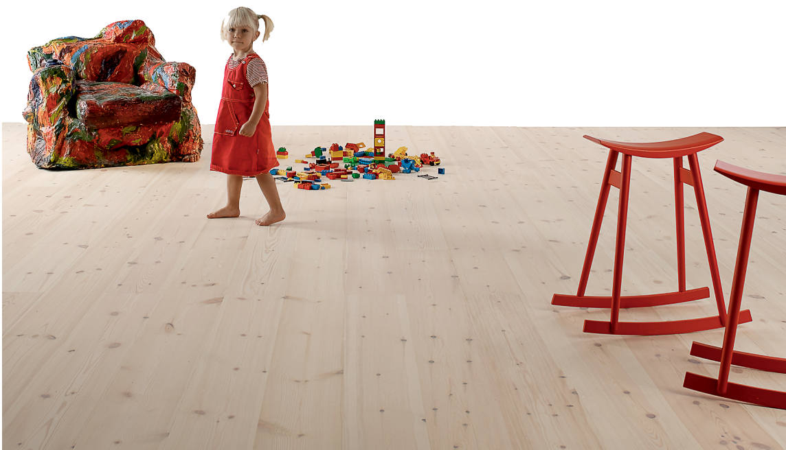
FURU: Furu med et helt naturlig utseende er det mest nordiske av alle. Dette er Rappgo-gulv fra Element Studio.