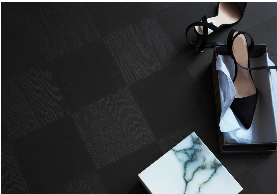
SORT: Denne sorte ruteparketten slår an en elegant og sofistisert tone. Den er fra Tarkett.