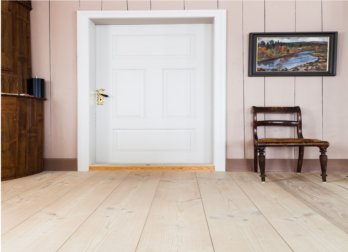
GENERASJONER: Når gulvet skal vare i mange generasjoner, er heltre det naturlige valget.

LES OGSÅ: Gulv for alle sanser og mange generasjoner