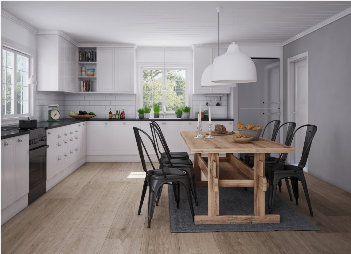
SLOTTSPANK: Farge, tremønster og tekstur skaper gulvets unike uttrykk. Her Arena Slottsplank fra Alfort.