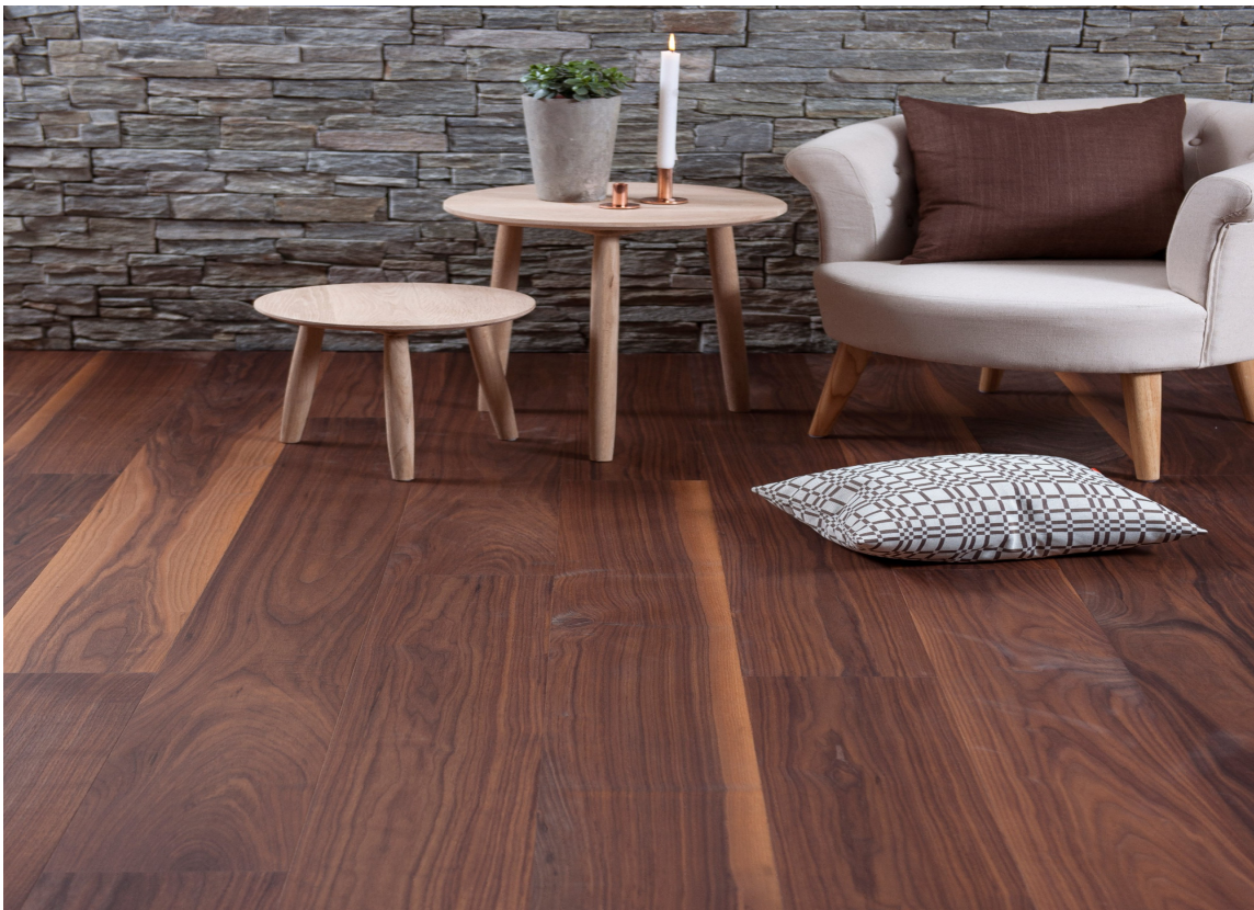
VALNØTT: er et mørkt treslag med livlig mønster, og er blant de mer eksklusive tregulvene. Dette er fra Element Studio.