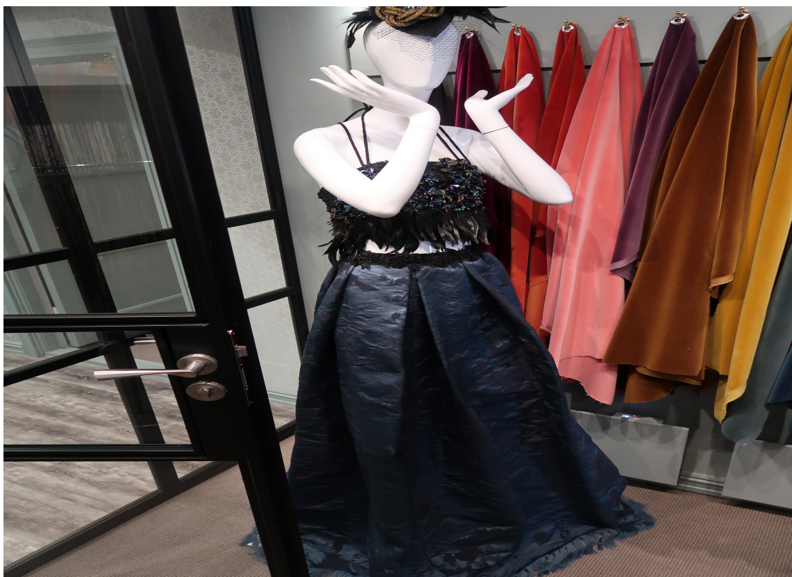
KROPPSNÆRT: Klesdesignere har også fått øynene opp for det elegante tekstilet fra Italia.