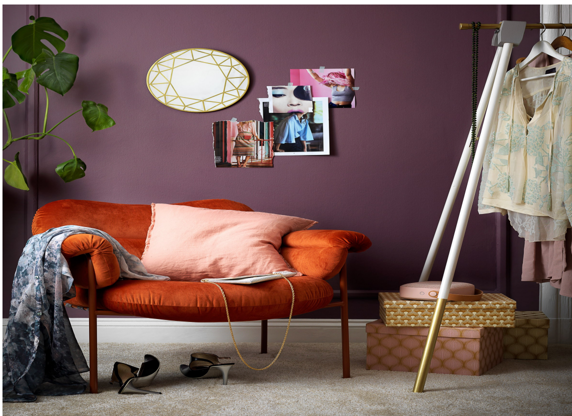
LUKSUS: Med mørke, matte farger på veggene, stilige fargekombinasjoner og et mykt teppe på gulvet, er veien til luksus kort.