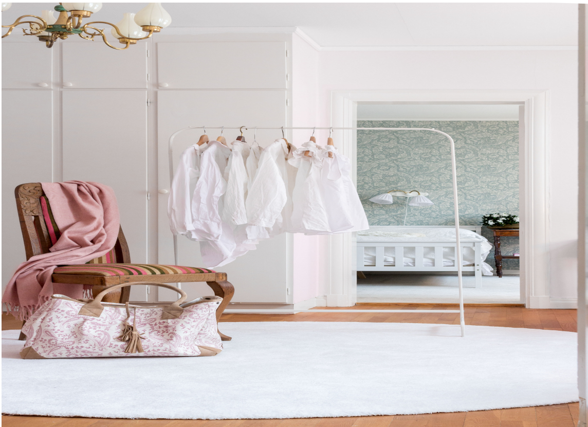
DRØM: Det er dessverre ikke alle som har så stor plass til sin egen garderobe, men det går jo an å drømme. Teppe fra kolleksjonen Casino fra Golvabia.