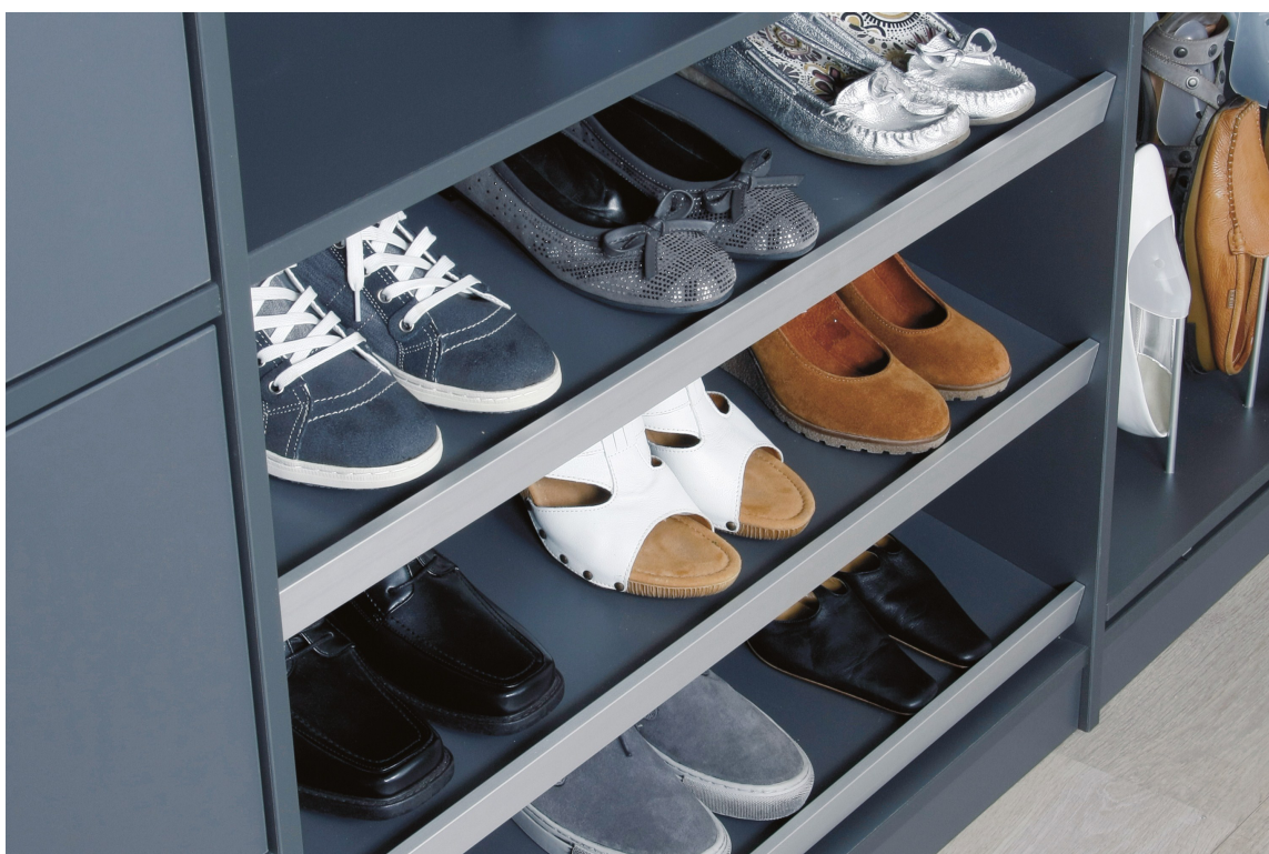
SKOPLASS: Smarte oppbevaringssystem gjør at du kan holde det ryddig i garderoben. Hver ting får sin plass. Integreert skohyller er både elegant og praktisk.