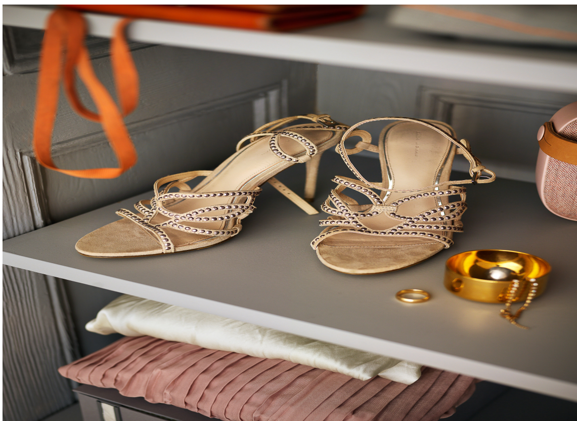
ELEGANT: Et par pene sko fungerer som pynt i gråmalte hyller. Har du treinnredning i din garderobe, kan du male hyllene for et flott uttrykk.