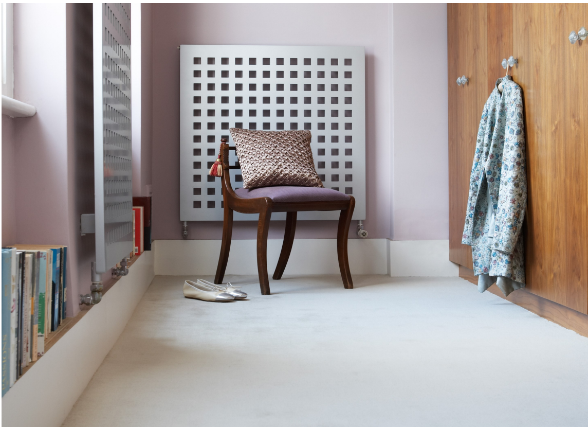
MYKT: Med teppe på gulvet, blir allting godt.