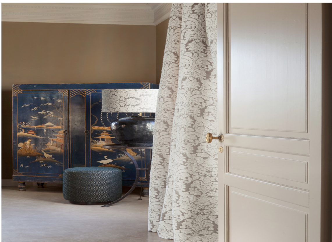
TEKSTILER: Luksus og lunhet går hånd i hånd med tekstiler. Bruk tekstiler både til pynt men også praktisk, for eksempel som romskiller eller i stedet for dør inn til garderoberommet.