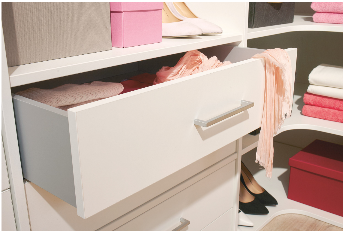
HOLD ORDEN: Smarte garderobeløsninger hjelper deg å holde orden i sakene.

Et walk-in closet skal ikke bare være pent. Det skal først og fremst være praktisk. Det er viktig med et skikkelig oppbevaringssystem, slik at garderoben blir ryddig og enkel å orientere seg i. I dag finnes utallige ulike kombinasjonsmuligheter, slik at du kan skreddersy din garderobe og tilpasse oppbevaringssystemet til ditt rom. Bygg din egen løsning – enten frittstående eller veggfast.