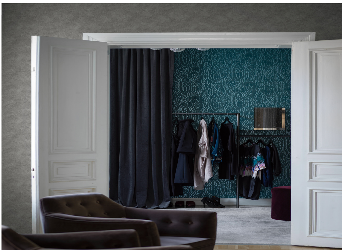
KOM INN: Er du av de heldige som har et eget garderobesrom og doble dører fra soverommet? Da kan du realisere drømmen om et walk-in closet. Her er det tapet fra Borge.