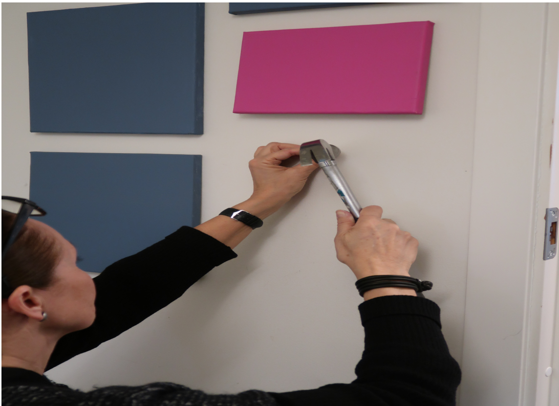
SPIKER: Når malingen er tørr, kan fargeprøvene henges på veggen.