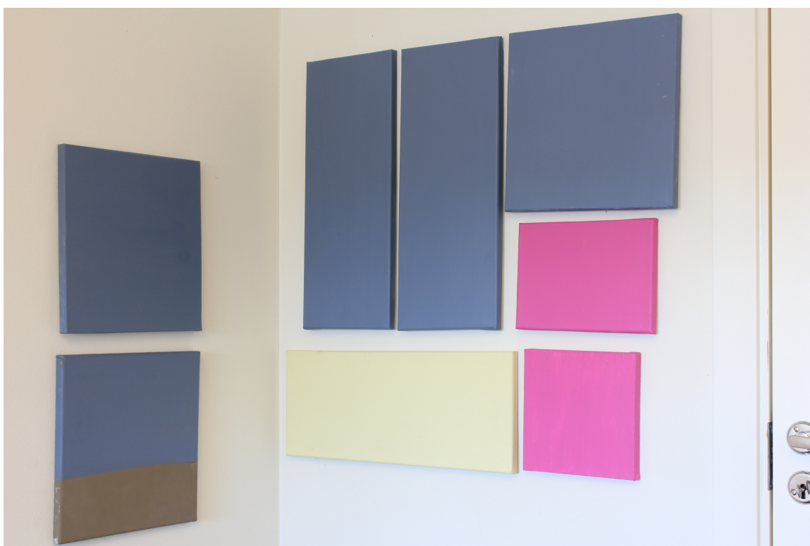
FARGEPRØVER: Veien vekk fra hvite vegger har startet. Fargeprøvene kan vurderes i ro og mak.