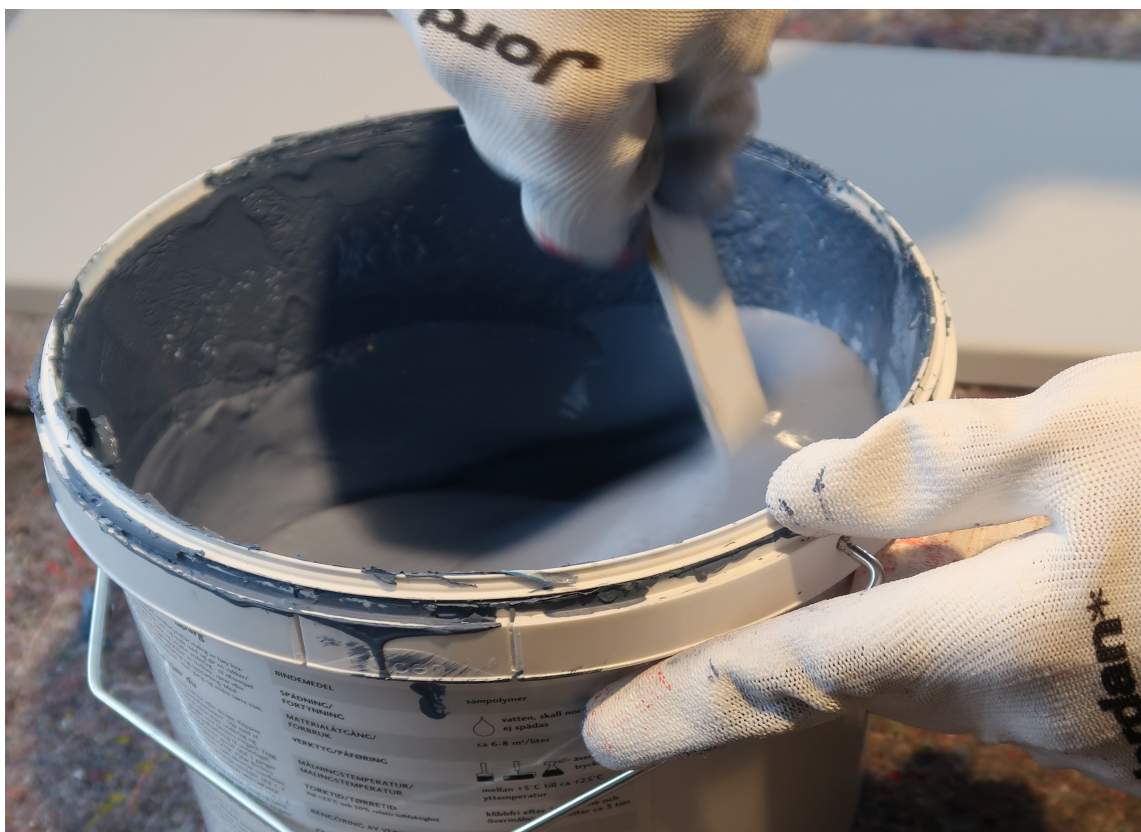
BLÅTT: Kanskje blått skal bli den nye veggfargen?