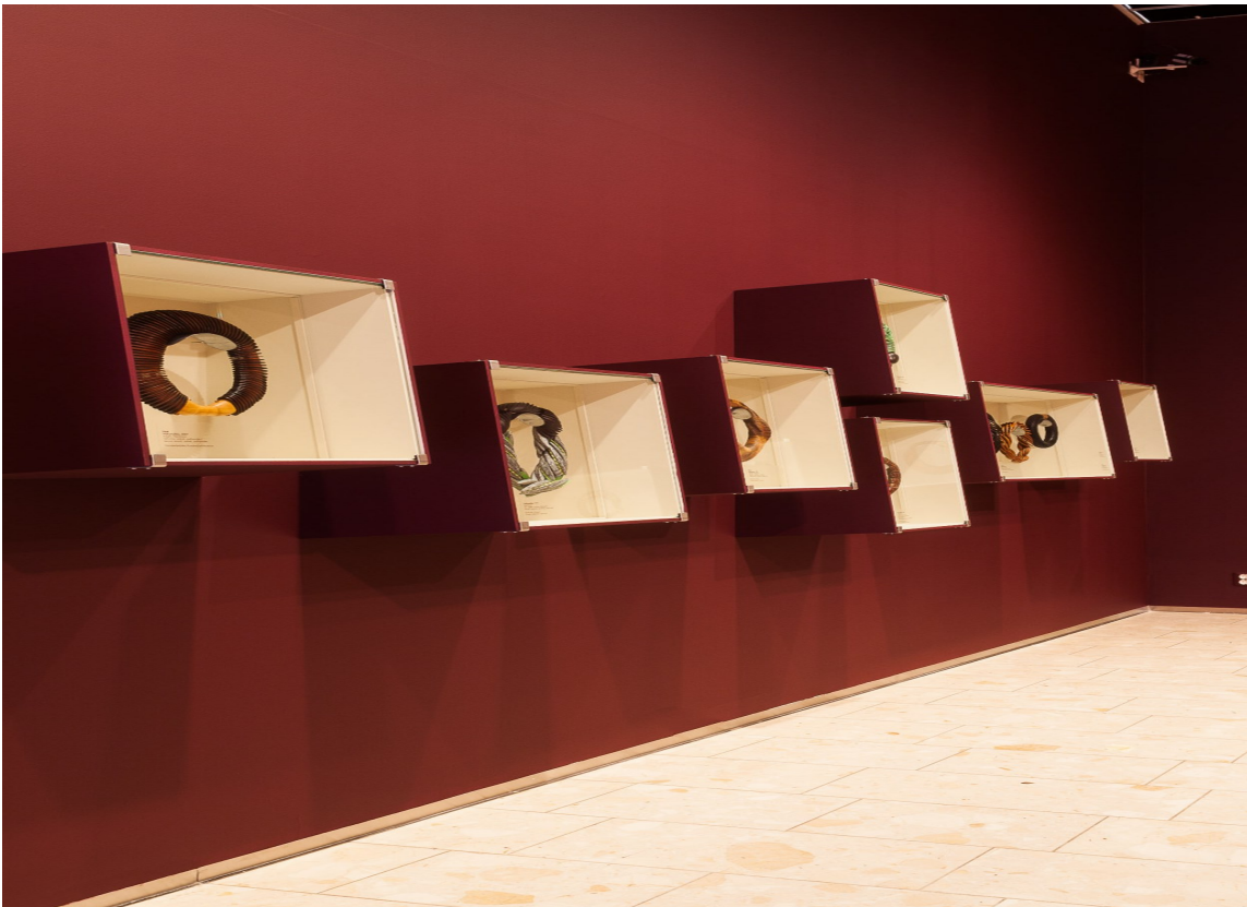
SAMSPILL: Det fine samspillet mellom veggfarger og smykkekonsten ga utstillingen en ekstra dimensjon.