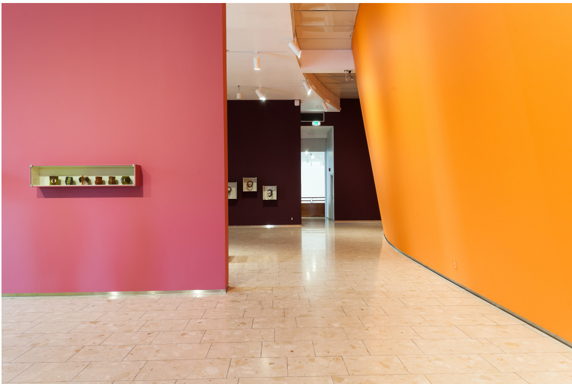
TRE FARGER: Fargene ble planlagt slik at publikum skulle oppleve minst tre farger samtidig.