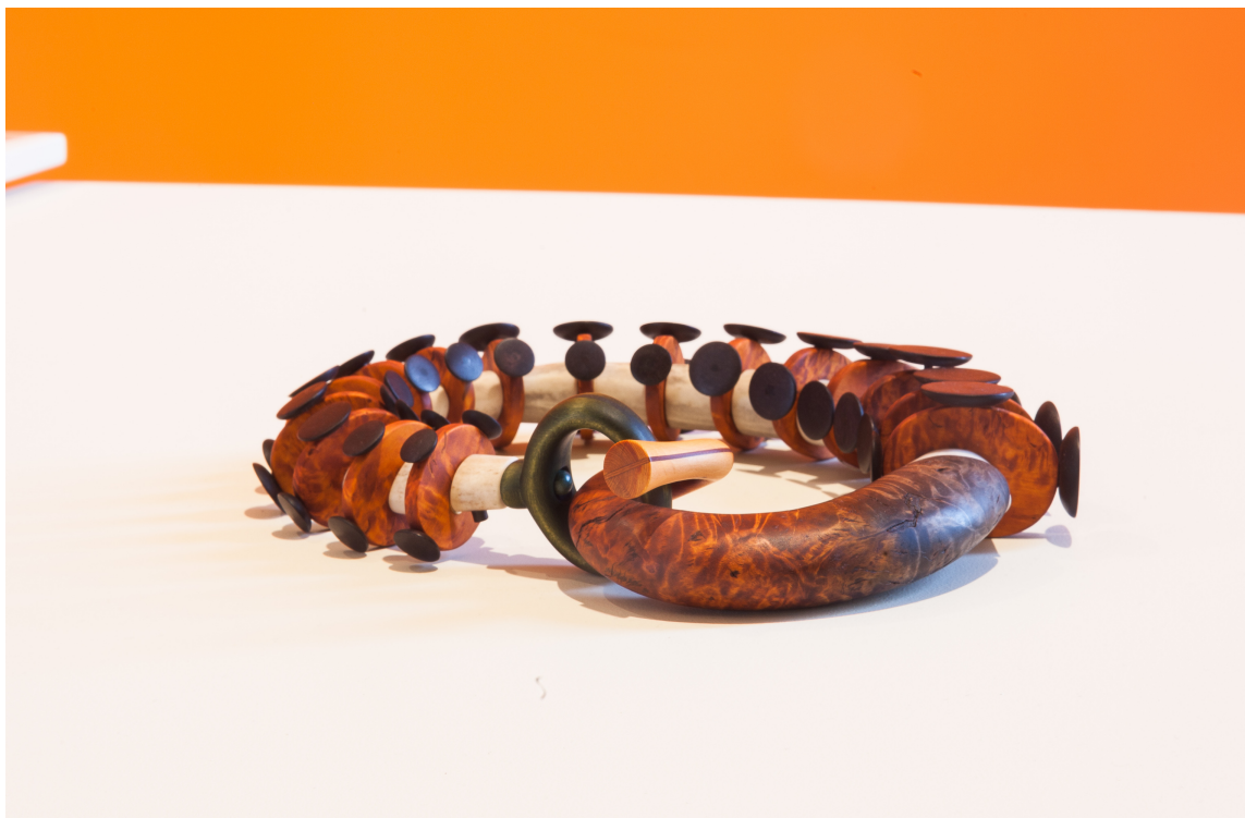
FARGESPILL: Kunstneren selv la føringer for fargevalget, og fargene ble hentet fra smykkene og forsterket på veggene for å få ønsket effekt.