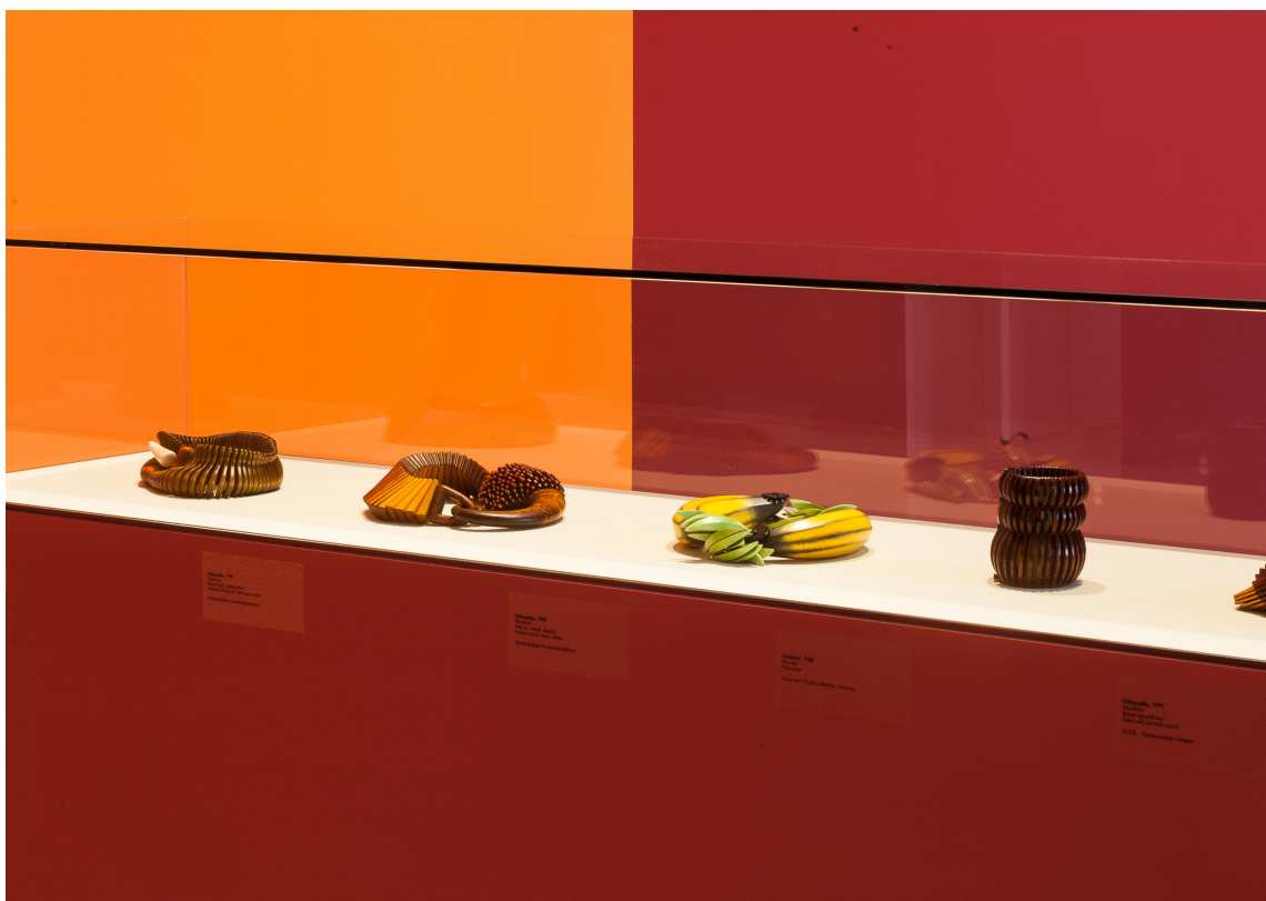
LYST UNDERLAG: Bunnfargen i smykkemontrene oppleves hvitt mot de sterke fargene, men er faktisk brunaktig grå.