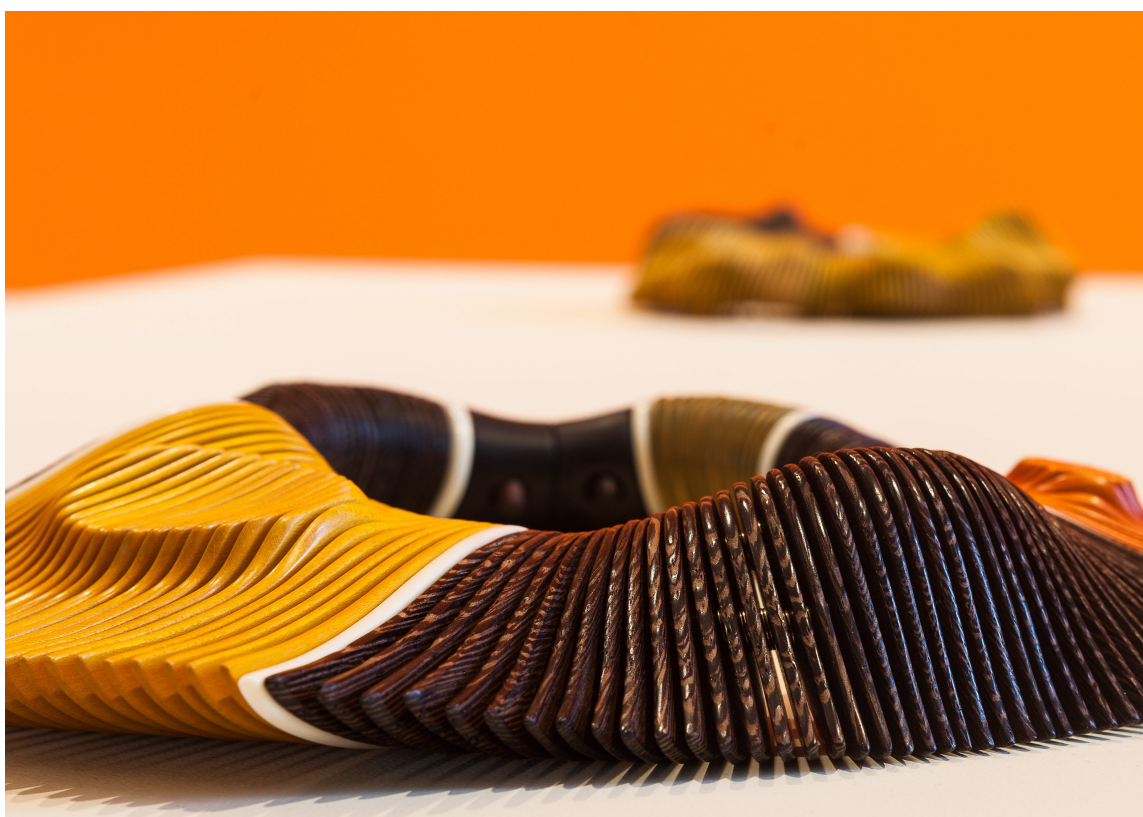
SMYKKEKUNST 2: I rom laget for å vise store malerier blir smykker et lite format, men med farget bakgrunn står de ut og tar rommet.