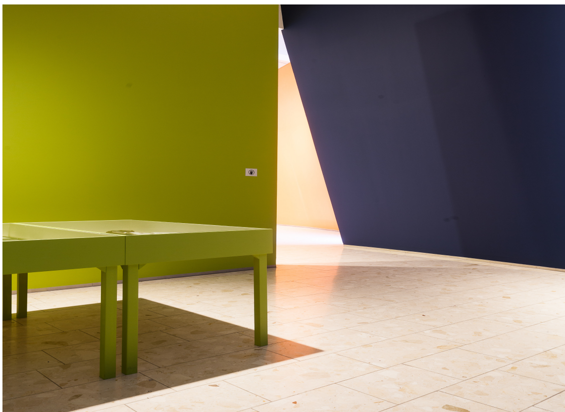
KONTRASTER: Fargene vekslet mellom lyst og mørkt.

Alt var komponert for å styrke opplevelsen av smykkene. De ble plassert mot en rolig bakgrunn i montere og på bord. Fargen var tatt ut fra det lyse steingulvet. Utstillingsdesigneren beskriver den som brunaktig grå, mens folk opplever den som hvit. Det lyse gulvet var for øvrig en vesentlig del av helheten og ga rommet nødvendig lys og luft.