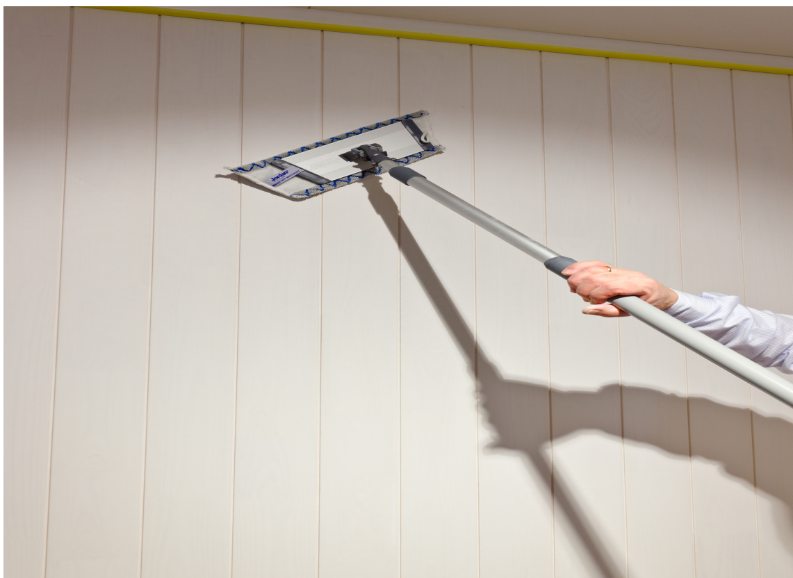
MOPP: Med mopp på forlengerskaft går det lett å vaske både vegger og tak.