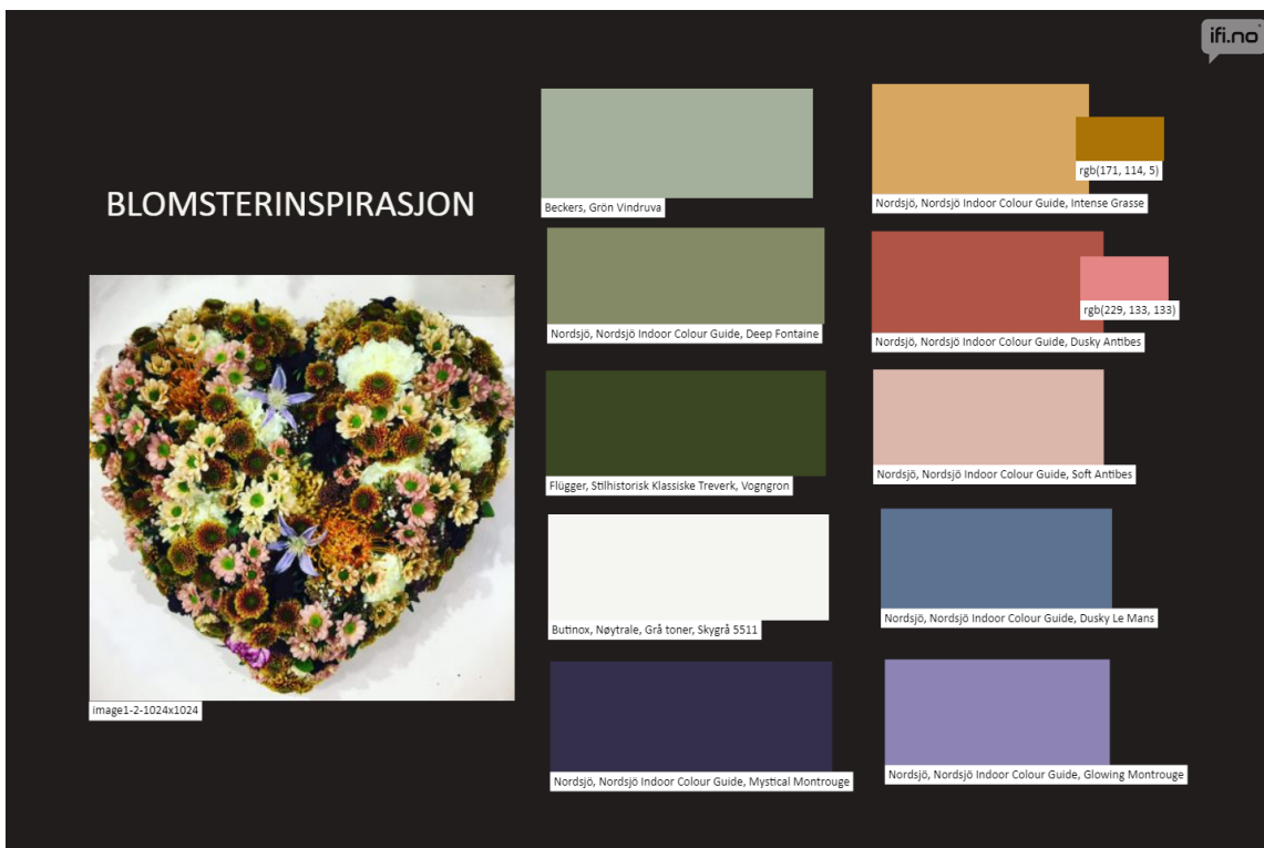
MOODBOARD: Det vakre blomsterhertet er et flott moodboard i seg selv. Her har vi latt oss inspirere, og brukte IFIs moodboard og fant farger som harmonerer til et helt hus.