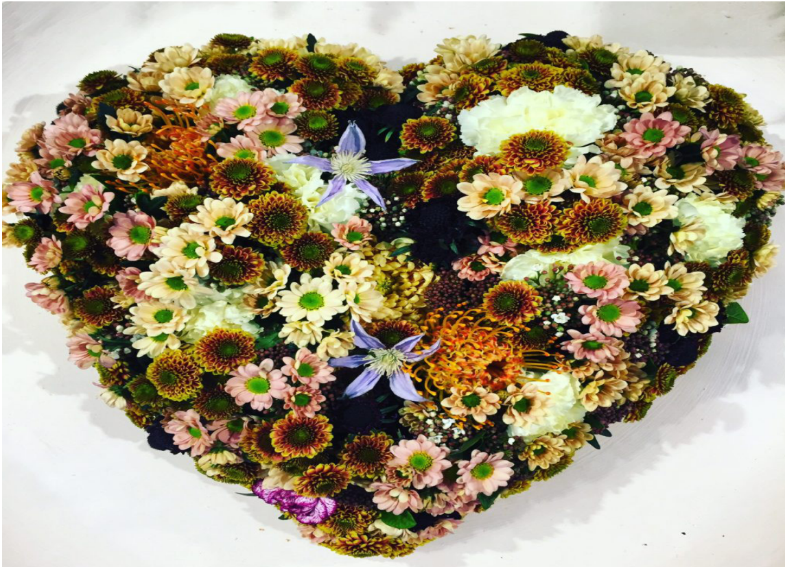
INSPIRASJON: Plukk med deg inspirasjon når du ser noe pent. Dette blomsterhertet fant Finn på en messe i Essen.