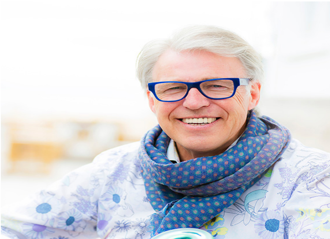
FINN: Hele landets Blomster-Finn er også en god Farge-Finn, som trives med farger både på seg og rundt seg. Han deler gjerne sine fargeråd.