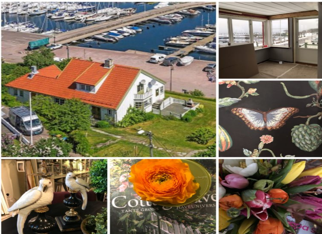
SOMMERHUS: Det kan bli mange moodboards når et helt hus skal pusses opp.