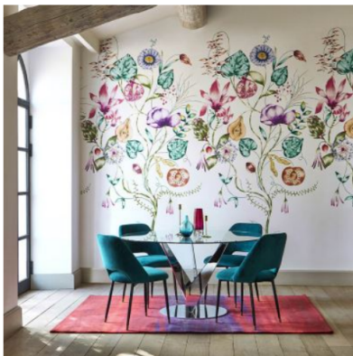
Harlequin 2018 Zapara 64 Quintes...

LEK MED NYANSER: Klare nyanser av grønt, rødt, blått, rosa... kombinert med hvitt gir en frisk og luftig atmosfære.