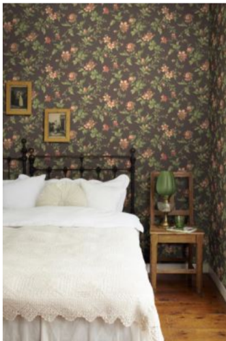
BT anno 4517 Blomslinga 01

LUNE NYANSER: For å skape en lun atmosfære kan mørke dempede nyanser av rødt, grønt, gult, rødt ...være tingen.