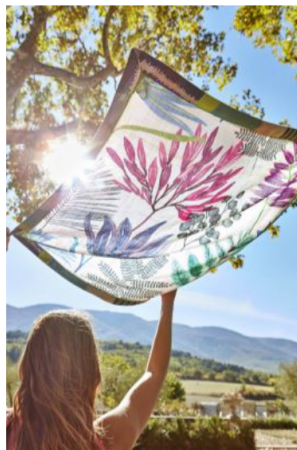
Harlequin 2018 Zapara 10 Yasuni ...