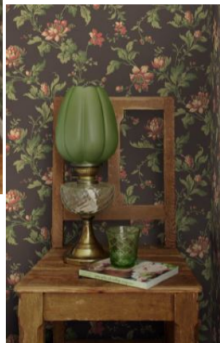
BT anno 4517 Blomslinga 02