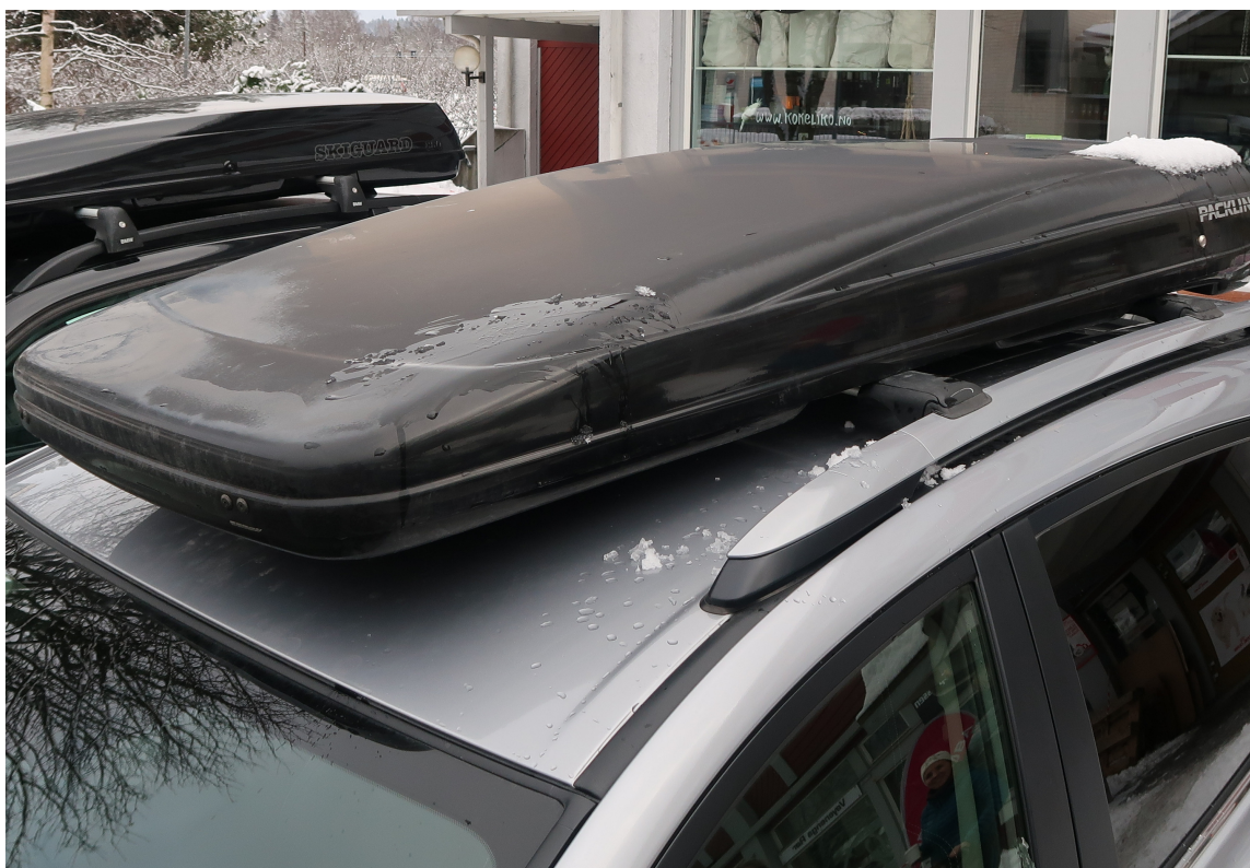
SLITEN PLAST: En skiboks blir mattere med årene. Etter en runde med Polytrol vil plasten finne tilbake til sitt opprinnelige utseende.