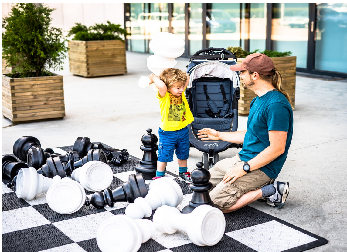
SMARTE GULV: Med fliser kan du lage dine egne smarte mønstre.