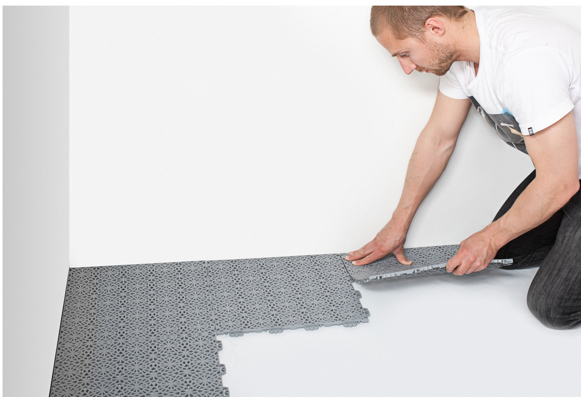
LETT Å LEGGE: Plastflisene fra Bergo Flooring er enkle på legge. Det er bare på klemme flisene i hverandre.