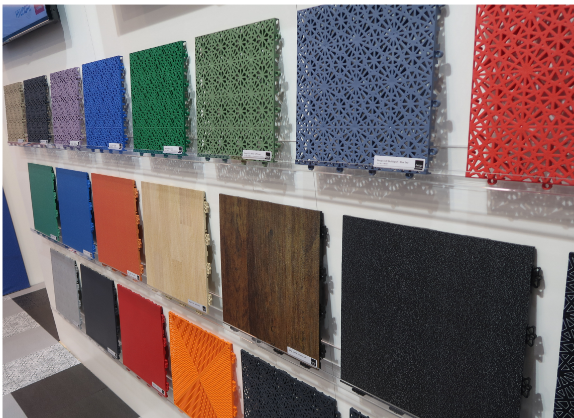
RIKT UTVALG: Bergo Flooring har et stort utvalg fliser til alle rom.