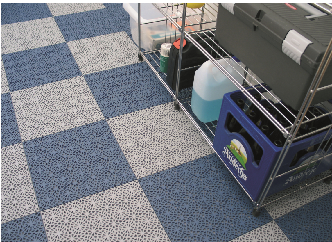
BEST I BOD: Det er ikke alltid det eksisterende gulvet er godt nok i boden. Løsningen kan være å legge plastfliser fra Sverige.