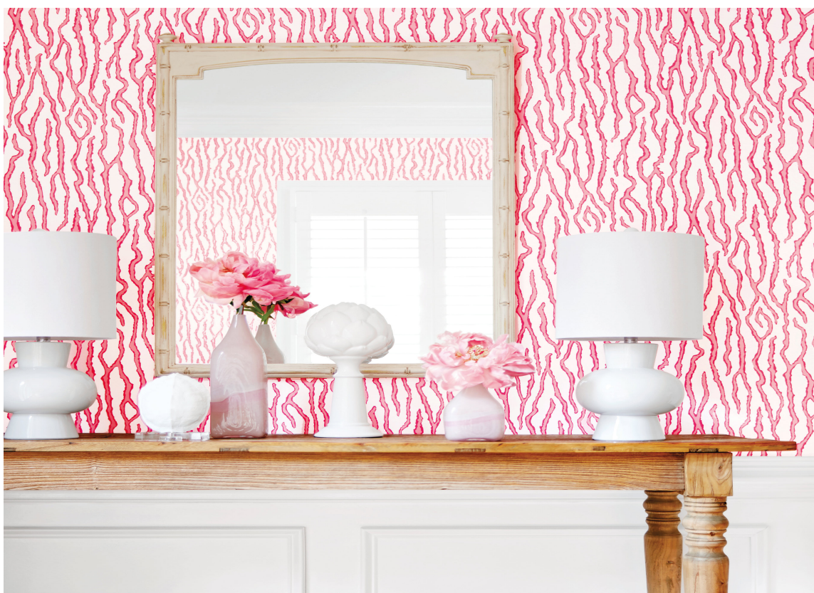
UREDD: En vårpalett tåler lekne mønstre. Med dette tapetet fra Thibaut/Green Apple slår du an en frisk og uredd tone i entreen.