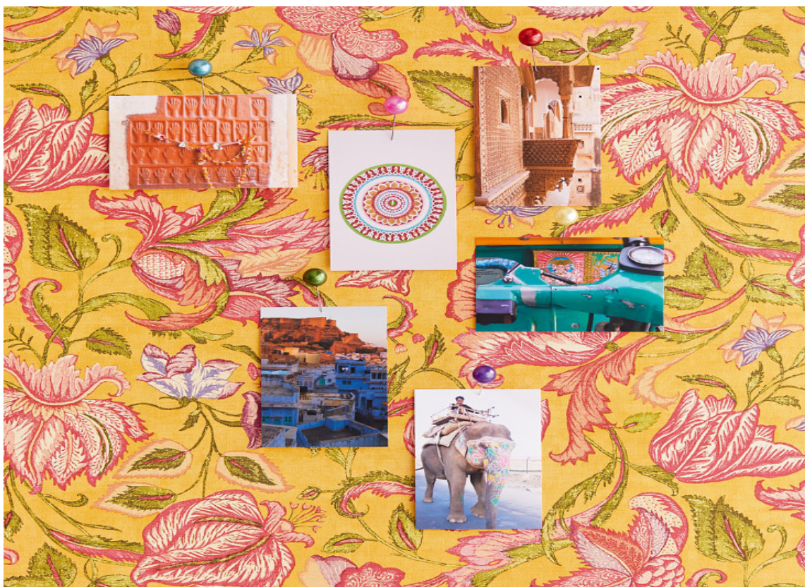
KRYDDER: Her er hele paletten i et nytt tapet fra Eijffinger/Storeys, inspirert av Østens krydder. Her er det bare å fleske til og krydre interiøret ditt.