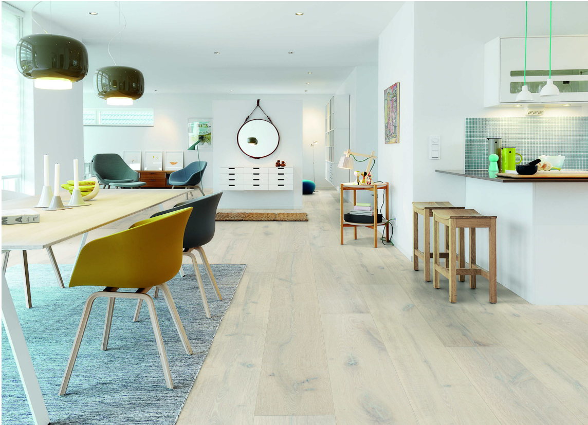
LYST TRE: For å få den lette atmosfæren er lyse tregulv perfekt. Her er det Polareik fra Pergo som tar naturen inn.