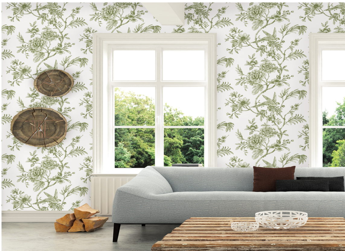
KONTRAST: Lyst og lett må balanseres med noe tungt. Her gjør formen på sofaen og de rustikke materialene jobben. Tapet fra Moonlight/Storeys.

Rom med en slik atmosfære kan vi komponere med friske kulørtoner, muntre innslag og friske kontraster mot en lys basis. Jo større kontraster, dess mer liv. Helheten balanseres blant annet med kjølig mot det varme, fast mot mykt, tungt mot lett og grovt mot fint. Her er hele fargesirkelen i bruk, og du må ta i bruk magefølelsen for å kjenne etter hva som føles riktig. Kjøennes det rett ut med friske, lette farger som tilbehør til en hvit base, så gå for det!