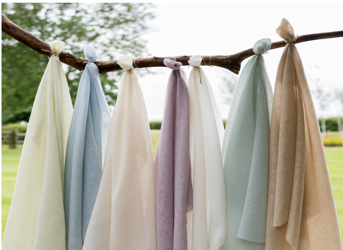
TEKSTILER: Myke tekstiler i lette, luftige kvaliteter er med på å skape en lett og luftig atmosfære i et rom. Disse heter Midori og føres av Borge.