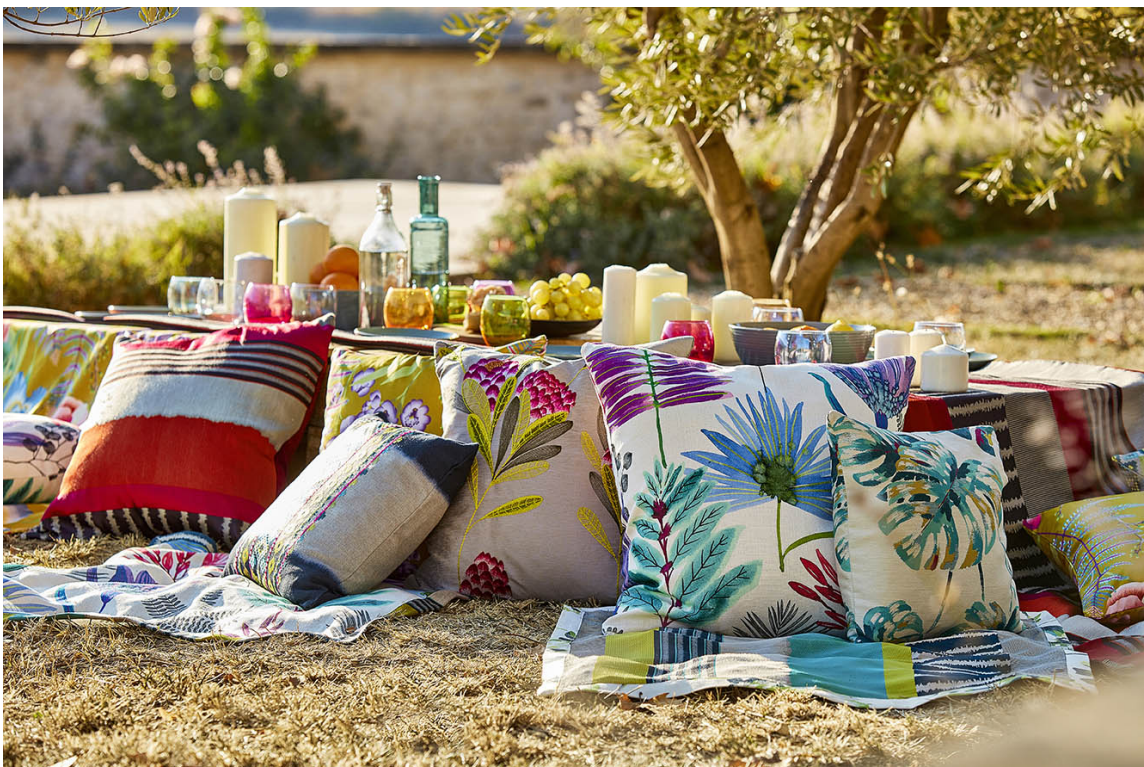
TROPISK: Denne paletten tåler friske kontraster, og nå bugner det av tropiske fristelser. Dette er nyheter fra Harlequin/Tapethuset.