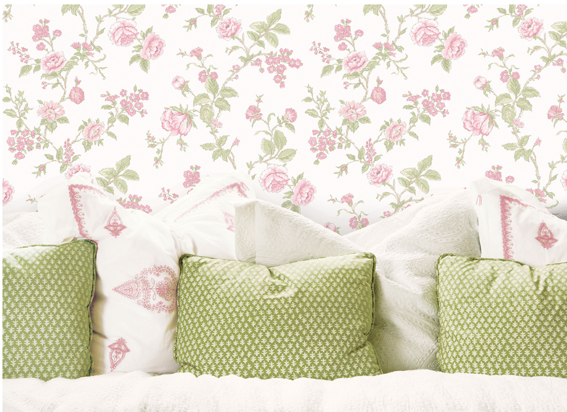
LETTET: Her spiller farger, mønster og materialer på lag i en lett helhet. Tapetet er fra kolleksjonen Jardin Chic/Fantasi Interiør.