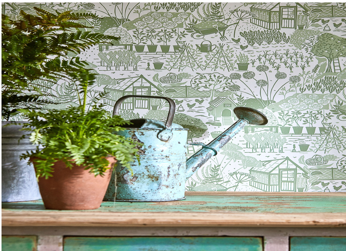
GRØNT: Det er mange fine grønnnyanser i naturen. Vi kan med hell herme og få et livfullt interiør selv med små fargesprang. Tapetet er fra Sanderson/INTAG.

Slik kan vi filosofere over våren og finne særpreg. Ordene vi bruker kan vi bruke som inspirasjon når vi skal finne «vår stil». Bruk stikkordene som en guide og veiviser når du skal velge farger, former, materialer, mønster og tekstur.