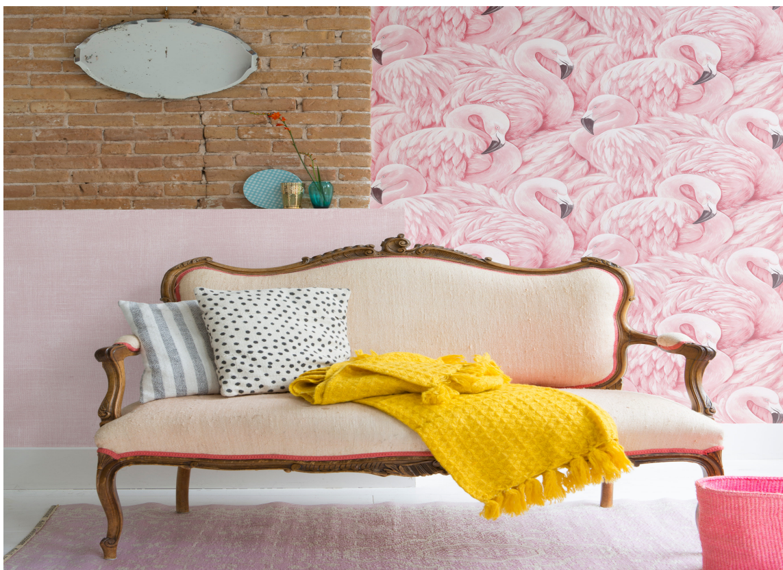
LEKENT: På avstand ser tapetet nesten ensfarget ut. Dette er for en leken sjel med sans for vårmuntre detaljer. Tapetet Colourfull Living fra Borge.