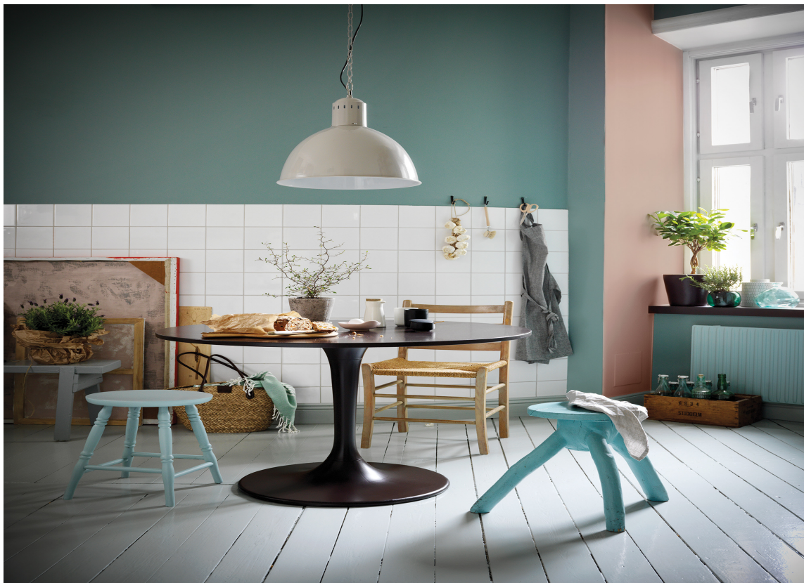
MATT: Med matte malinger får du en fin farge og et delikat uttrykk. Mange matte malinger gir en avtørkbar overflate.

Ønsker du en matt vegg bør du lese godt på emballasjen og pakningsvedlegget, hvorvidt malingen regnes for å være vaskbar eller robust.