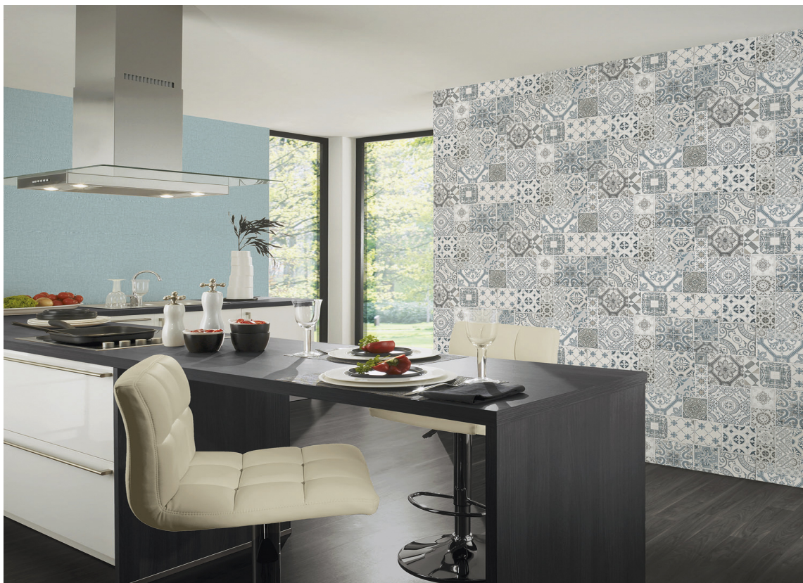
VEGGDEKOR: Mønstrede vegger kledd med tapet er ikke et problem på kjøkkenvegger. Mange tapeter takler fint den slitasje de kan bli utsatt for på kjøkkenveggen.