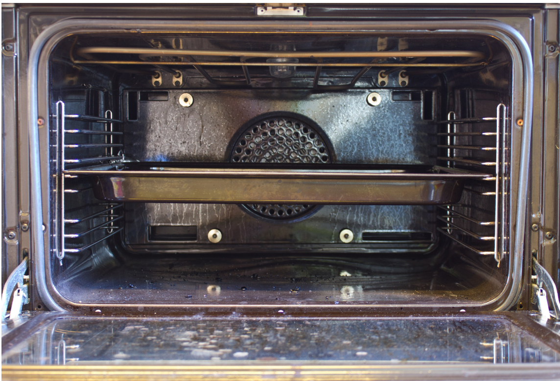
BRENT: Innbrente matrester i stekeovnen er ikke særlig lekkert.

Her er tre tips til å holde kokesonen ren: