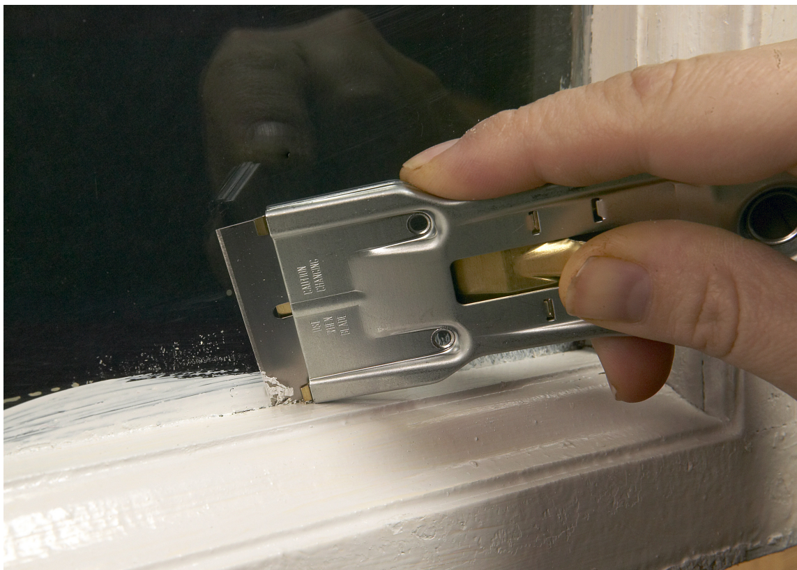
VINDUSSKRAPE: I tillegg til å fjerne malingrester fra vinduet, kan du bruke vindusskraperen til å skrape vekk innbrent fett og størknede matrester. Rengjør uten å ripe.