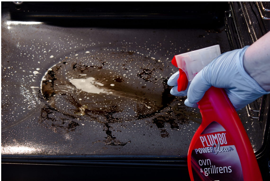
STEIKE RENT: Spesialmidler for ovn og grill fjerner også gjenstridige flekker og fastbrente matrester i stekeovnen, så den blir klar for et nytt måltid.