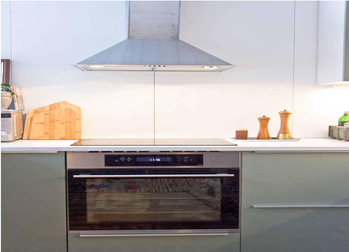
KOKKEKLAR: Fingermerker, støv på viften og rester av tidligere middager i stekeovn og på koketoppen fjernes enkelt og raskt med moderne rengjøringsmidler.