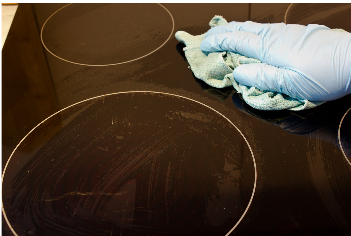
RIPEFRITT: Keramisk platetopp rengjøres med et rengjøringsmiddel uten skureeffekt og som ikke etterlater skjolder på overflaten.