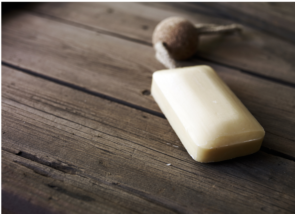
TRESTRUKTUR: Våtromsvinyl som ser ut som ekte tre er et godt alternativ på badet.