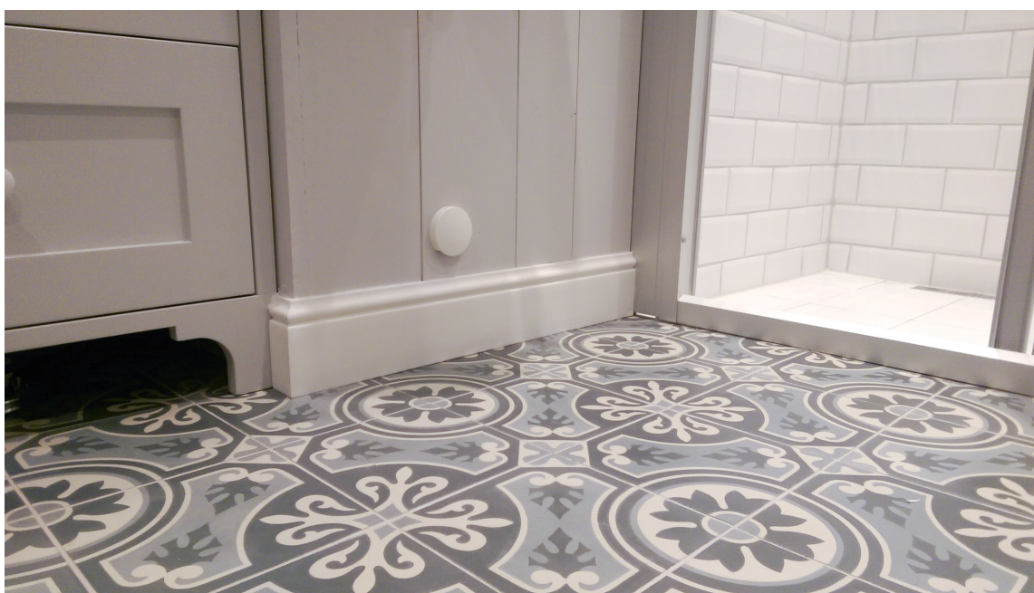
VANNFAST: Listverk i HD polystyren er laget for å tåle vann. Kunstmaterialet er lett og hardt, og det hverken krymper eller sprekker opp.

Treverk og våtrom er sjelden en veldig god kombinasjon. Vil du ha gulv- og taklister eller omramminger rundt vinduer og dører, er derfor lister som tåler vann en god investering.