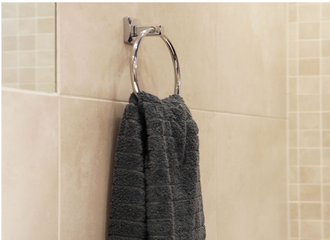
NULL HULLL: Et enda så lite hull i membranen blir en veritabel motorvei for fukten på badet. Monter derfor med lim.

Membranen bak overflaten i våtrommet skal sikre at fukten ikke trenger inn i konstruksjonen. Når vi så henger opp speil, knagger og hyller, borer vi gjerne hull i veggen, setter inn en plugg og skrue. Noen av oss husker å putte silikon i hullet først. Men en annen måte er å bruke lim for å montere gjenstander på badet. Limet holder også tunge ting på plass, uten å perforere fuktsperren.