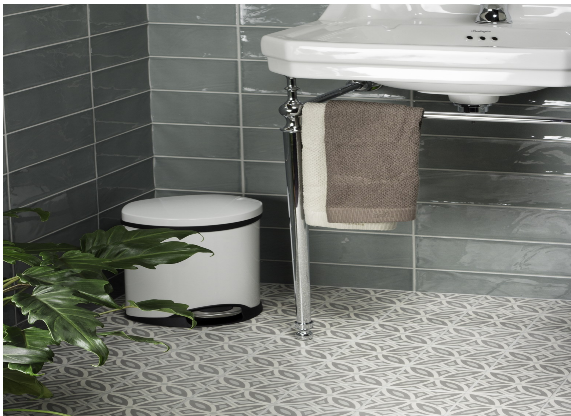
KVALITET: Dårlig kvalitet på fliser kan lage problemer både estetisk og ved montering.