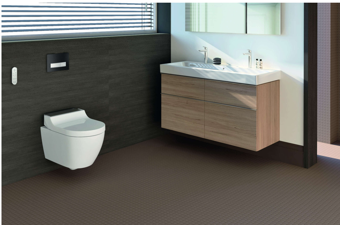
LUKSUSDO: Dusjtoaletter gir deg en spa-opplevelse og følelse av luksus. Har du først prøvd er det ingen vei tilbake.