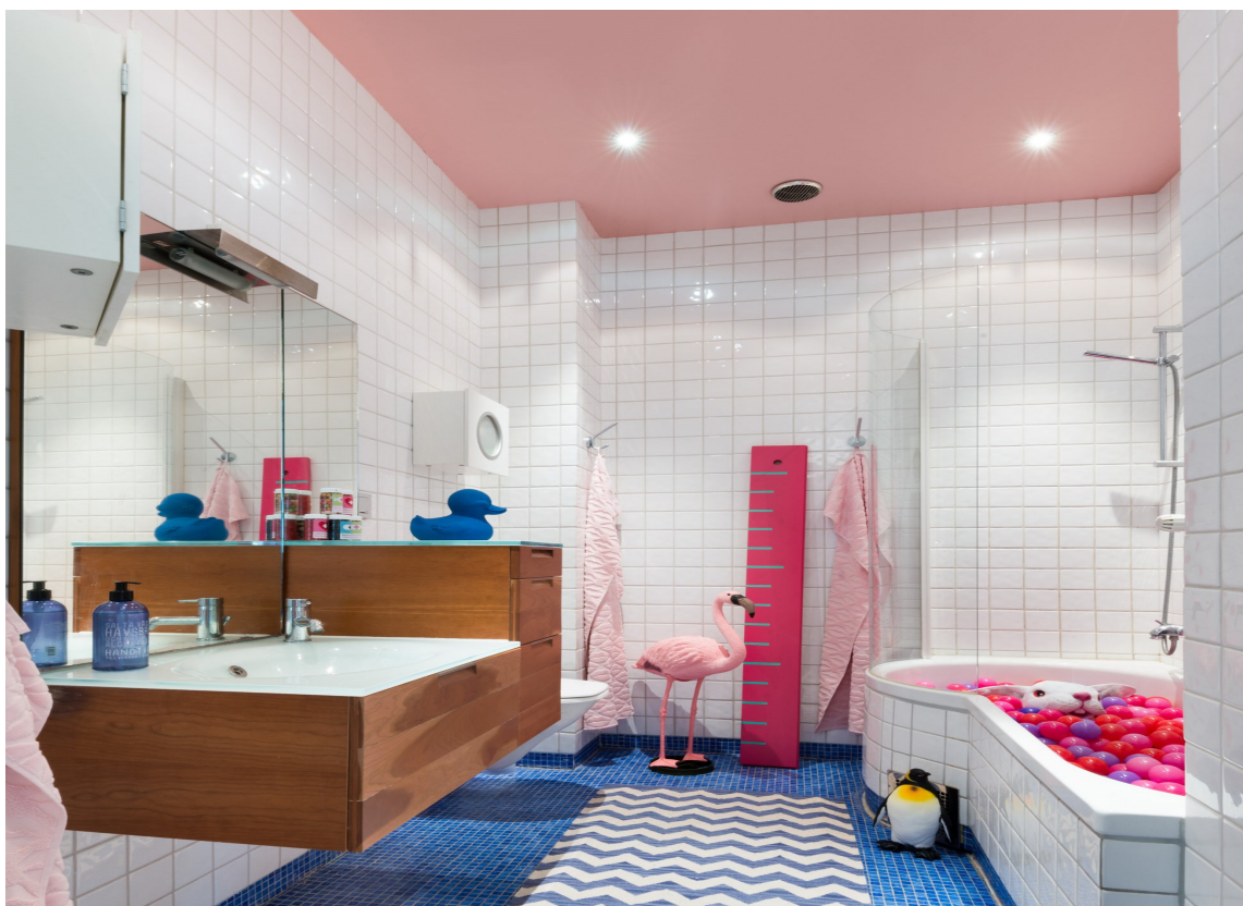
WOW-EFFEKT: Et rosa tak kan bli prikken over i-en på badet.