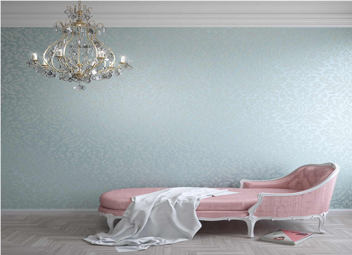
VARIASJON: Vinterens blåfarger kan variere stort.