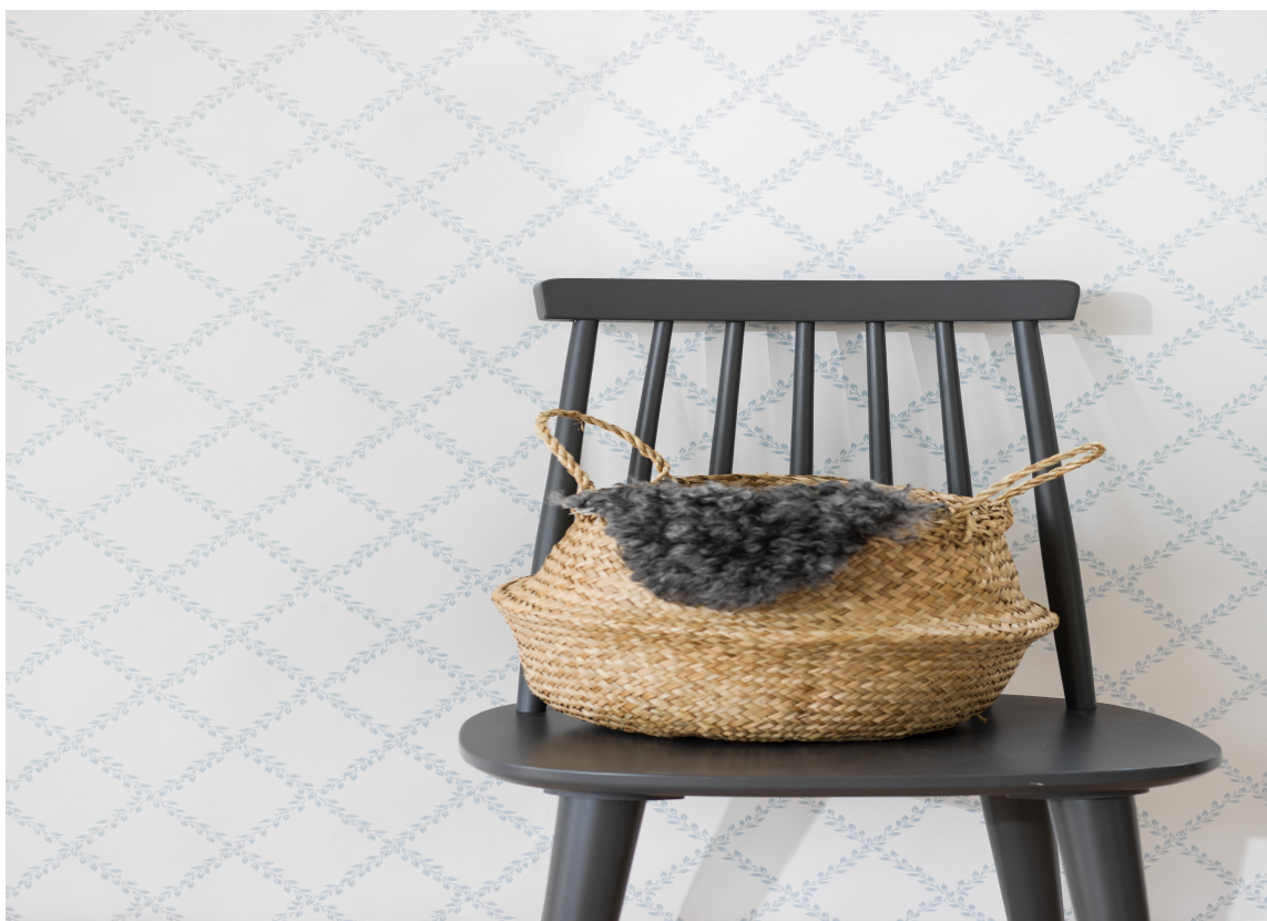
TAPET: Det skal ikke så mye til for å få den stemningen du ønsker. Et enkelt, mønstret tapet kan være det du trenger.