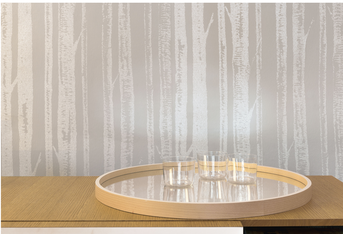
NAKNE TRÆR: Du kan også la deg inspirere av vinterens motiv, som de nakne trærne i naturen.