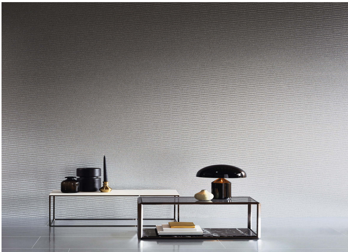
STRAMT: Vinteren kan for mange bringe assosiasjoner til et litt stramt uttrykk, med enkle, rene linjer og grålig, kjølige farger. Det kan skape et elegant uttrykk.