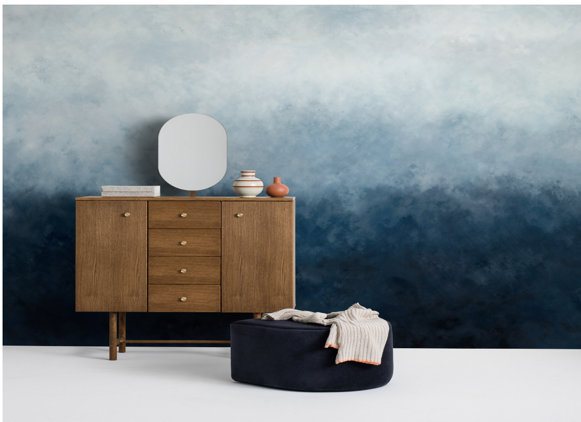
HELE SPEKTERET: I dette tapetet fra Mr Perswall/Borge, vises hele spekteret av vinterværet, fra mørketiden til den svale, kalde luften.