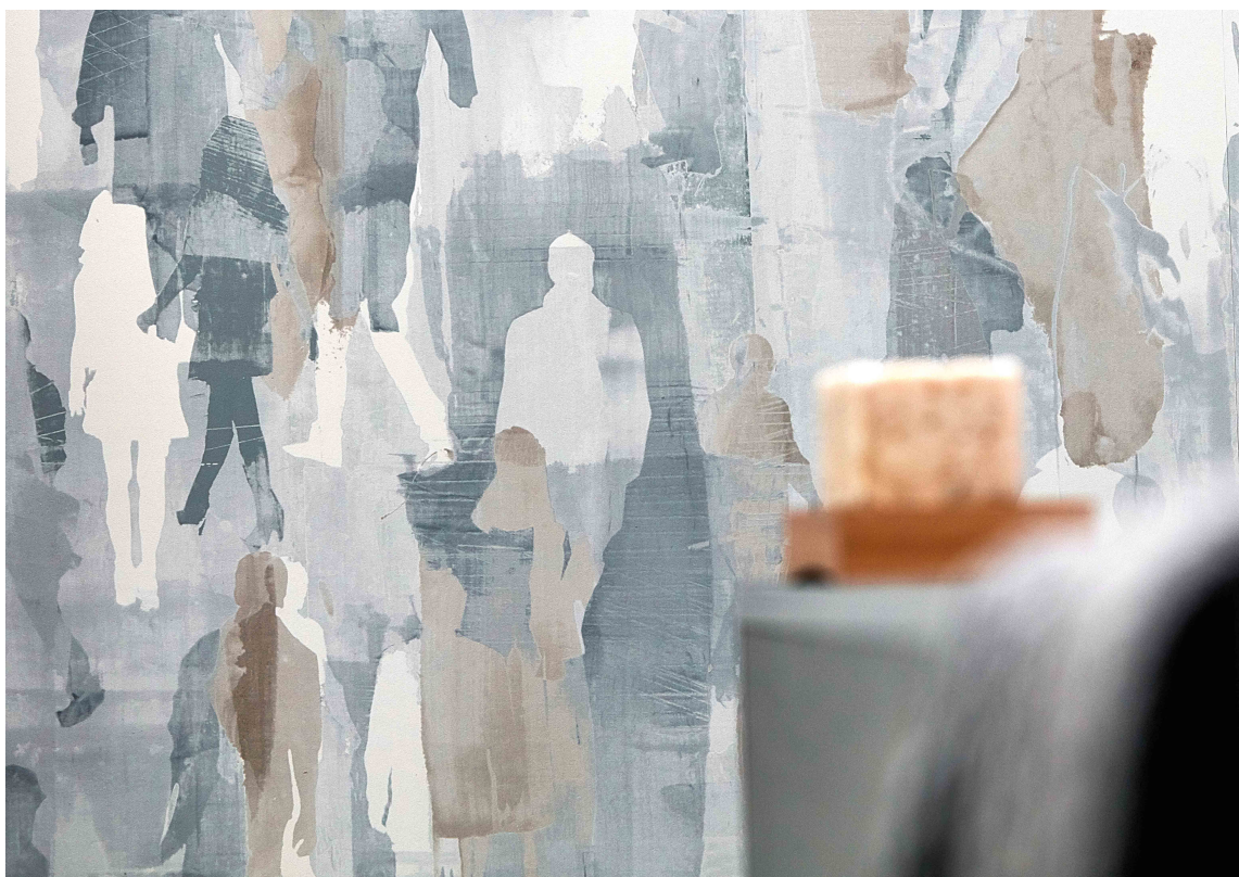
MULIGHETER: Det er mange måter å dra inn vinterens farger på, som på dette tapetet fra Tapethuset.