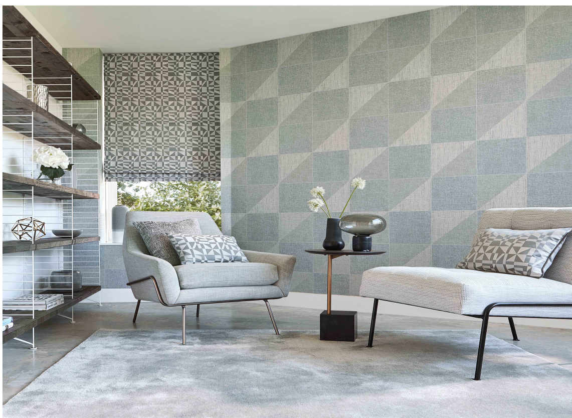
LYST OG BLÅTT: Dette tapetet fra Tapethuset får frem vinterens deilige, lyse blåfarger.