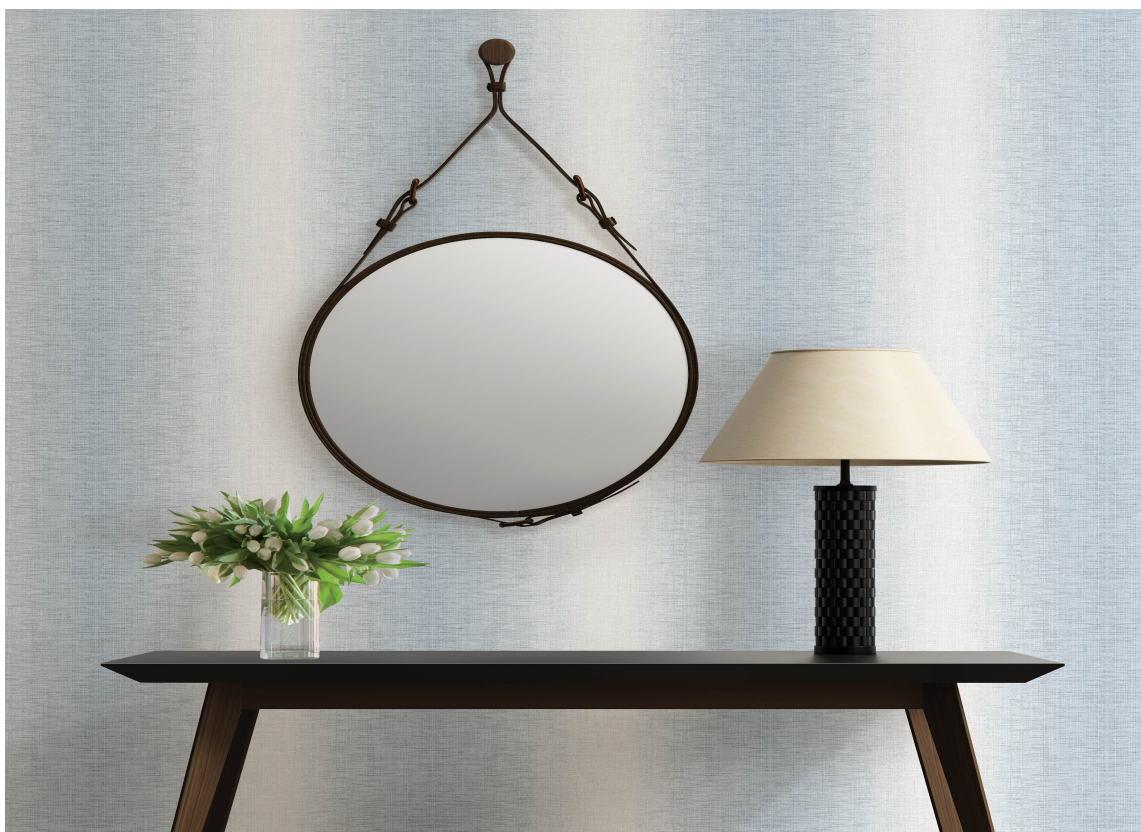
DUS: Dette tapetet fra Storeys får tankene til å gå til den kalde, friske vinterluften på fjellet.