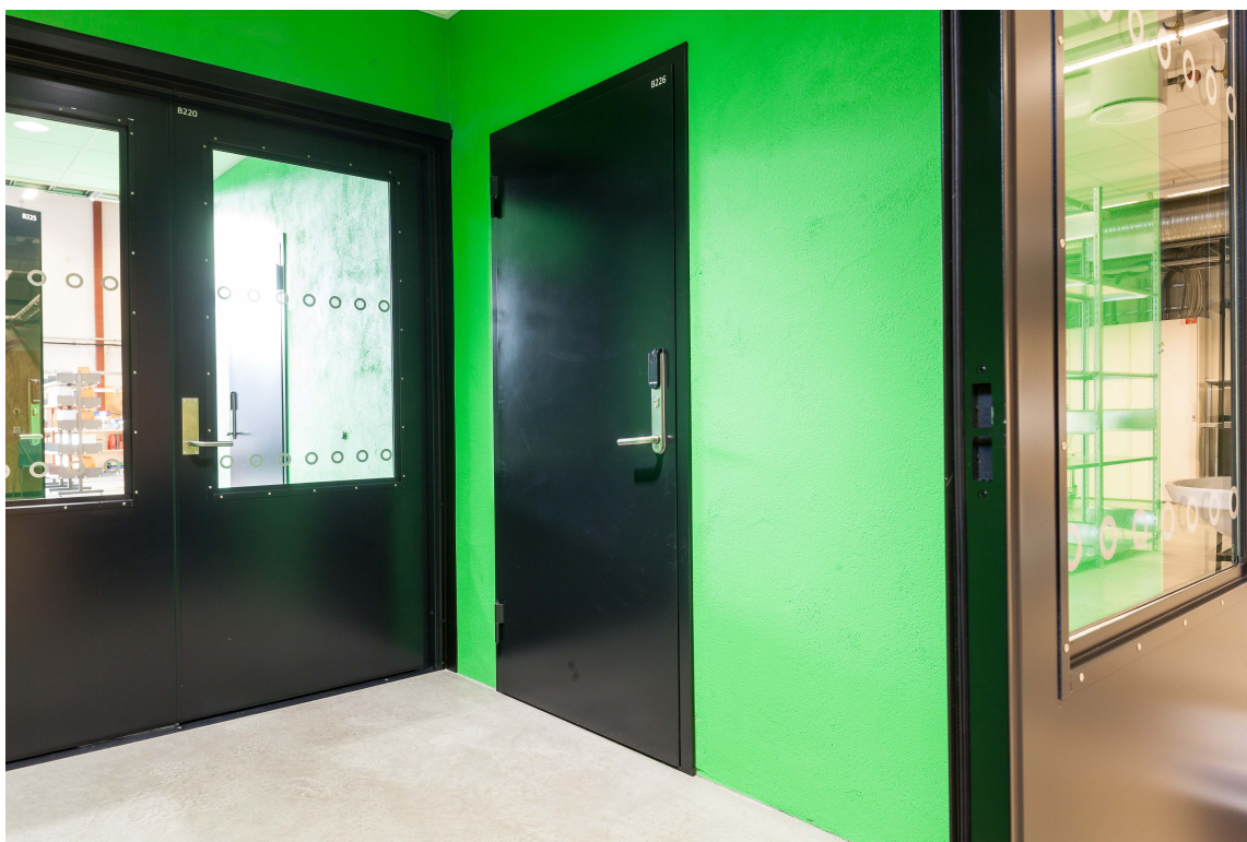
FARGEKICK: I lagerrom og andre underordnede rom får elever og lærere en vitamininnsprøyting fra fargerike vegger.