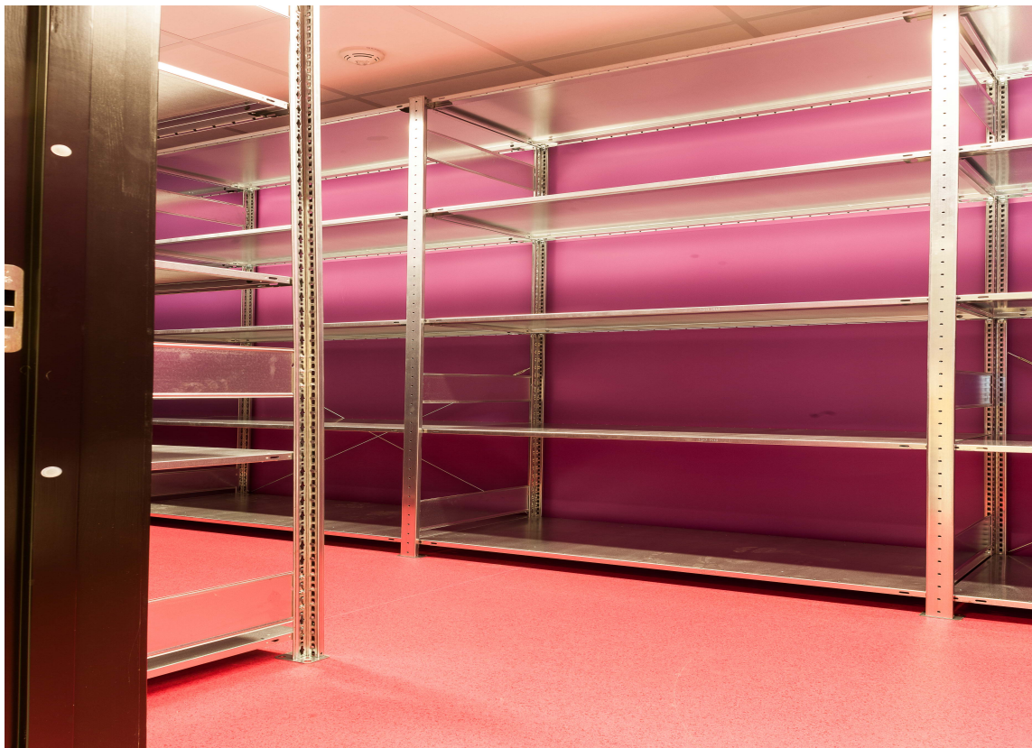
FARGEKICK: I lagerrom og andre underordnede rom får elever og lærere en vitamininnsprøytning fra fargerike vegger.

– Vi ønsket at arealet skulle brukes til læring og elever, minst mulig «dødareal». Det skulle være lett å finne fram til ulike tjenester, og romplasseringen er pedagogisk styrt, forteller hun.