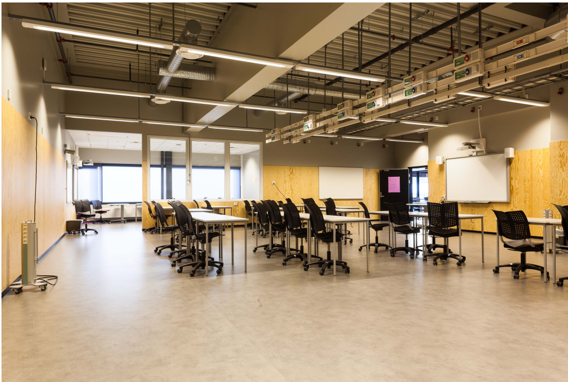
KRYSSFINER: I bygget er det trematerialer i mange ulike former, her fra et av undervisningsrommene for tekniske fag er det brukt kryssfiner for å få inn et element av tre. På gulvet er det også tatt et akustikkdempende grep; det er lagt Sarlon akus