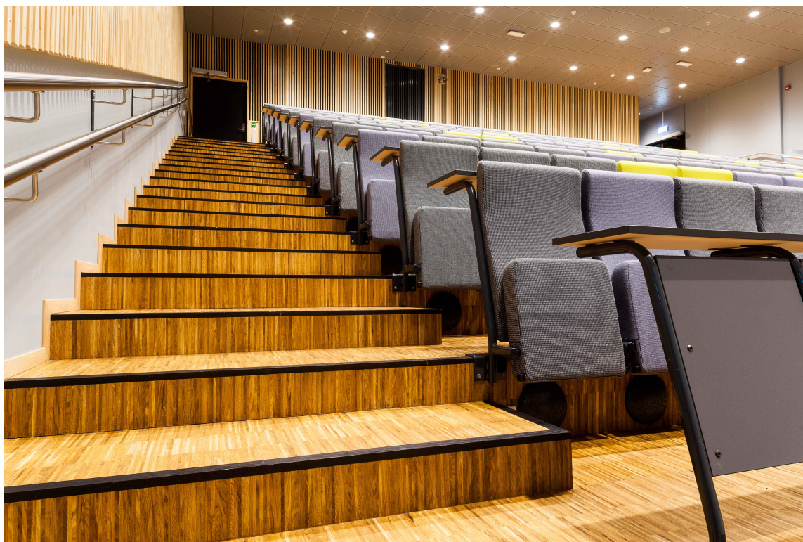
AUDITORIET: Her er det plass til 225 elever. Industriparkett på gulvet og trespiler på veggen er brukt også her som en del av byggherrens trestrategi.