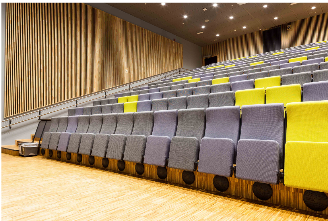
FARGEPROFIL: Stolene fra Fora Form er miljøriktige både i form og kvalitet. Fargene er en del av den visuelle profilen og bygger opp om skolens identitet.