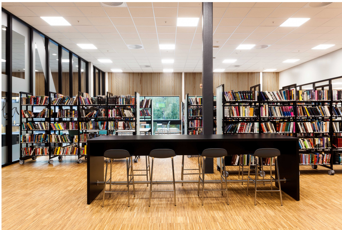
BIBLIOTEKET: Industriparkett på gulvet og trespiler på veggen bidrar til et godt akustisk miljø på biblioteket.