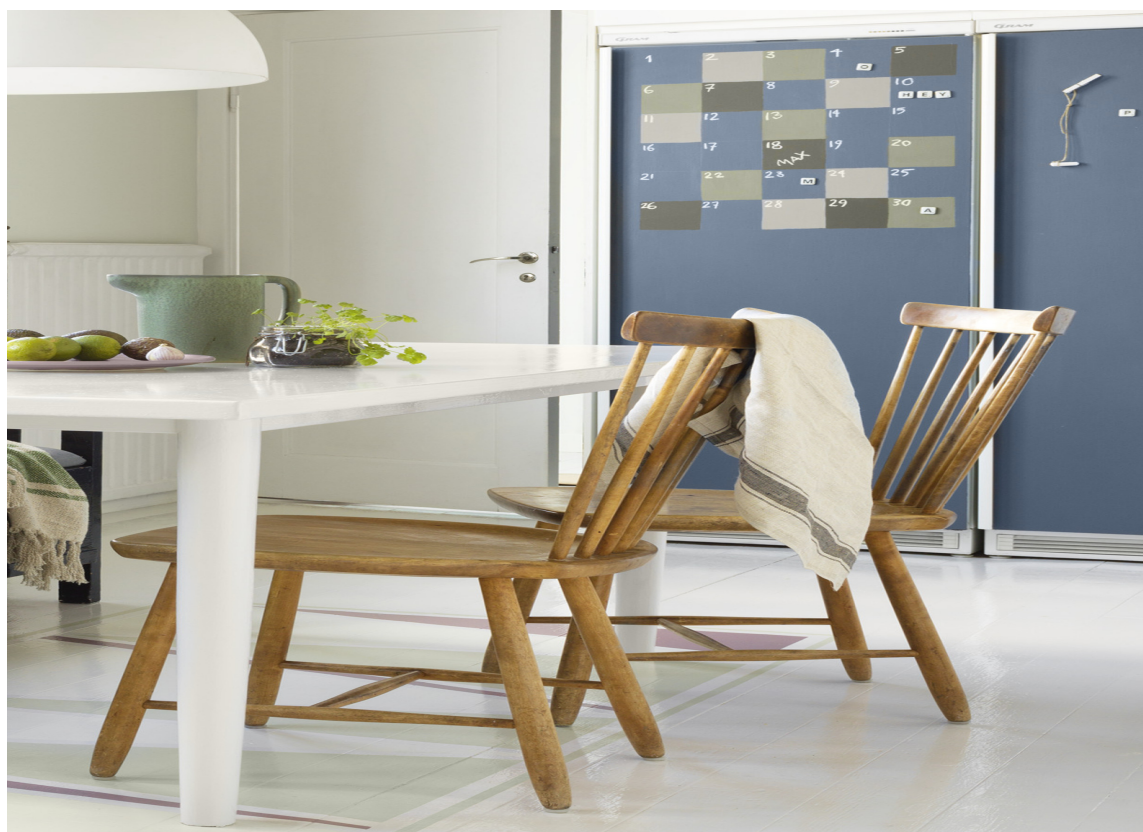
KALENDER Den påmalte kalenderen på kjøleskapsdøren går aldri ut på dato!

Eller hva med å skrive neste dagers meny, som en påminnelse om hva som må handles inn og hva som må til? Eller rett og slett en hyggelig hilsen til en annen som bor i samme hus.