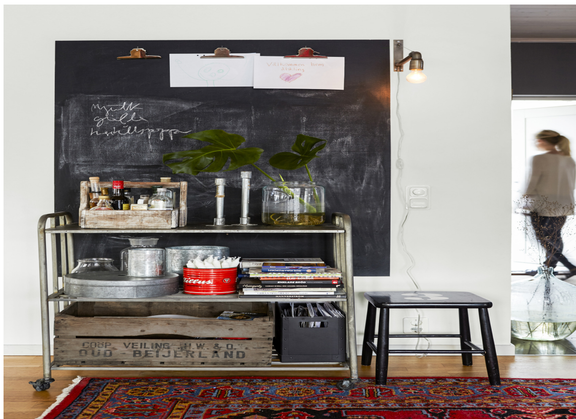
BAKVEGG Den malte tavlen har fått god plass og fungerer som en tøff bakvegg til møblene.