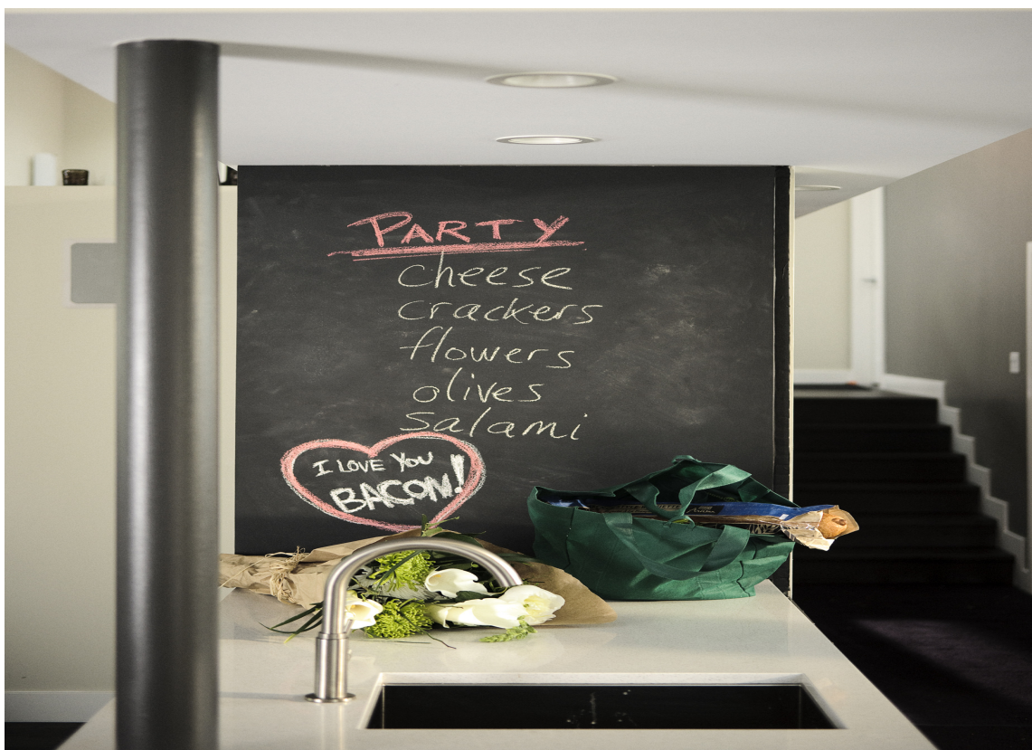
NÅR ENDEN ER SORT... At skapveggen i enden av kjøkkenbenken er påført tavlemaling og fungerer som huskeliste = plassbesparende og dekorativt.