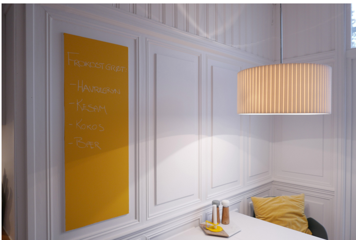
SOL PÅ KJØKKENET Med knallgul tavlemaling har du solskinn på kjøkkenet hele året.