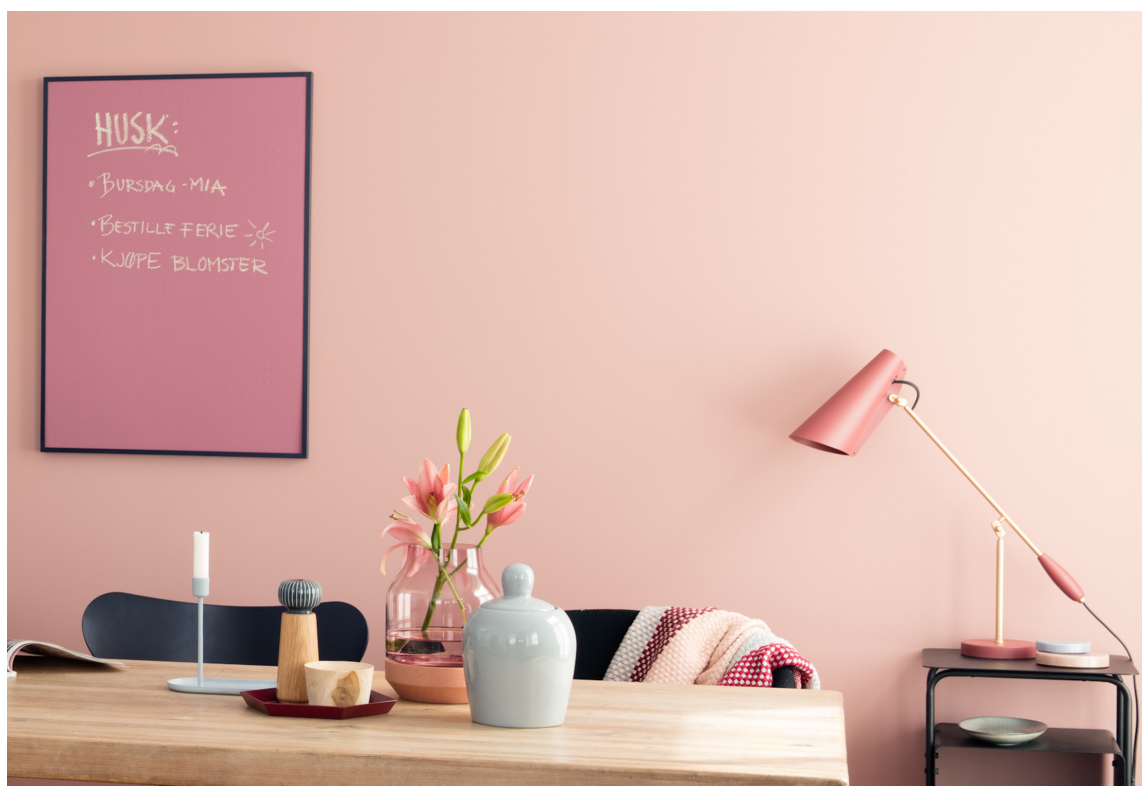
BILDE Tavlen (5897 Plomme) matcher veggfargen (5896 Slør), og med en ramme rundt ser den ut som et bilde – som en del av interiøret.