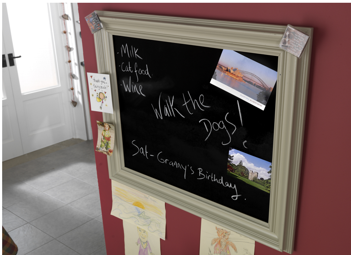
STILFULLT Det blir schwung over husketavlen med en klassisk, bred bilderamme rundt tavlemalingen.