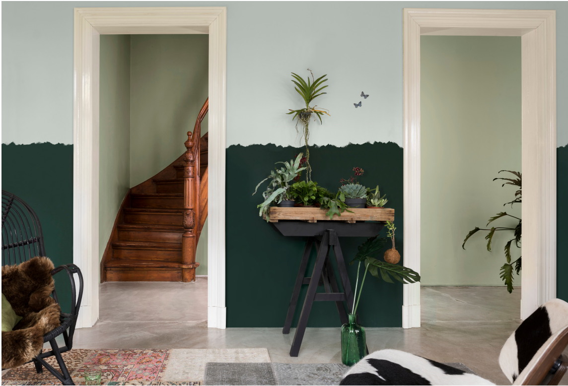
HALVVEIS: Fargen "Island Evening" er brukt i gangen hos bloggeren @olivia_angeline_f.