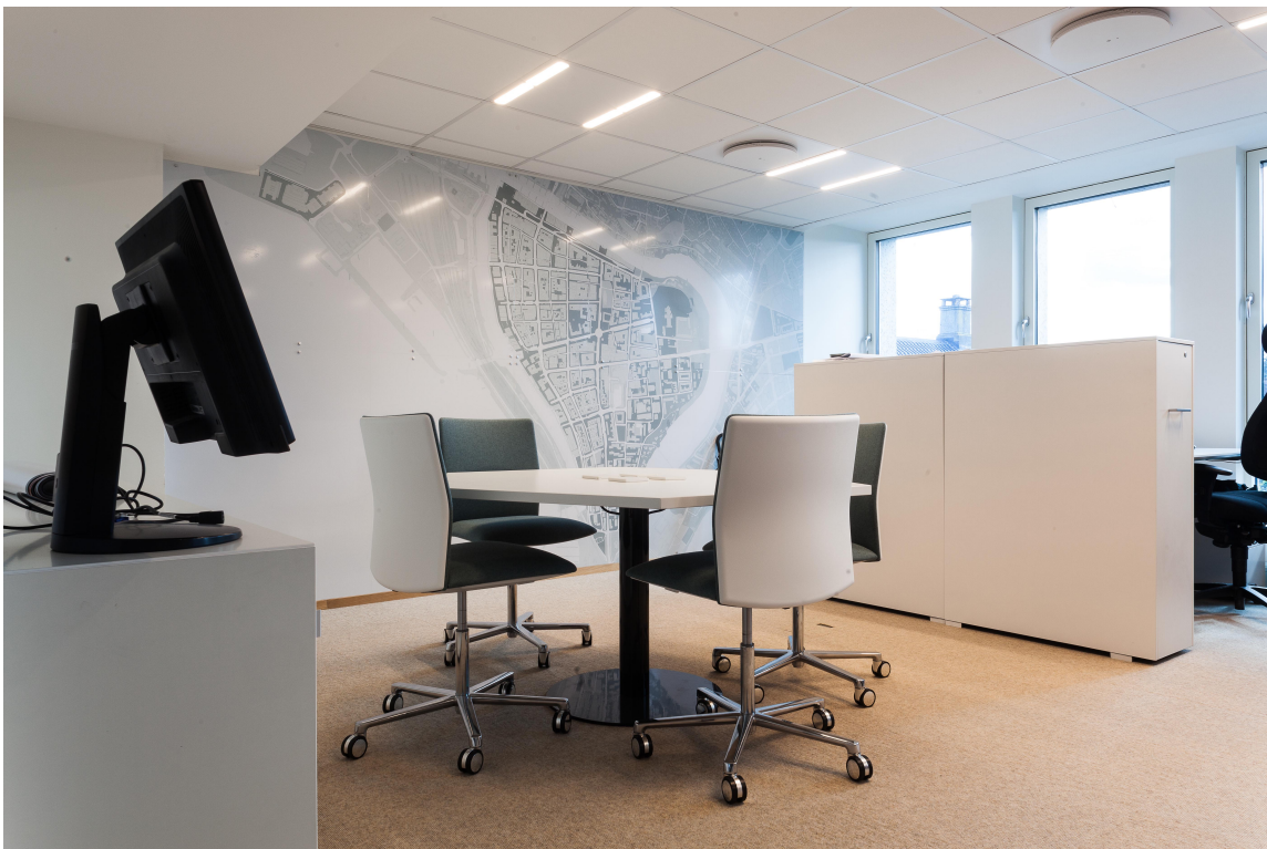
BYEN PÅ VEGGEN: På en av veggene er det hengt opp en plate med kart over Trondheim sentrum.