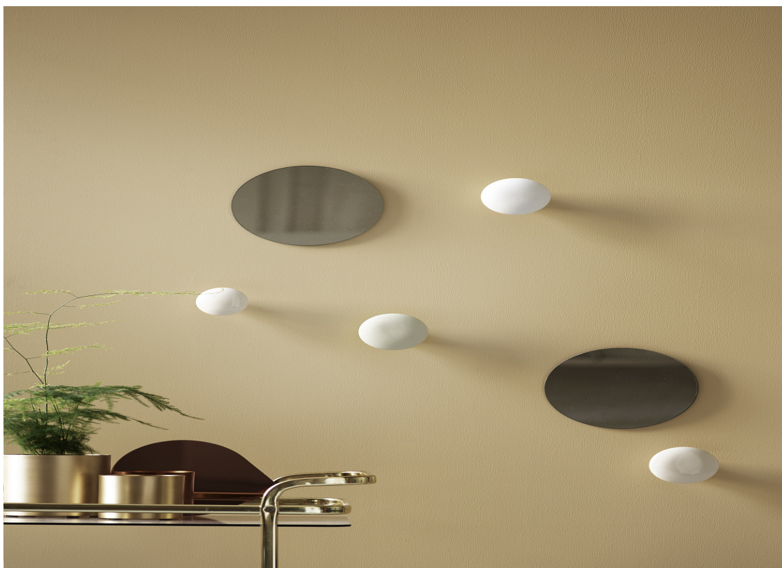
VARIG: Flügger er opptatt av å utvikle farger som kan holde lenge.