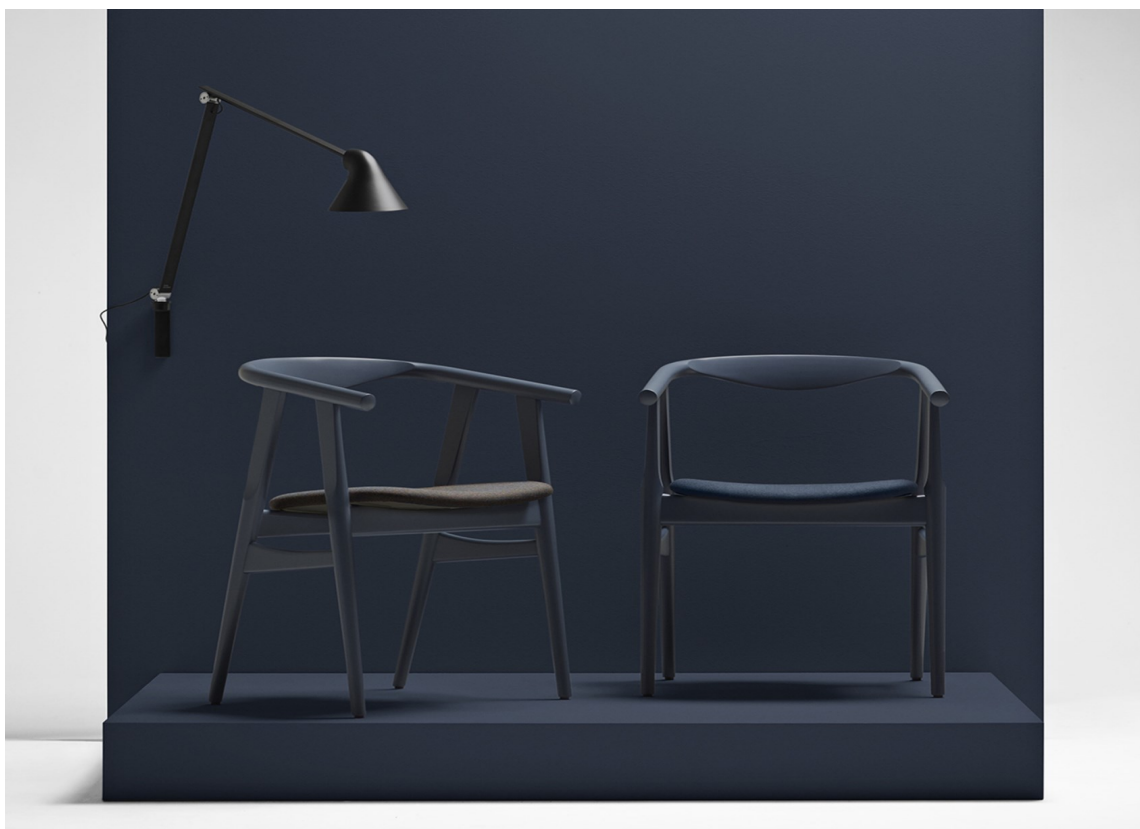
KLASSISK: Med sine Wegner-farger, dykker Flügger ned i historien, og gjenskaper farger som er evig gyldige.