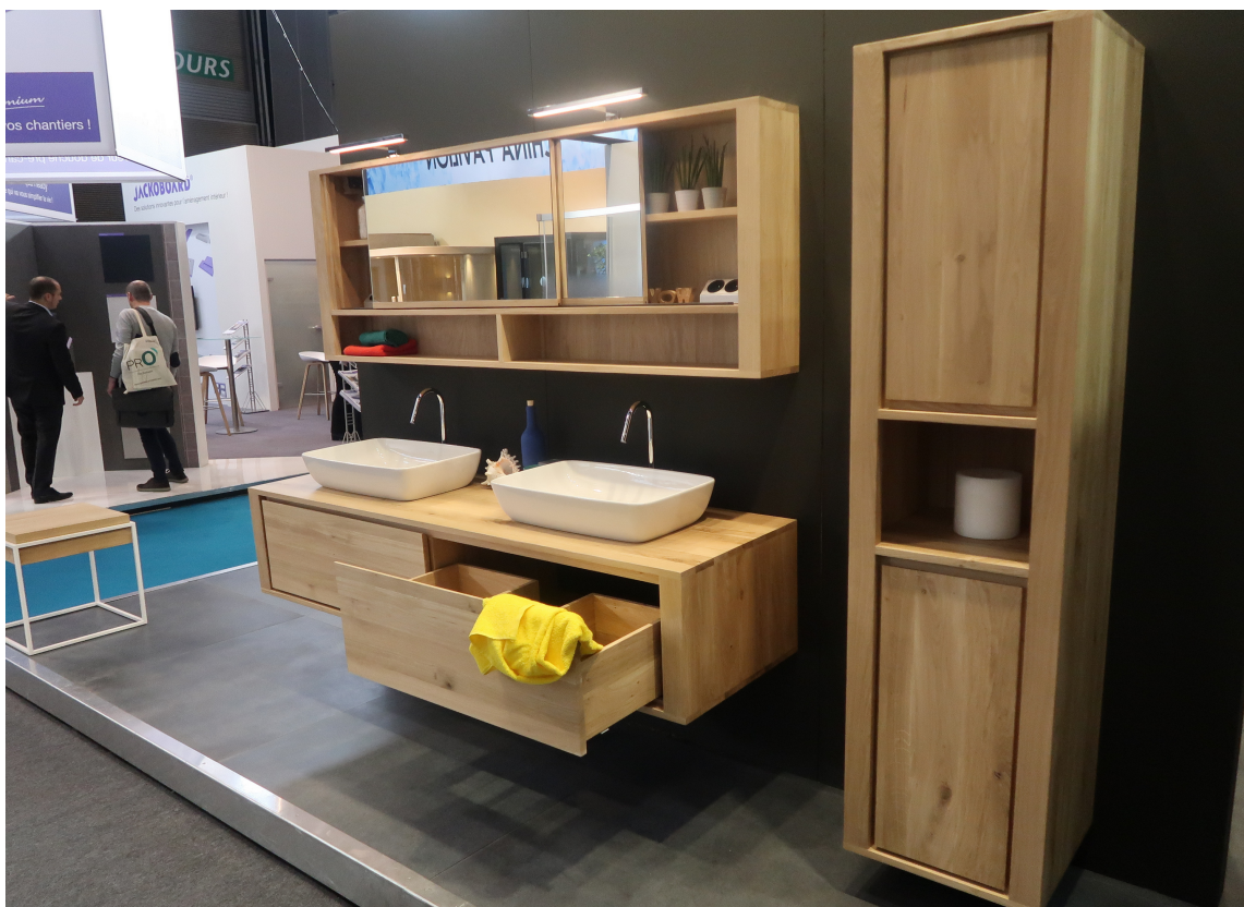
TRENDY MED TRE: Økende bruk av treverk i overflater og som konstruksjonsvirke preget flere utstillere på den franske messen.