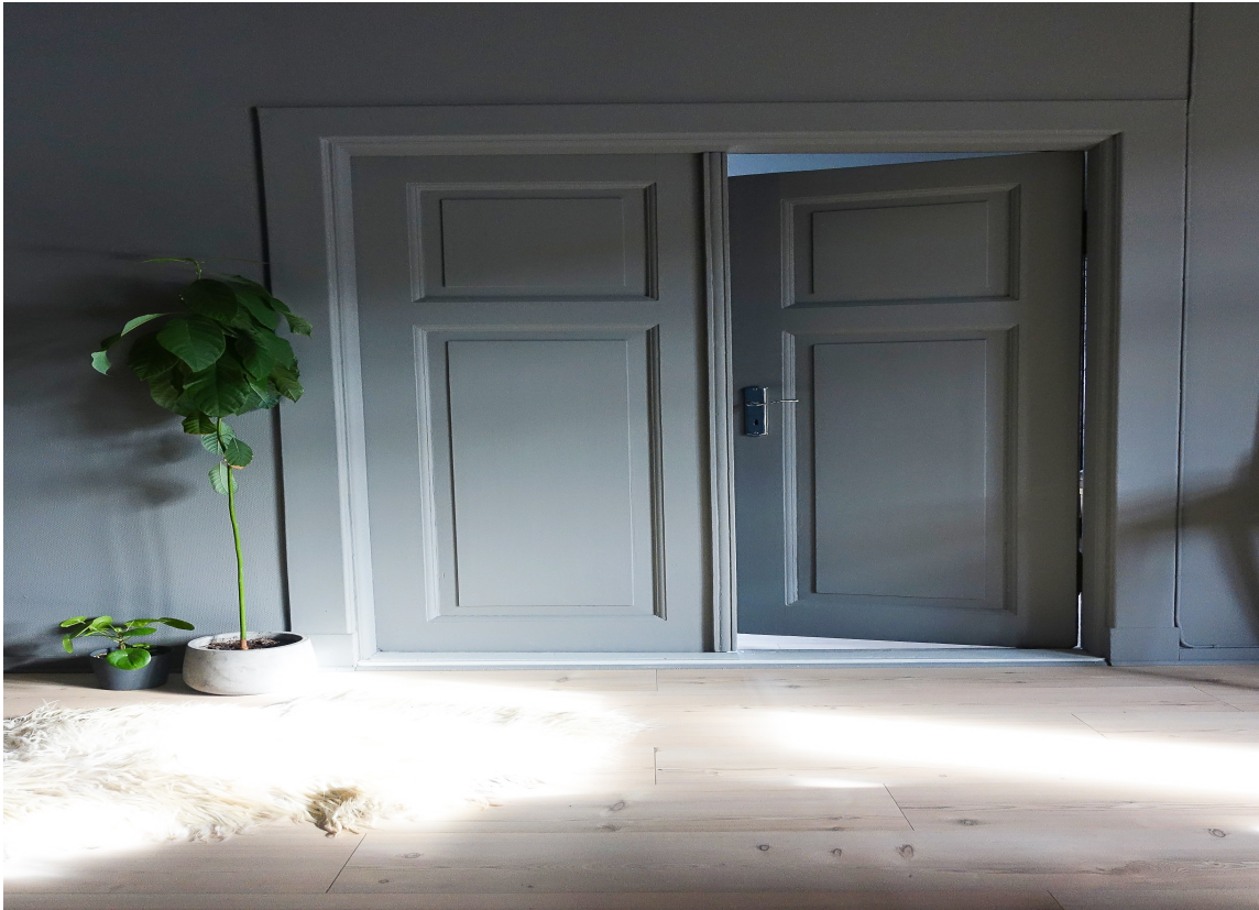
MATT: Dør og vegg i samme farge og maling; Elephant Skin i Licetto fra Pure & Original.