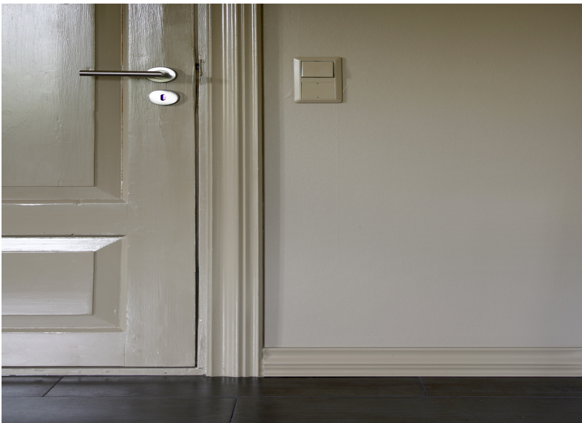
MIKS: Det kan ha stor effekt å mikse glansgrader. Her er vegg malt i en matt maling og døren i en blank.