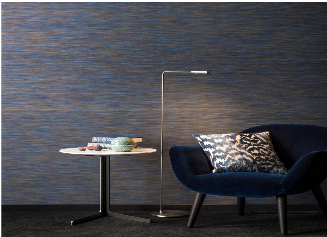
ELEGANCE: Det er navnet på dette tapetet fra Omexco der en varm kobbertone ligger og lurer under det dype blå. Her er vi godt inne i atmosfæren av en herlig måneskinnskveld. Tapetet føres av INTAG.