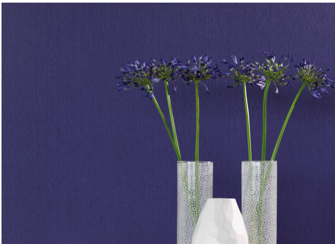
LIN: I kolleksjonen Pure Linen hos Borge fant vi en spennende blåtone, den har mer rødt i seg enn de andre vi har sett på og virker derfor varmere. De fine lintrådene er beskyttet med et tynt belegg som gjør overflaten robust.