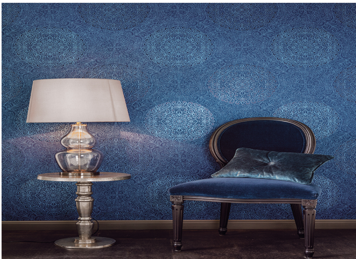
MAROKKANSK: I tapetkolleksjon Aida fra Borge er det blåfarge og mønster som gir assosiasjoner til marokkanske og orientalske stemninger og fløyelsmyk nattehimmel.

– En kjent og kjær farge som det er helt riktig å ta fram igjen. I kombinasjon med de andre blåtonene blir den tradisjonsrike fargen ny og moderne, sier den kreative lederen.