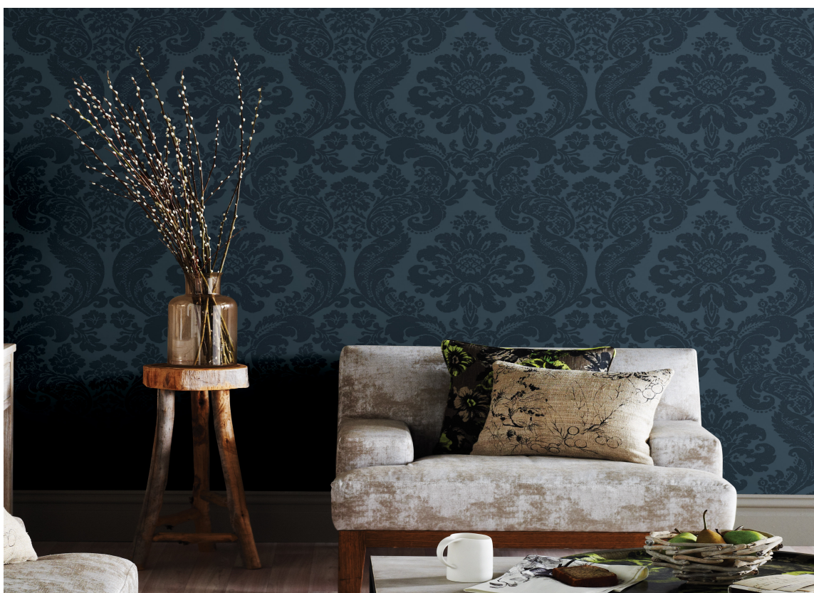
MÅNESKINN: Det er mange nyanser på en nattehimmel. I dette tapetet fra kolleksjonen Moonlight fra Storeys er det to gode nyanser å spille videre på og mønster som kler moderne så vel som klassiske rom.