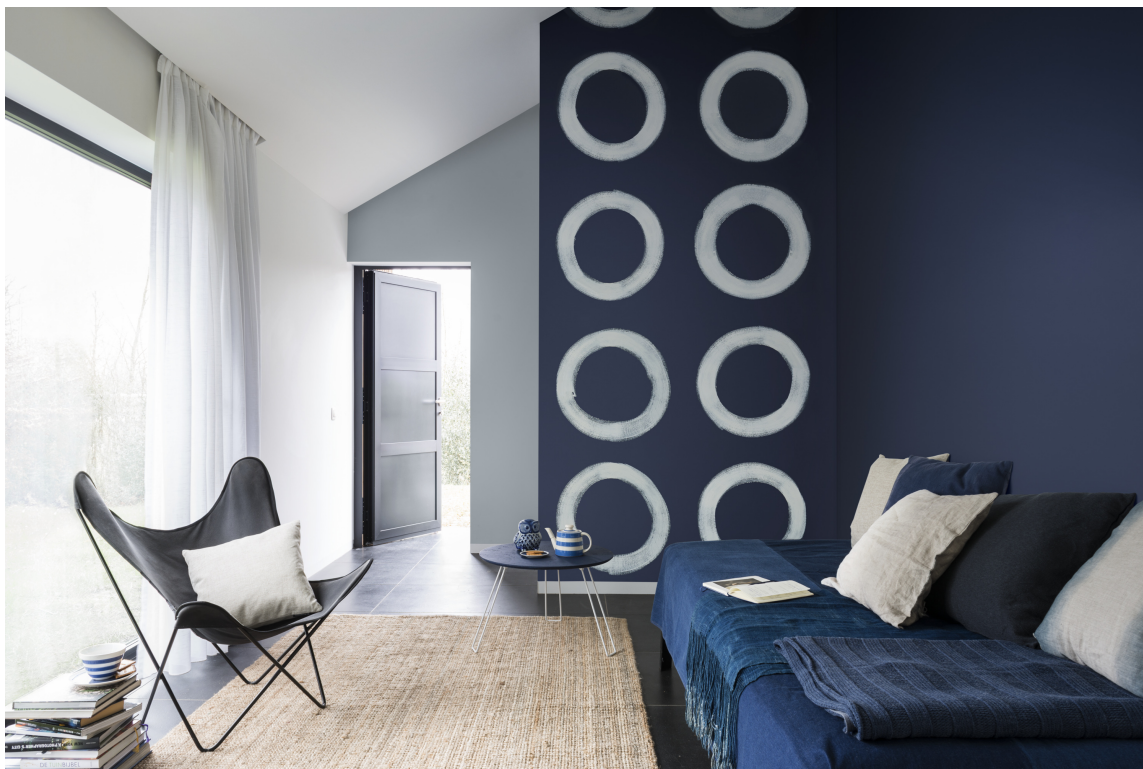
DENIM: Maling kan blandes i et utall nyanser med mange glansgrader. Nordsjö lanserte fargen Denim Drift i fjor, da de hadde blått som årets farge. Fortsatt meget aktuell altså!