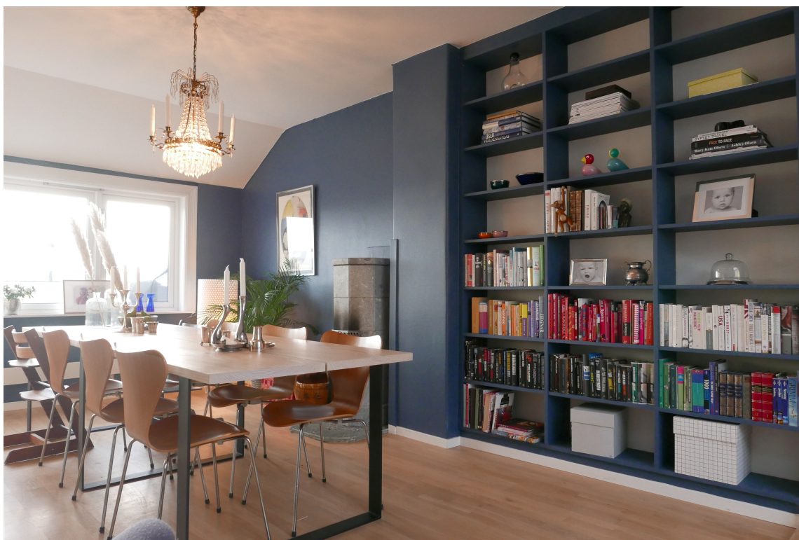
HAVBLÅ: Butinox har fargen 5898 Havblå / S 6020-R90B. I denne stuen er veggene malt med malingen 3-i-1 Stue & Sov Matt. Bokhyllen er malt i samme farge med halvblank glans.