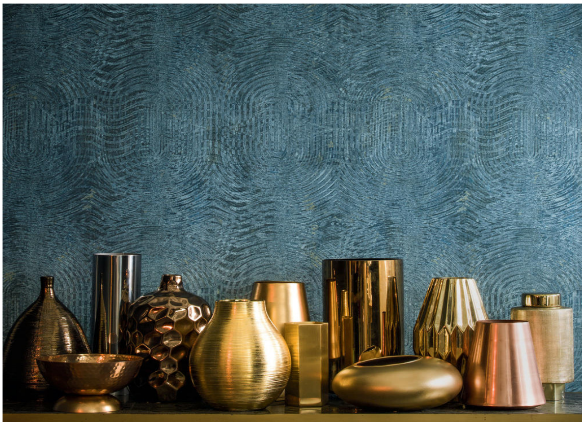
METALL: Tapetet Copper fra Casamance har overflate og fargespill inspirert av overflaten på metaller. Dype blå og blågrønne nyanser glir elegant i hverandre og gir flaten et helt spesielt uttrykk uten at veggen virker mønstret. Tapetet føres av Gre