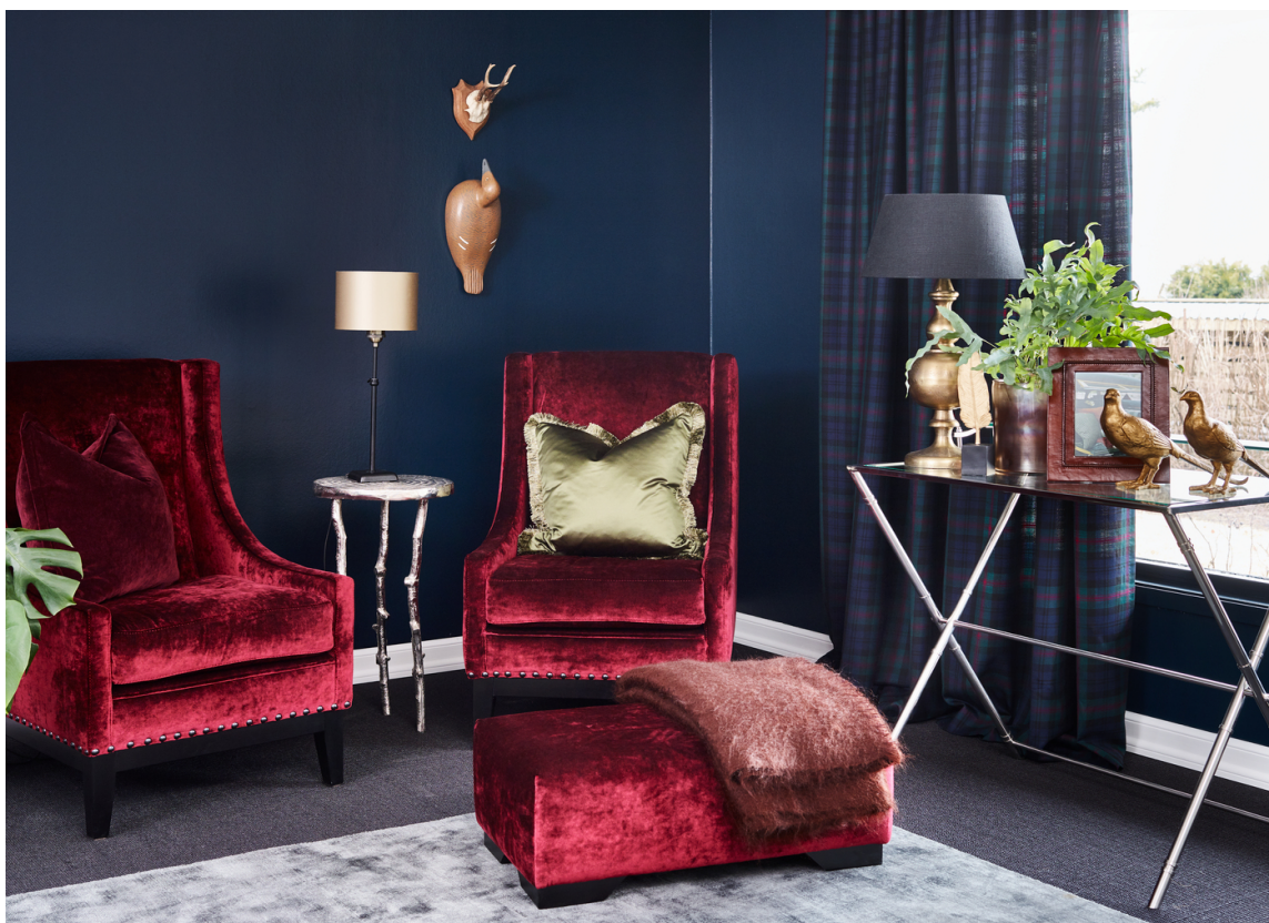
ÅRETS FARGE: Fra paletten Natthimmel har Fargerike valgt fargen Havdyp FR2515 til veggene i denne stuen. Sammen med velur og andre myke tekstiler får rommet en sofistikert karakter.