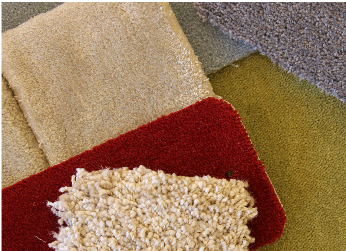
EGENSKAPER: Heldekkende tepper finnes i mange farger og kvaliteter, med ulike egenskaper. Hva passer best hos deg?