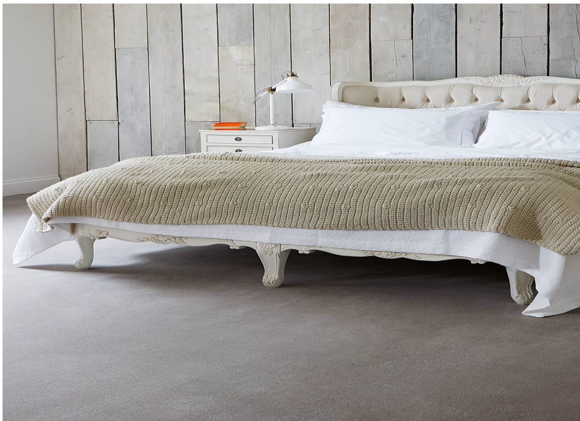
ATMOSFÆRE: Heldekkende teppe luner og demper akustikk. Har du et trekkfullt hus anbefales ull. Teppet er fra INTAG.