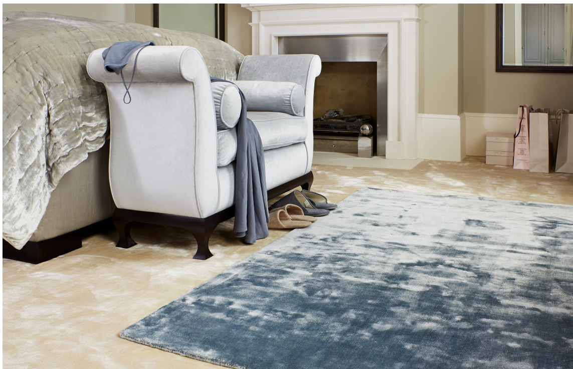
LAG PÅ LAG: Teppe på teppe i myk tencel-kvalitet for den som drømmer om litt ekstra luksus i hverdagen. Teppe fra INTAG.