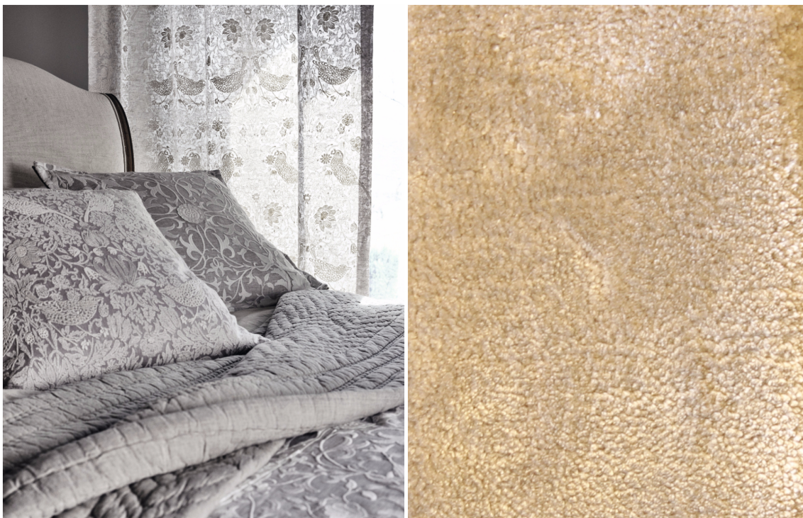
SOMMERFØLELSE: Med teppe på gulvet og lette tekstiler får man litt sommerfølelse hver morgen.