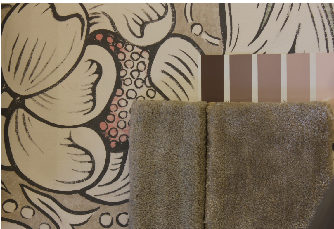
PRØVER: Bruk tid og lek med kombinasjoner av tapet, farger og teppeprøver for å finne den atmosfæren du ønsker. Tapetet er fra Morris/INTAG.