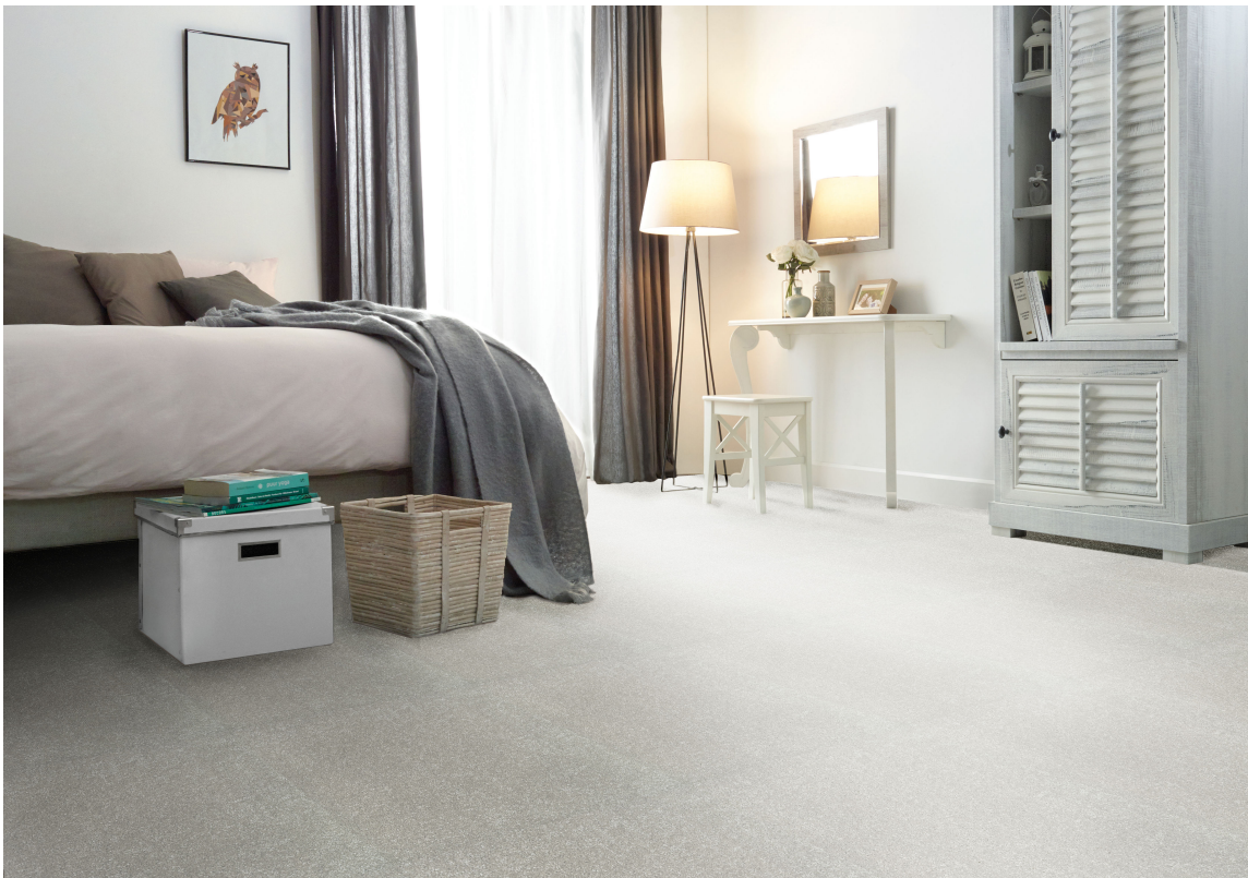
TEPPEFLISER: Teppeliser er et alternativ til teppe på rull. Dette myke gulvet er fra Golvabia.