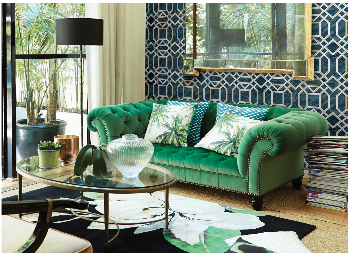
MAGEFØLELSE: Stol på magefølelsen. Hvis en sterk farge og mønster frister, går du for det! Du blir ikke lei hvis det kjennes bra. Tapetet Moonlight er fra Storeys.