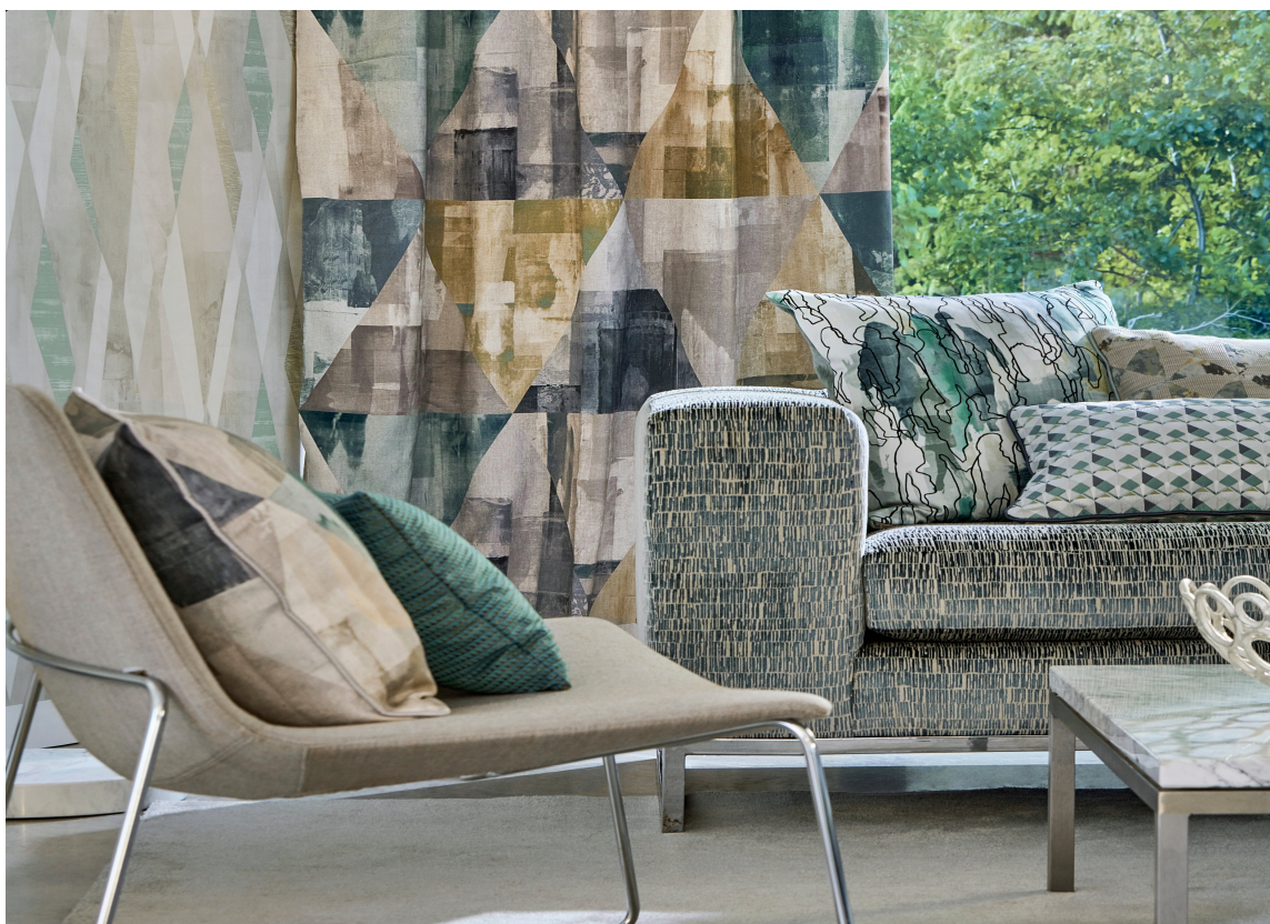
LAG PÅ LAG: Grønt i ulike nyanser kler hverandre, og vi er vant til det fra naturen. Ikke vær redd for lag på lag med grønt når du finner tekstil og tapet du liker. Utvalget her er fra Harlequin/Tapethuset.