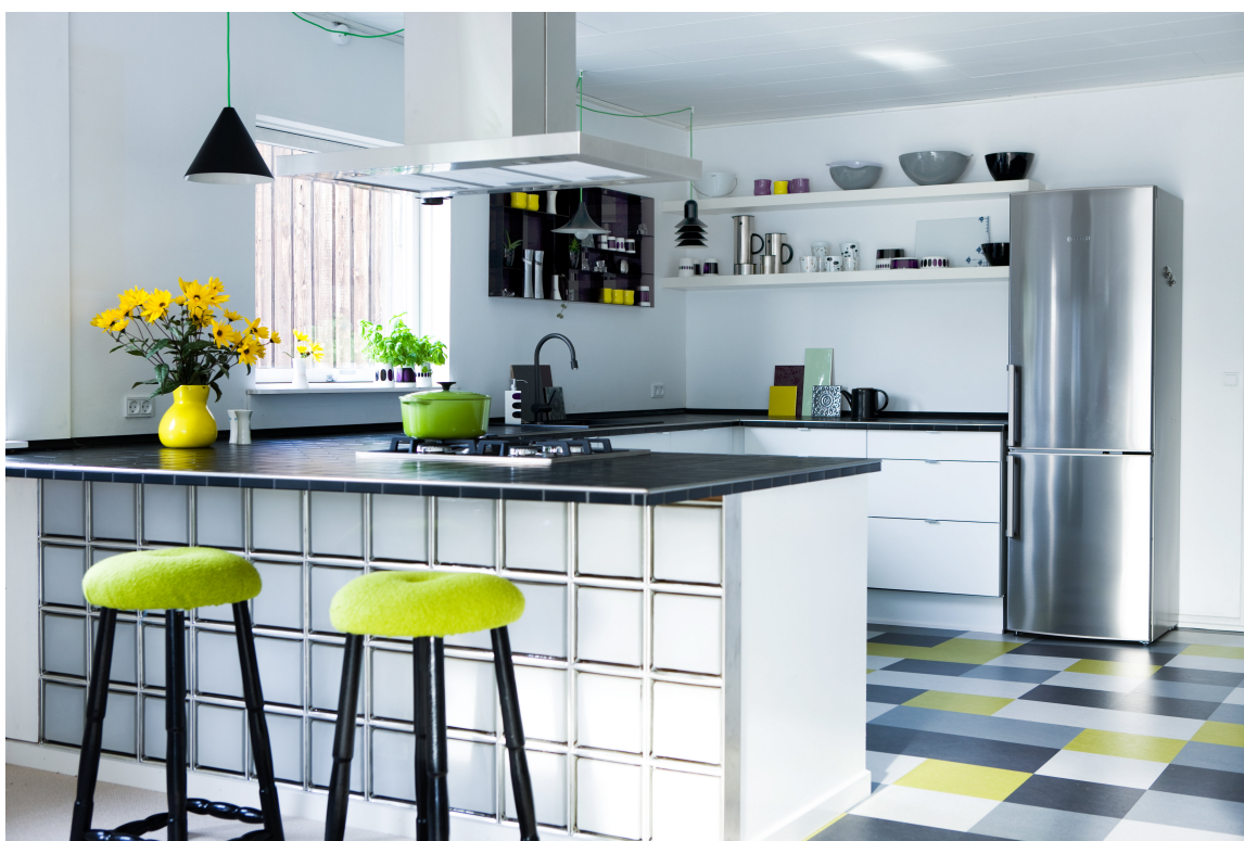
MARMOLEUM: Med hvitt og grått som basis kan man slippe seg løs med fargeklattene. Noen få fliser i limegrønt er alt som skal til for å gjøre kjøkkengulvet litt muntert. Marmoleumflisene er fra Forbo.