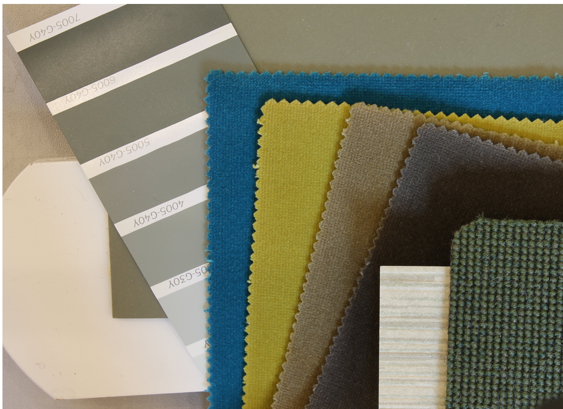
LIMEGRØNT: En liten dasj limegrønt og frisk petrolfarge (turkis) skaper liv i en ellers forsiktig palett. Grønn velur fra Green Apple, Linoleum fra Forbo og teppe fra Danfloor.

– Kjøleskapet har blitt et muntert blikkfanget, i et ellers hvitt kjøkken. Det er nok en farge de fleste ikke ville tenkt seg, men det ble så fint, og jeg har fått masse hyggelige kommentarer på det, sier Osvold.