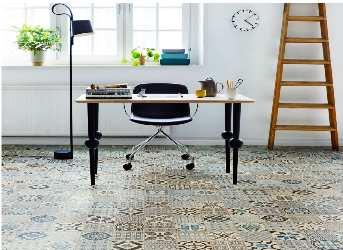
MØNSTER: Et vinylgulv med marokkansk flisemønster har mange farger/nyanser som kan matches med ensfargede gulv i andre materialer.