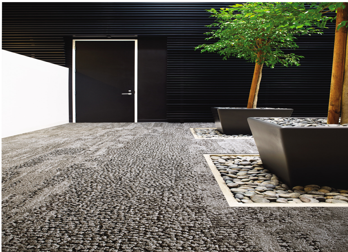
TEPPEFLISER: Med teppeflisene Human Nature fra Interface får man naturen inn i huset både taktilt og visuelt. Teppefliser som blant annet illuderer småstein er laget av 100% resirkulert garn.