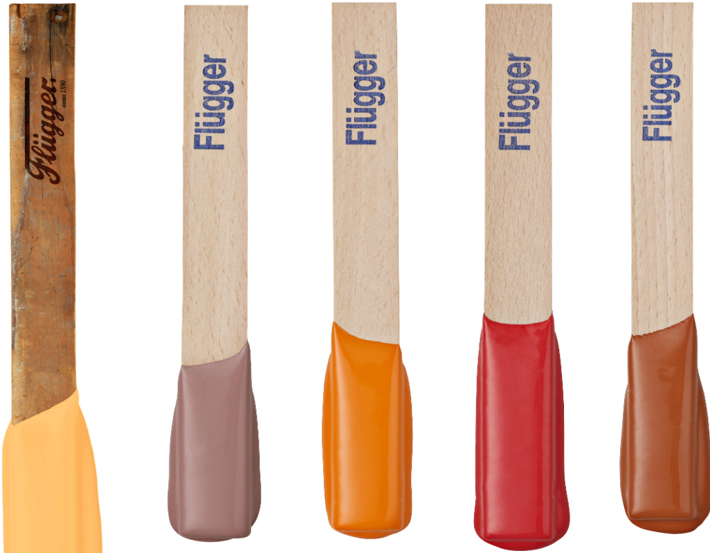
FRA NATUREN Disse fargene er å finne i høstlige busker og trær, og kan tones ned eller opp etter ønske.