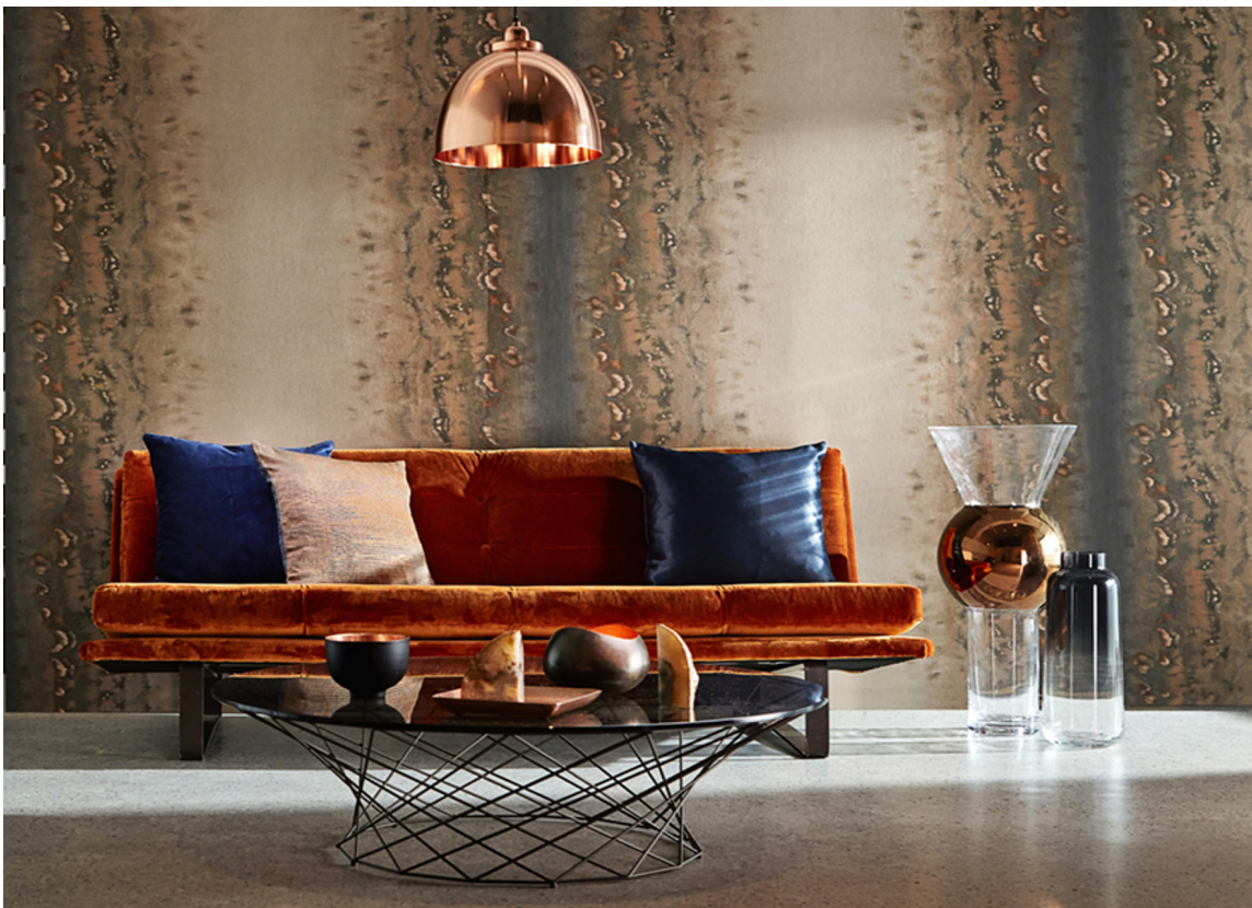
HETT Tapet fra Harlequin, med metallinnslag, samt lampe i kobber og velursofa står nydelig mot betonggulvet.