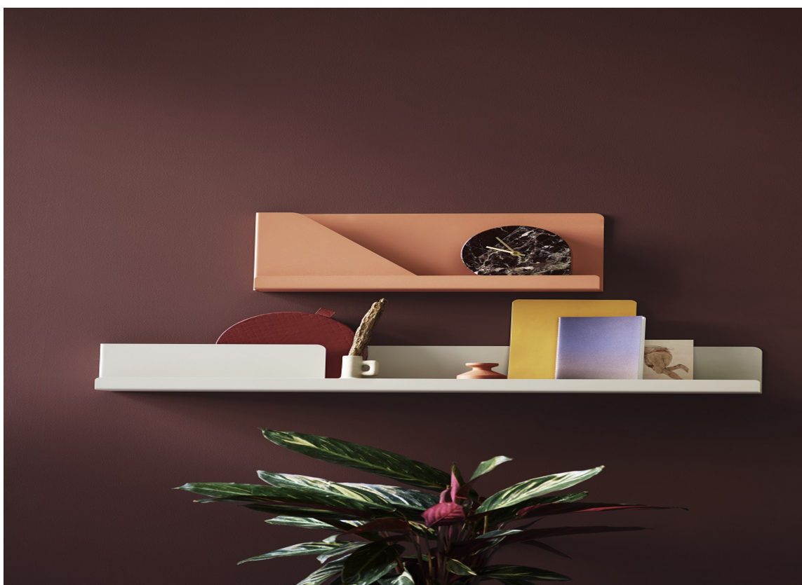
HØSTPALETT Farger fra Flügger – som plukket fra fargekartet hagen byr på nå...