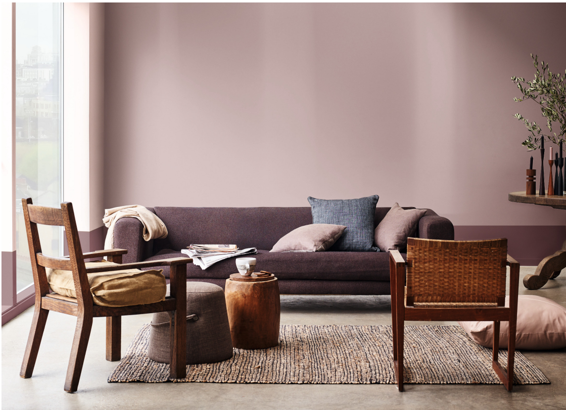
PLOMMENS FARGE Årets farge for 2018, Heart Wood, fra Nordsjö finnes også ute nå.