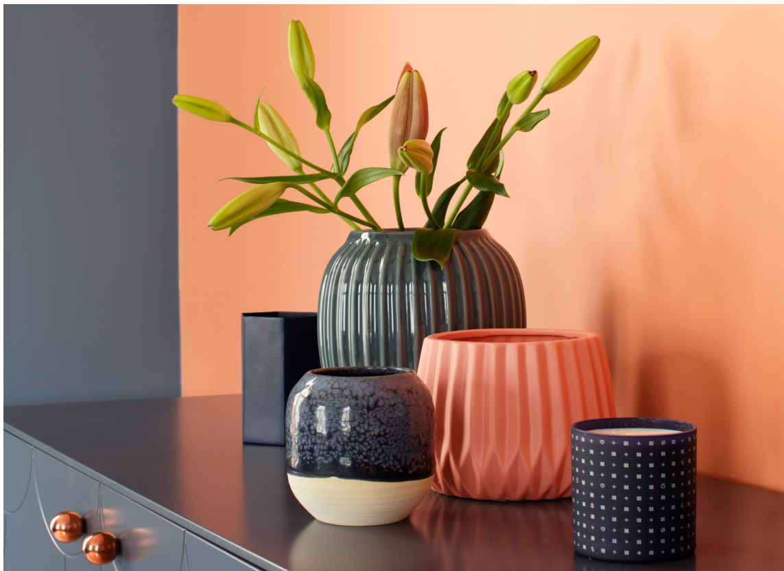
FRISKT En nyanse av oransje fra høstfargene, i god kombinasjon med blått. Fra Butinox.

Det skrives og snakkes mye om å «ta naturen inn», og dette er vel årstiden for virkelig å la seg inspirere fargemessig mer enn noen. Det er ikke dermed sagt at det er de kraftigste fargene som skal havne på tak, vegger, gulv og tekstiler. Det aller viktigste er å få lyst til å tilføre farger i interiøret, og så må du finne de nyansene som passer deg og ditt.