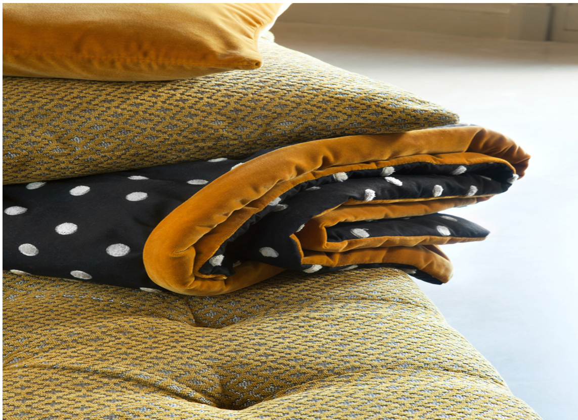
GYLLENT Tekstiler fra Lizzo har gulfarger som lett lar seg mikse med andre farger.

Før løv og blader blir veldig fargesterke har de gjennomgått en fargetransformasjon i flere grader og nyanser. Det er mange spennende farger å oppdage underveis, ikke minst når grønt bryter i flere retninger, som mot gult og rosa-lilla. De nyansene er det fort gjort å gå glipp av, for de kraftige rød-oransje kulørene overskygger dem.