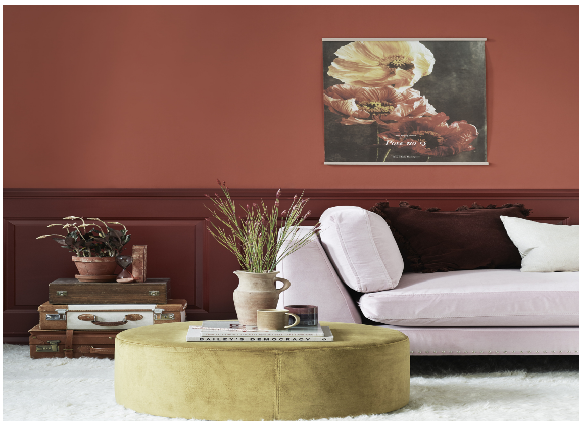
VARMT OG KALDT Malt, tofarget vegg i dempede, varme farger fra Beckers, med sofa i kjølig rosa som god motsats.