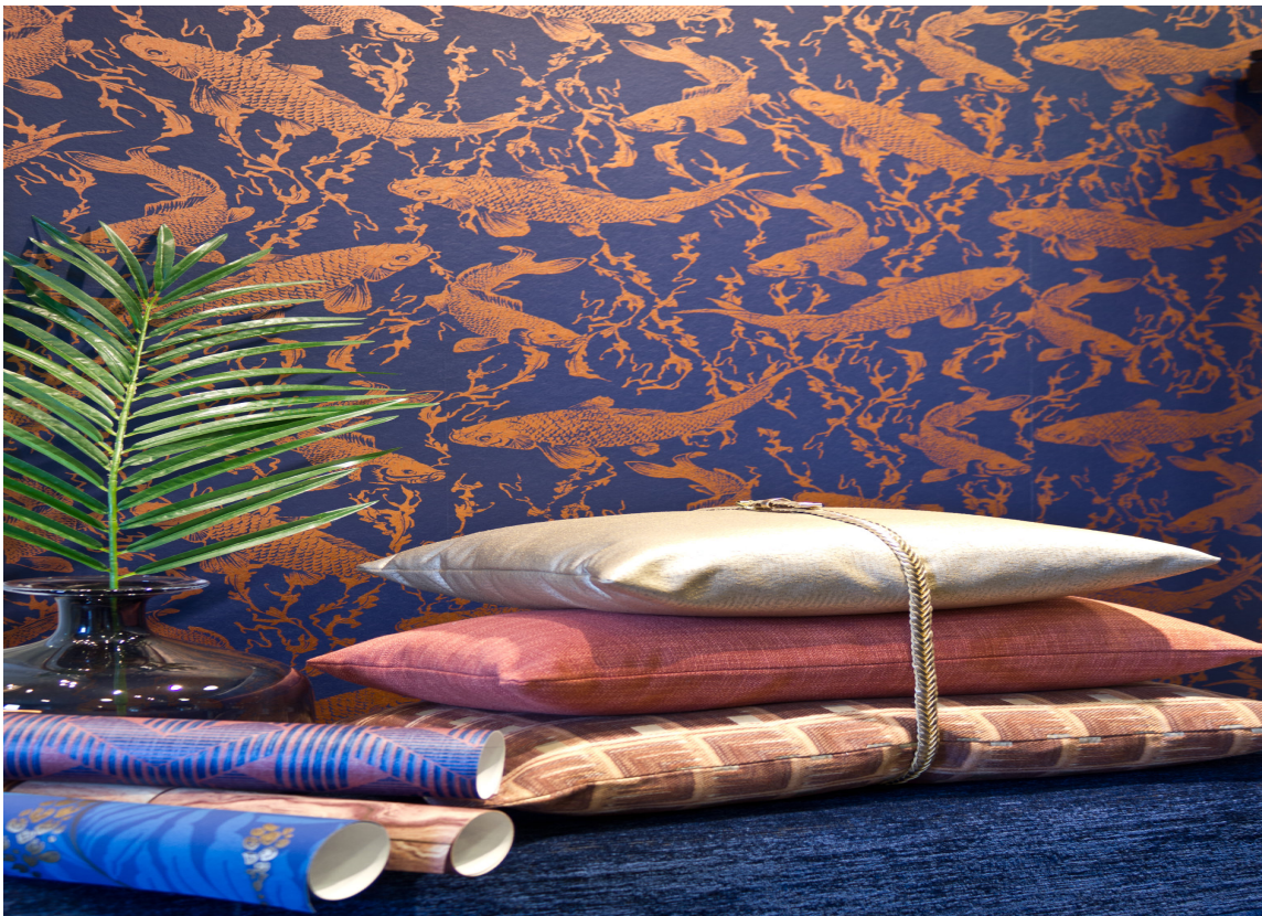
GYLNE FISK Fisk i en varm kobberfarge mot den kjølige, blå tapetbunnen fra finndintapet.no er riktig så lekker.