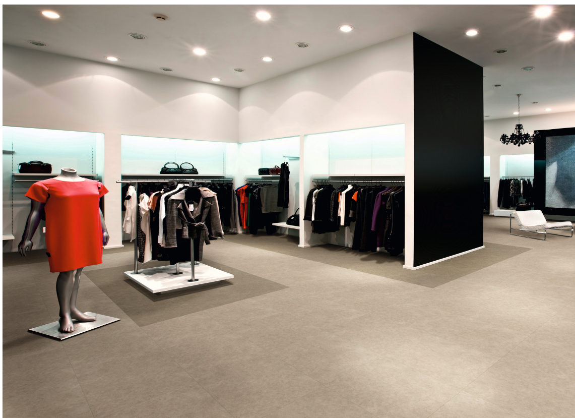
LØSTLEGGING: Expone Simplay og andre gulv for løstlegging legges raskt og kan tas direkte i bruk.