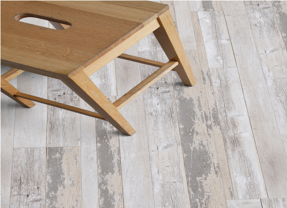
DESIGNGULV: Moderne produksjon med pregede, matte overflater og et detaljert mønstersjikt gjør at designgulvene er svært naturtro etterligninger av ekte materialer.