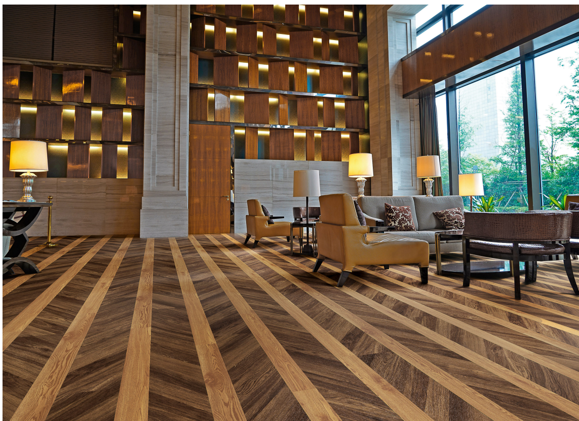
FISKEBEIN: Med LVT er det enkelt og raskt å legge et fiskebeinsmønstrret «tregulv». Denne nye variant fra Polyflor har mønsterbildet stilt på skrå, slik at det dannes fiskebeinsmønster når bordene legges i vanlig forband.