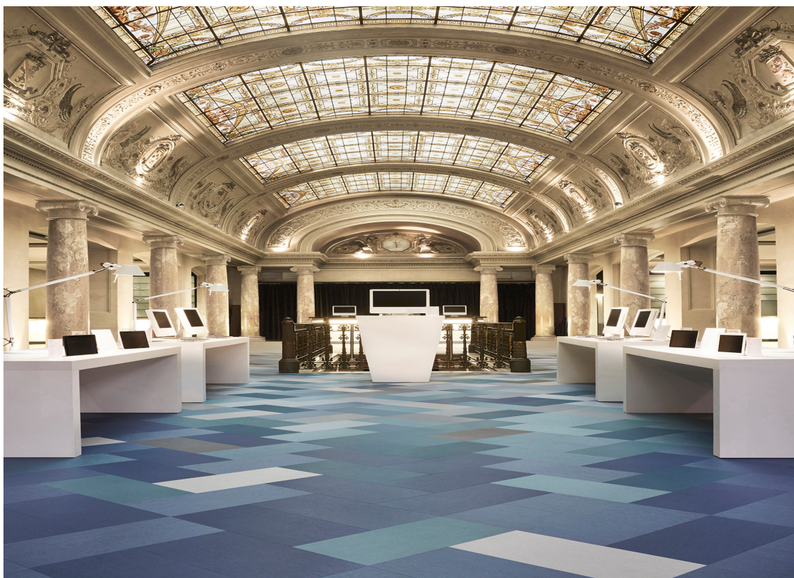
EGET DESIGN: Med LVT kan du designe helt unike, egne gulv.