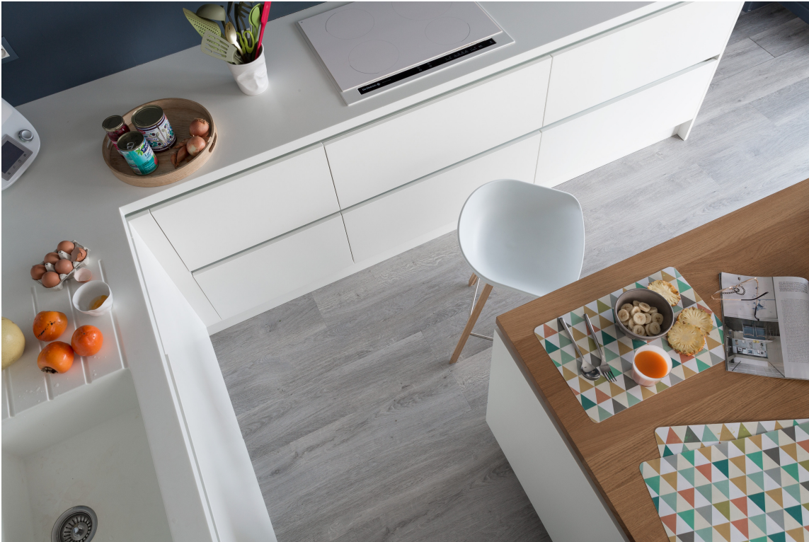
LIMFRITT: LVT som monteres limfritt etter not-og-fjær-prinsippet er et utmerket oppussingsprodukt for boligmarkedet. Siden det bare er noen få millimeter tykt, kan det mange ganger legges over eksisterende gulv.

Klikk-vinyl, eller LVT med limfri låsefunksjon i skjøtene, brukes gjerne i boligmiljøer og prosjekter med lettere slitasje. Eksempler kan være utleieboliger, hoteller og private boliger. Det finnes også varianter for høyere bruksklasser som kan brukes i tungt trafikkerte områder. Gulvet gir god gangkomfort og oppleves som varmt å trå på. Produkttypen er egnet til bruk både ved nybygg og renovering, og leggingarbeidet er både raskt og smidig med bruk av få verktøy. Monteringen genererer lite støv og støy, og gulvet kan tas i bruk umiddelbart. Gulvet kan legges oppå eksisterende gulv, og det kan også tilbakeføres hvis ønsket.