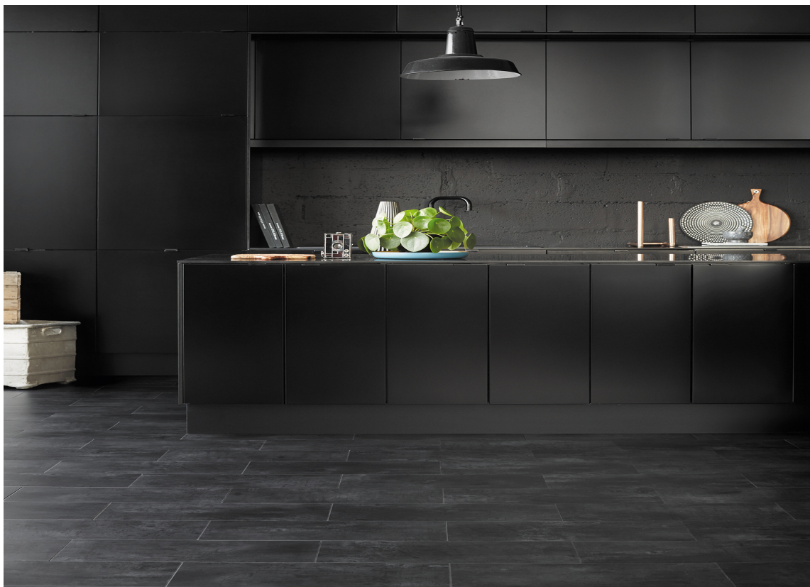
KLIKKFUGING: I boligmiljøer brukes gjerne LVT med limfri klikkfuging. Gulvet tåler mye, og kan også brukes i prosjekter med lettere belastning.