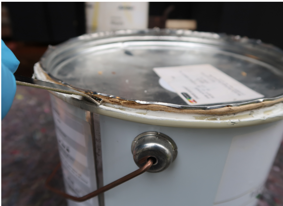
UTETT: Utett boks eller ødelagt lokk? Ikke noe mer å samle på.