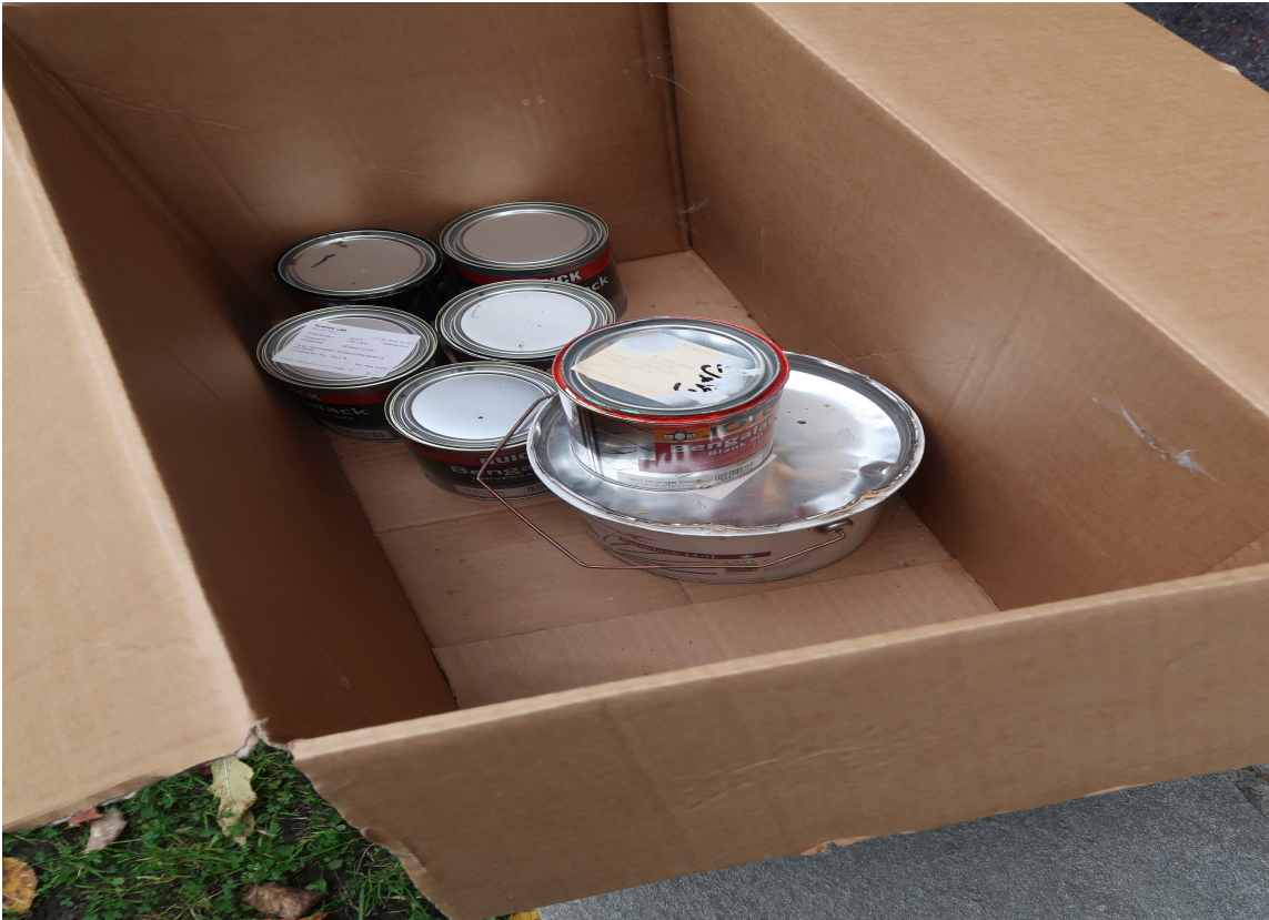
SPESIALAVFALL: Bokser med maling er spesialavfall. Sett dem i en eske for seg, så unngår du å måtte sortere når du står på søppelstasjon.