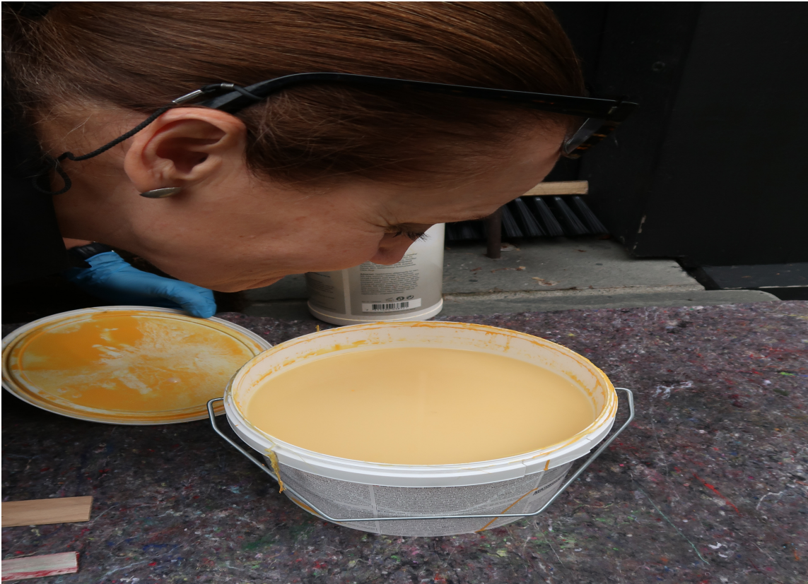
LUKT: Nesten fullt spann, men lukter det ok? Lukter det rart eller mugg, så vekk med spannet!